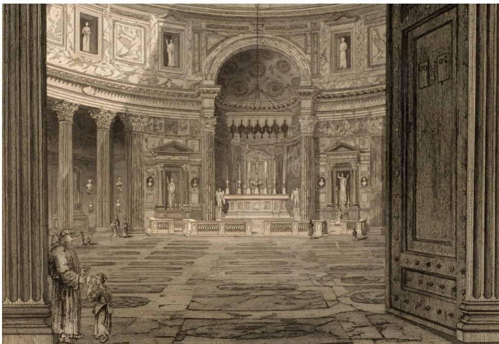
Fig. 6. G. L. Taylor. El Panteón de Roma: vista interna (detalle del ábside y baldaquino) en The Architectural Antiquities of Rome , aguafuerte, 1821. Royal Academy of Arts, Londres.