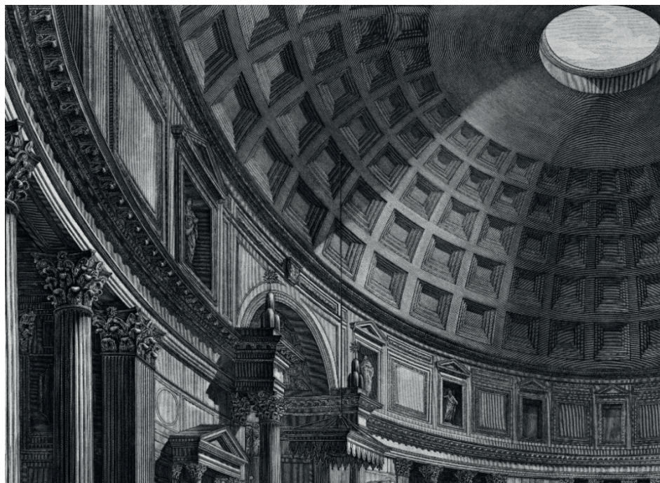
Fig. 5. Francesco Piranesi. «Veduta interna del Pantheon» (detalle de las pinturas del ático), en Seconda parte de' tempj antichi che contiene il celebre Pantheon, aguafuerte, 1790 . F. Piranesi, Roma.

El énfasis puesto en la belleza del óculo lo vemos mejor reflejado en el cuaderno de notas del viaje que realizó Hawthorne en Italia, donde describe la presencia de la naturaleza. Hace hincapié en el trozo de cielo que muestra la abertura y en la luz que deja pasar, la cual se proyecta en el interior del edificio, uniendo lo divino con lo terrenal (Hawthorne, 1871: 238-239). Asimismo, también se hace una crítica feroz a las incorporaciones católicas de la basílica de San Pedro y el Panteón: «colocan confesionarios de madera de aspecto miserable bajo sus sublimes arcos, y los adornan con pequeños grabados de colores baratos de la crucifixión [...], colocan estatuas de santos de cartón bajo la cúpula del Panteón; en resumen, dejan que lo sublime y lo ridículo se acerquen» (Hawthorne, 1871: 103). De hecho, en la reconstrucción del ático del Panteón se siguió el modelo marcado por Carlo Fontana, en el que incluía una serie de nichos coronados con frontones para albergar las esculturas de distintos santos. Sin embargo, no se llevó a cabo, ya que estas esculturas se sustituyeron por pinturas de grisallas simulando un trampantojo (Fea, 1820: 11; Torres, 1838: 10-11; Pasquali, 2005: 346-348). Es decir, son las esculturas de cartón a las que se refiere Hawthorne tanto en su cuaderno de viaje como en la novela [Fig. 5].