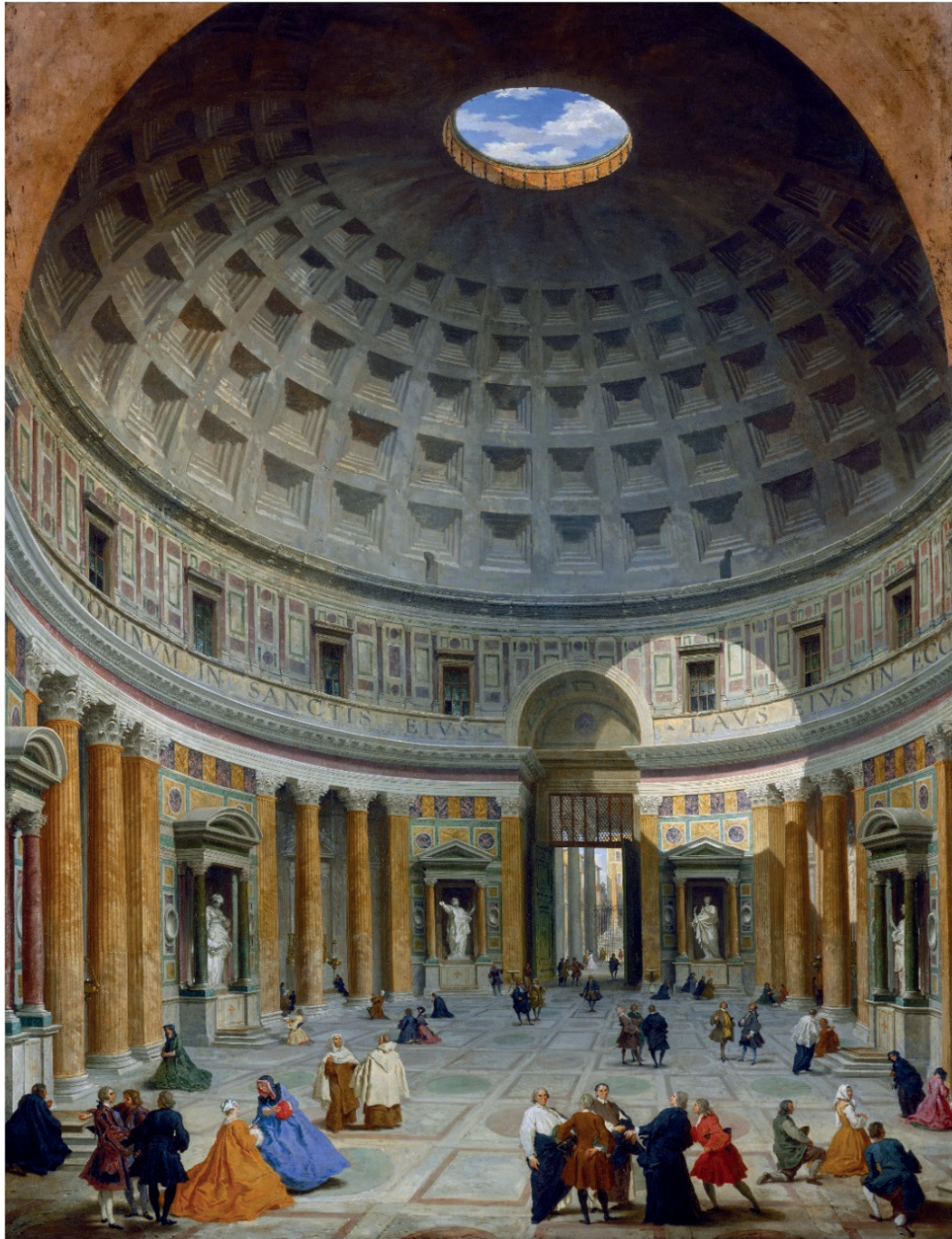
Fig. 1. Giovanni Pannini. Interior del Panteón, óleo sobre lienzo, 1734. National Gallery of Art, Washington DC.

De esta manera, se representó cómo era el Panteón antes de la sustitución y destrucción del ático, dando visibilidad a la antigüedad del edificio a través de la luz que proyecta el oculo y que cae sobre las antiguas losas de mármol del ático —lo que también evidenció el estado deteriorado y el paso del tiempo sobre estos materiales— [Fig. 2]. A pesar de que se destacaba su gran fidelidad a la hora de trasladar el estado real del edificio a la pintura, lo cierto es que Pannini se tomó ciertas licencias como la de eliminar las pinturas