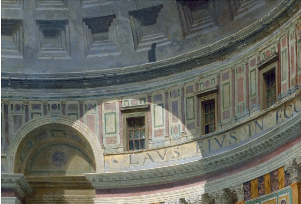
Fig. 2. Giovanni Pannini. Interior del Panteón (detalle del ático), óleo sobre lienzo, 1734. National Gallery of Art, Washington DC.

que se encontraban en los edículos cercanos a la entrada, sustituyéndolas por esculturas que se situaban en otras zonas del Panteón (Bowron y Rishel, 2000: 419).