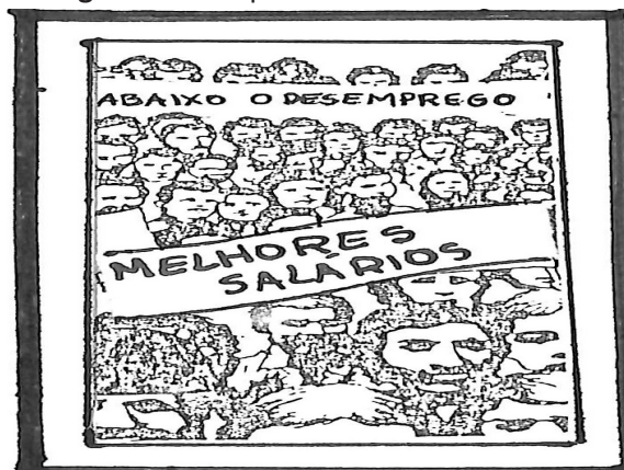
Imagem 4. Os impasses do novo sindicalismo

Podemos perceber que o CEDIP, assim como os movimentos sociais e políticos que representava e assessorava, alinhado aos discursos de movimentos de alcance nacional, entendia o trabalhador como pertencente ao sexo masculino, pois este estaria supostamente ligado ao processo de produção de riquezas fora do ambiente reprodutivo. Corroborando com essa ideia, outra imagem ligada à reivindicação de melhores salários e empregos também reproduz a lógica masculinista de trabalho e produção.