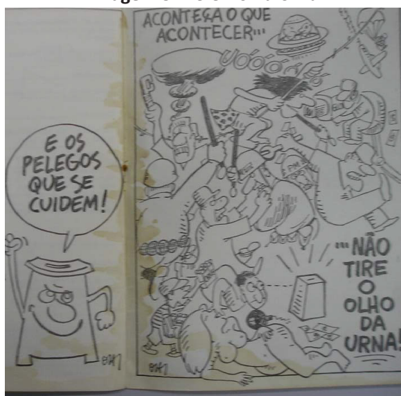
Imagem 5. De Olho na Urna