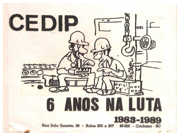
Imagem 2. CEDIP 6 anos na luta

desta premissa, no flyer comemorativo de seis anos de existência do centro, podemos observar: