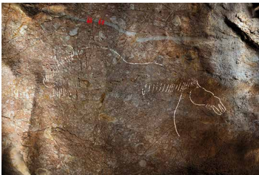
Figura 3. Bisonte y caballo grabados en oposición al final del tramo decorado de la galería inédita (O. Rivero, D. Garate).

Desde el punto de vista formal, observamos una serie de convenciones homogéneas como la ausencia de perspectiva tanto en las extremidades inferiores (patas) como en las superiores (cuernos), el escaso detalle de características anatómicas (ojos, pezuñas, boca, etc.), una desproporción general de las distintas partes anatómicas y, en general, un grado de realismo poco desarrollado para las representaciones animales. En el caso de las vulvas, se componen exclusivamente de tres trazos grabados, dos inclinados más largos y unidos en el vértice inferior, y un tercero mucho más corto unido en el mismo punto. Todos los trazos que conforman las vulvas se encuentran más o menos curvados.