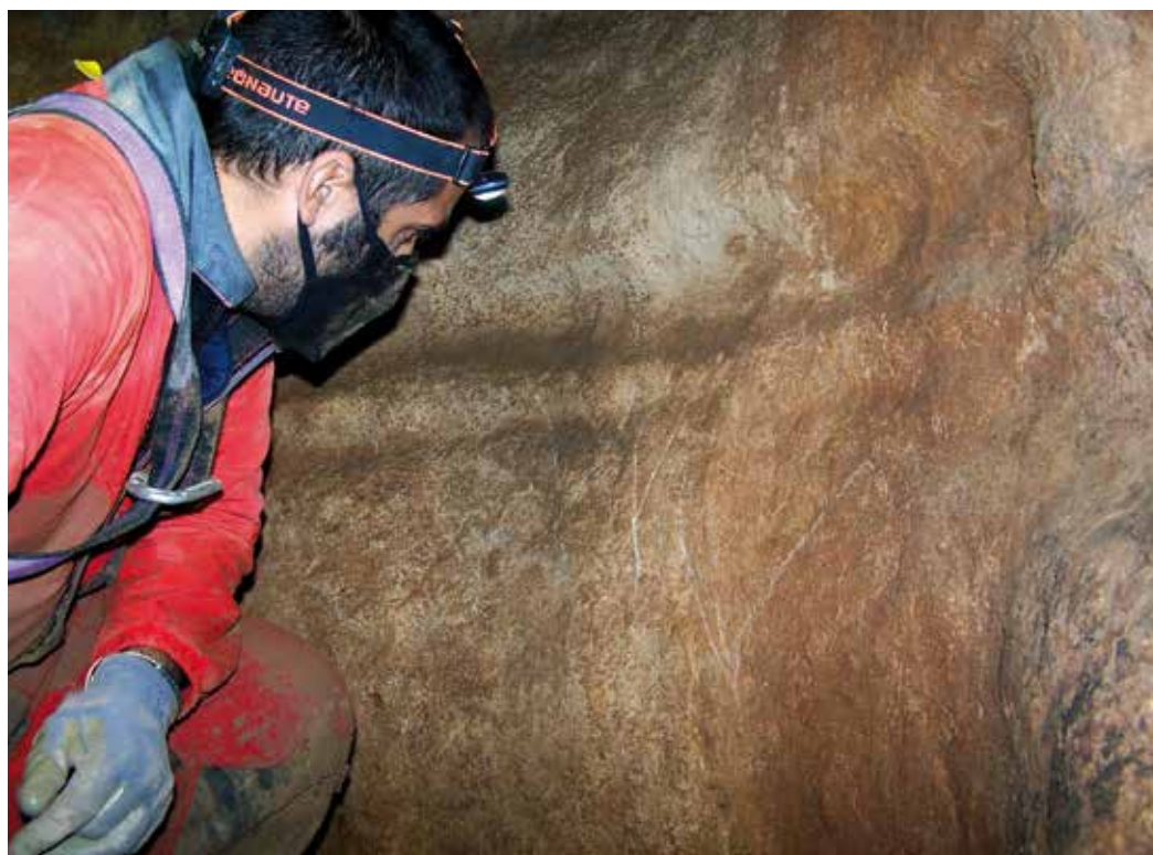
Figura 2. Detalle de las vulvas grabadas en la entrada de la galería inédita.

En una primera valoración, a falta de procesar toda la información recuperada in situ , hemos detectado un total de diez paneles decorados con una cantidad variable de figuras en cada uno de ellos (entre 1 y 6). Destaca de manera notable un panel compuesto por varias representaciones de vulvas, un panel que contiene media docena de bisontes y uros grabados de tamaño muy variable, y otro panel con dos animales bestializados; un caballo y un bisonte dándose la espalda. A ellos se unen dos conjuntos de trazos pareados compuestos por 3 y 2 series respectivamente.