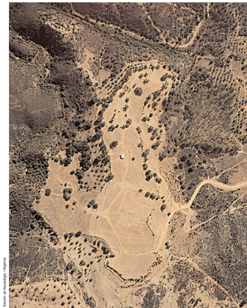
Sección de Arqueología / Argemá