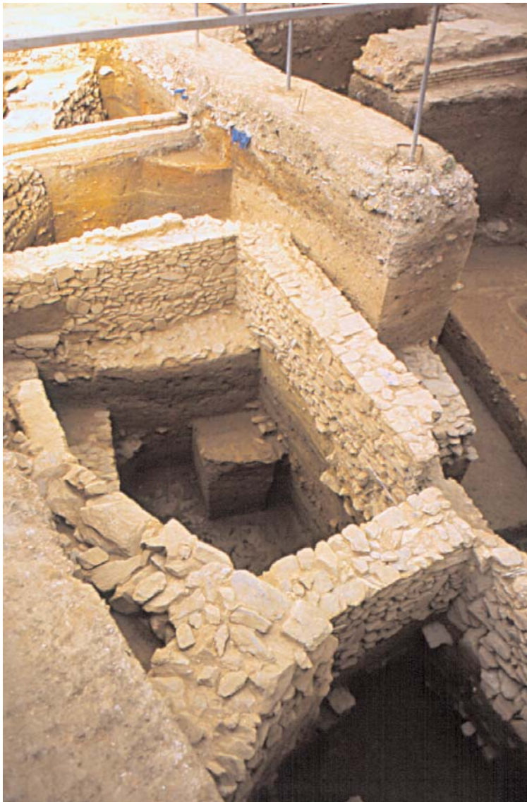
Sección de Arqueología