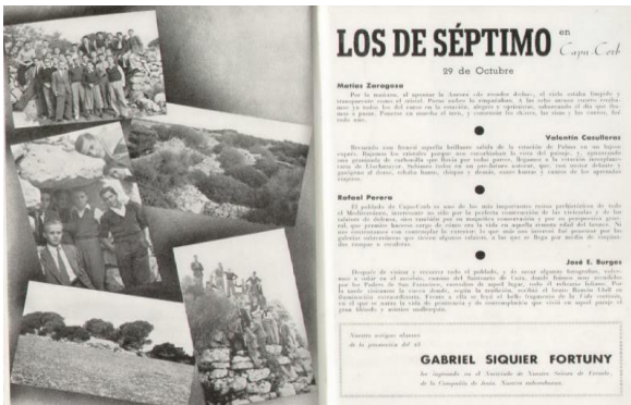
Figura 3. Crónica de la excursión llevada a cabo por el séptimo curso en el poblado talayótico de Capocorb, Lluçmajor (n.º 52, 1945).

En cuanto a las festividades y eventos académicos, se puede observar que se hacía especial hincapié a los actos que exclusivamente se celebraban en los colegios de la Compañía de Jesús. Sirvan de ejemplo los reportajes sobre las Fiestas de Brigada 17 , las Concertaciones 18 y la Promulgación de Dignidades 19 . Por otra parte, en los escritos en relación con las salidas escolares, los cronistas de curso detallaban y explicaban de manera exhaustiva aspectos como el medio de transporte utilizado, explicaciones recibidas, pausas realizadas, anécdotas, juegos propuestos, etc.