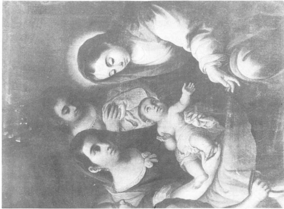
Lámina VII.—Detalle del grupo central