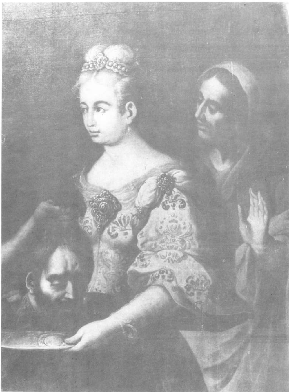
Lámina XIV.—Detalle de Salomé con la cabeza de San Juan Bautista y su madre Herodías