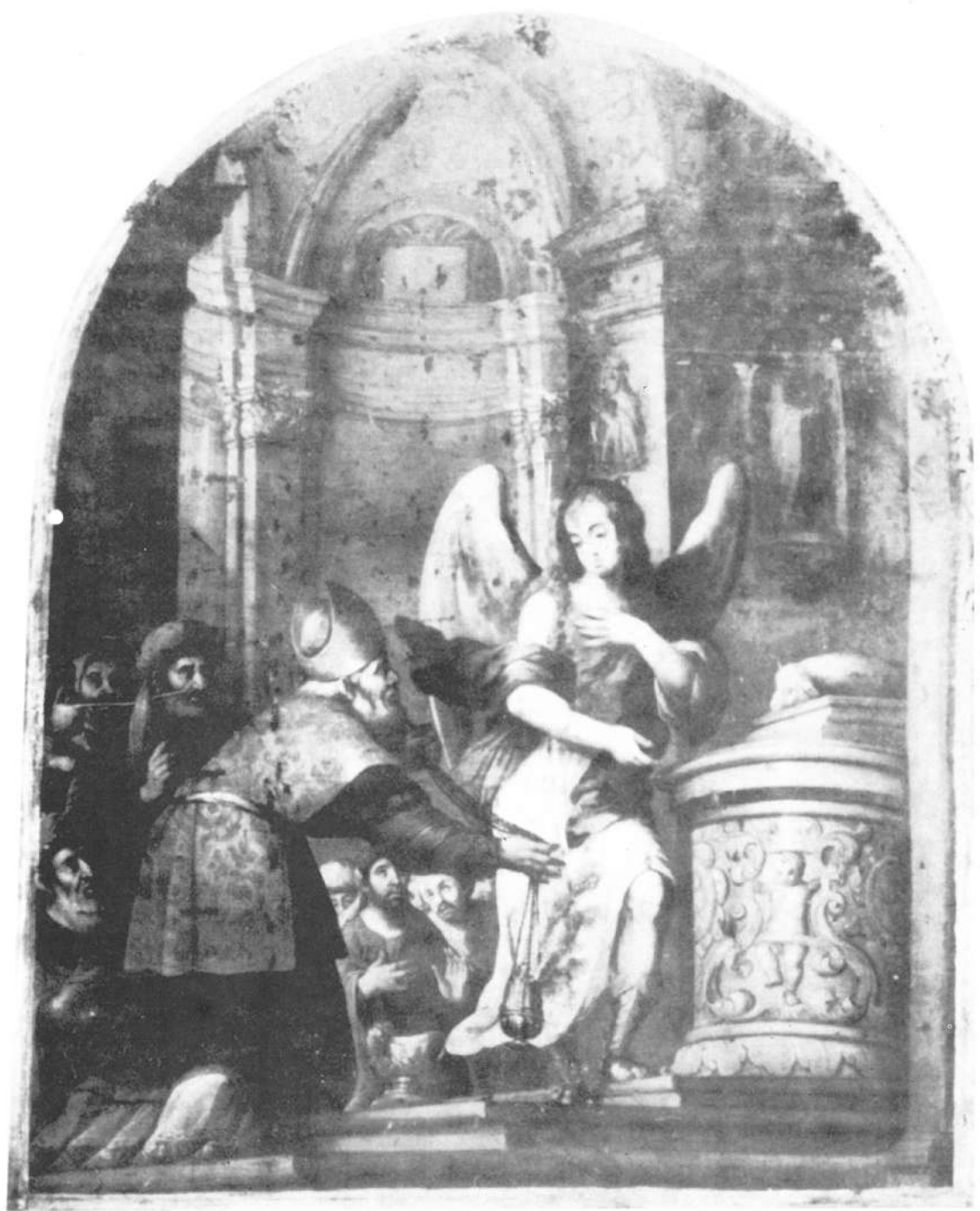
Lámina III.—El anuncio a San Zacarías