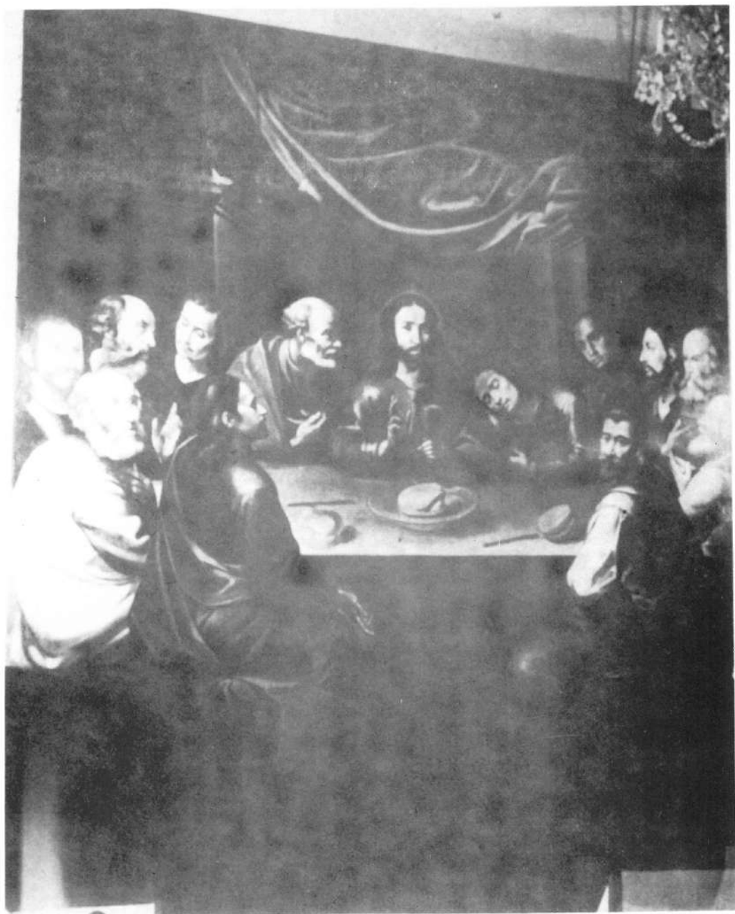
Lámina I.-La última Cena