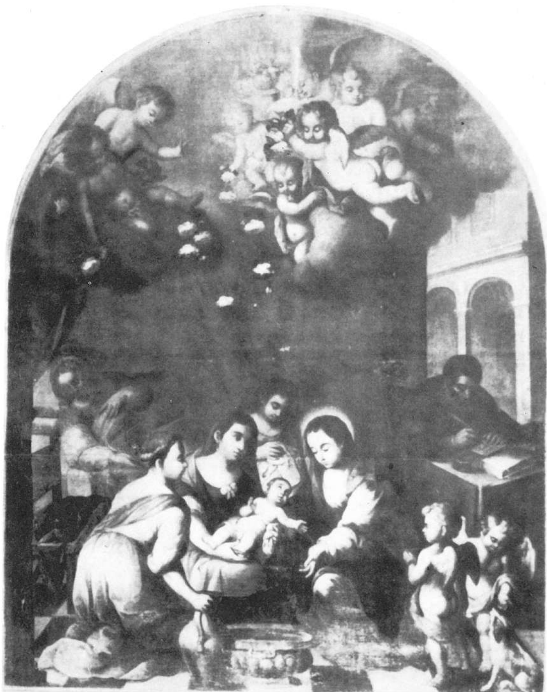
Lámina VI.- El nacimiento de San Juan Bautista