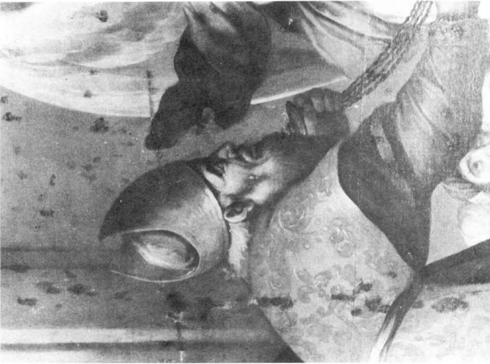
Lámina IV.- Detalle de San Zacarías