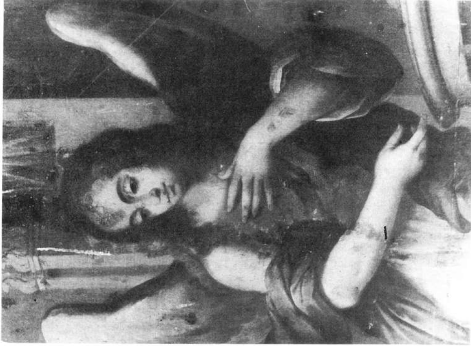
Lámina V.- Detalle del ángel Gabriel