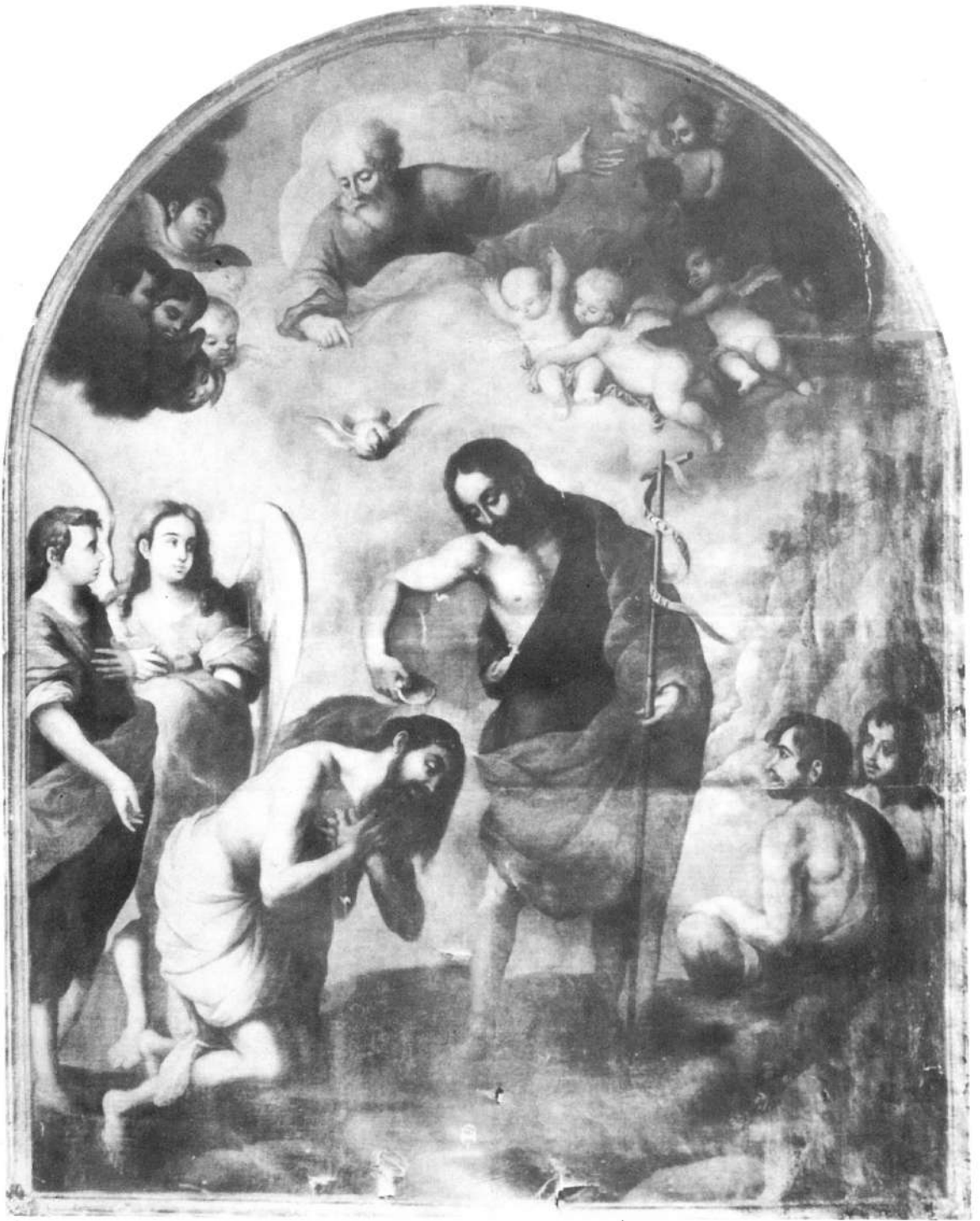
Lámina X.— El bautismo de Jesús