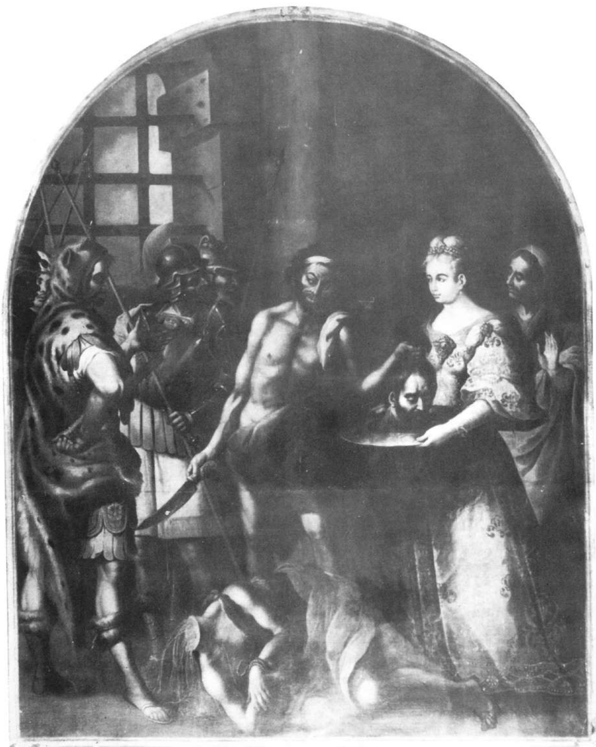
Lámina XIII.—La degollación de San Juan Bautista