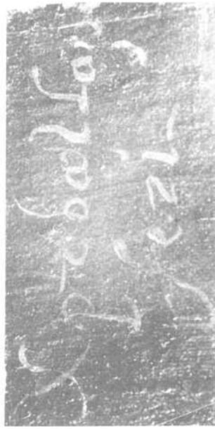
Lámina IX.—Detalle de la firma