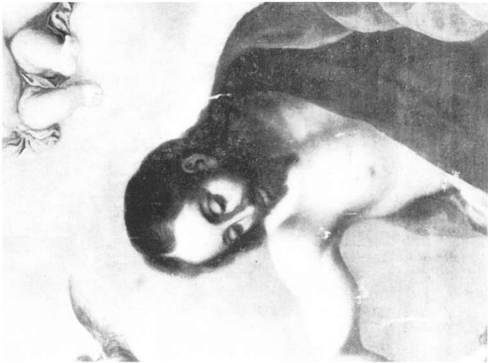
Lámina XI.-Detalle de San Juan Bautista