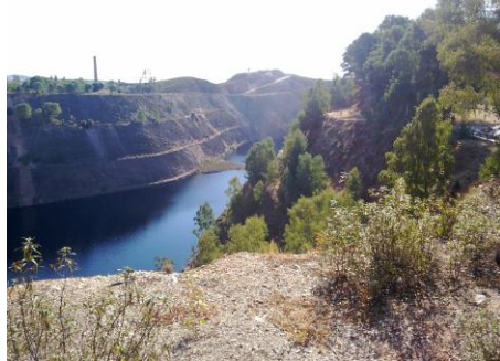
Rehabilitación paisaje minero. Tharsis

Seguidamente ya tendríamos los conocimientos suficientes para la óptima rentabilización turística de las zonas, diseñar rutas turísticas y rutas verdes que puedan descubrirse y explotarse.