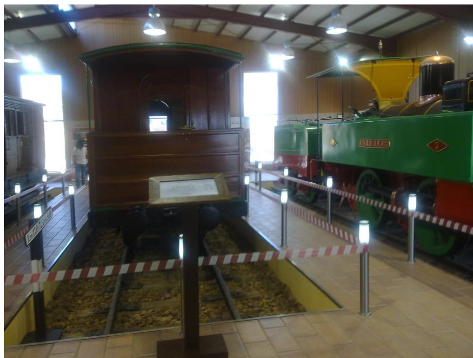
Museo minero Tharsis

puesta en valor de los sitios minero industriales es destacar la importancia de incrementar la conexión entre los testimonios del patrimonio industrial y sus recursos documentales.