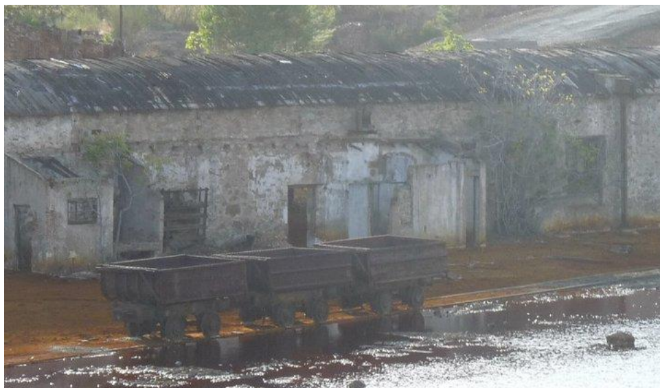
Una muestra de patrimonio a rehabilitar. Río Tinto

bien totalmente caducado y de consideración histórica. En cuanto a esta determinación, el proyecto que diseñemos deberá actuar sobre las zonas históricas, no sobre las zonas en manos de explotadores que las rentabilizan actualmente, para evitar conflictos, aunque siempre cabe la posibilidad de colaborar con estas entidades.