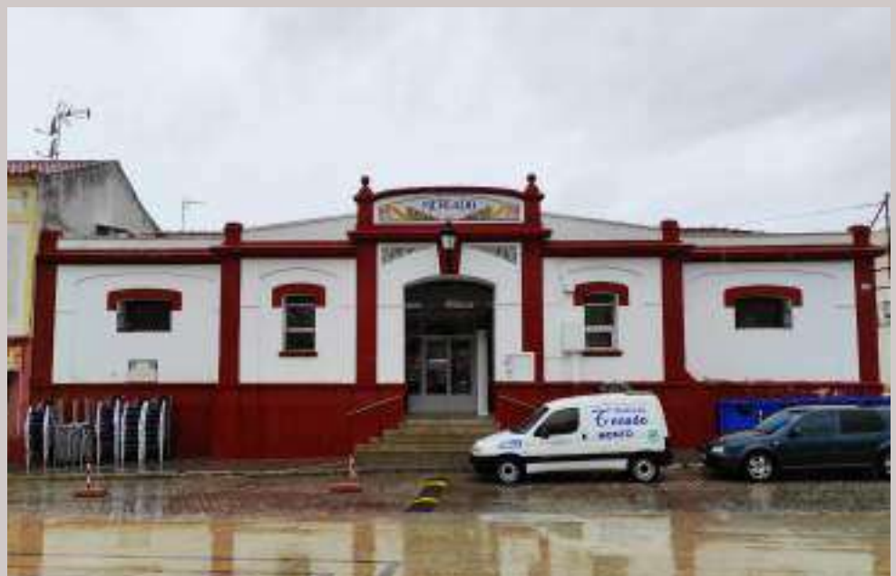
Figura nº 13. Fachada principal del Mercado de Abastos de Guareña, en la actualidad.

Esta normativa recoge en esencia, lo que posteriormente será definido como leche certificada, superando las exigencias establecidas en otras ordenanzas municipales como por ejemplo las de Mérida de 1902. Centralizando el ordeño, impidiendo el deambular de las hembras lecheras y con ello la garantía de sanidad de estas y evitando el fraude y las malas condi-