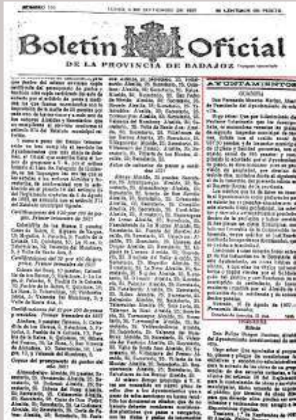
Figura nº 14. Convocatoria del concurso para cubrir una plaza de Inspector Municipal Veterinario en Guareña.

cación del Decreto 18-04-1952 y la Orden 31-07-1952, cuando se crean las Centrales Lecheras en los municipios de más de 25.000 habitantes y se dan las normas para la vigilancia y las exigencias