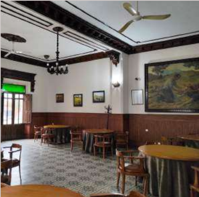
Figura nº 18. Interior del Casino de Guareña.