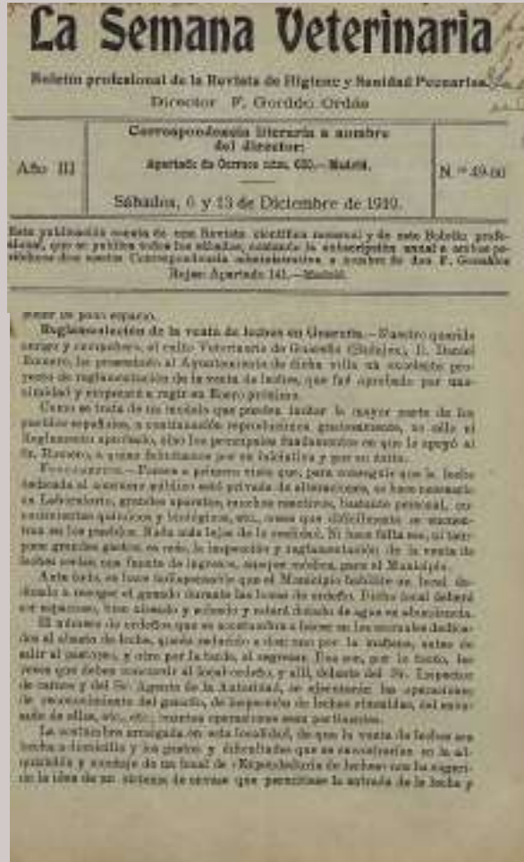
Figura nº 12. Reglamento de la venta de leche en Guareña. (La Semana Veterinaria nº 49-50, año III páginas 9,10 y 11)

La acción hay que entenderla a la luz de la normativa que por en-