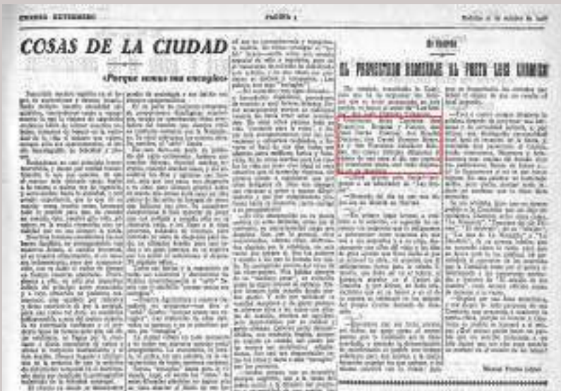
Figura nº 19. El Correo Extremeño 21-10-1930.