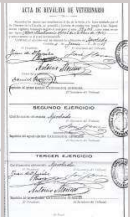
Figura nº 7. Acta de reválida del Veterinario.