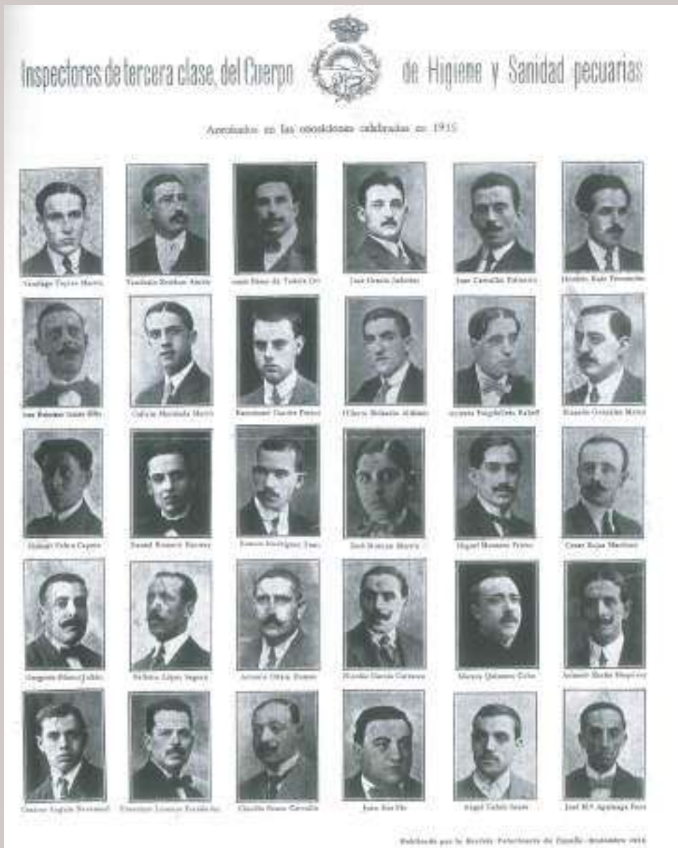
Figura nº 11. Orla de la II Promoción del Cuerpo de Inspectores de Higiene y Sanidad Pecuarias.

(firmado por el Subsecretario del Ministerio de Educación). Registro número 106 en dicho organismo y 647 en la Escuela de Veterinaria de Córdoba. (Figuras nº 9 y 10).