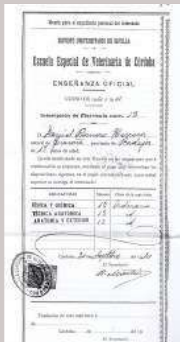
Figura nº 5. Inscripción de matrícula en la Escuela Especial de Veterinaria de Córdoba.