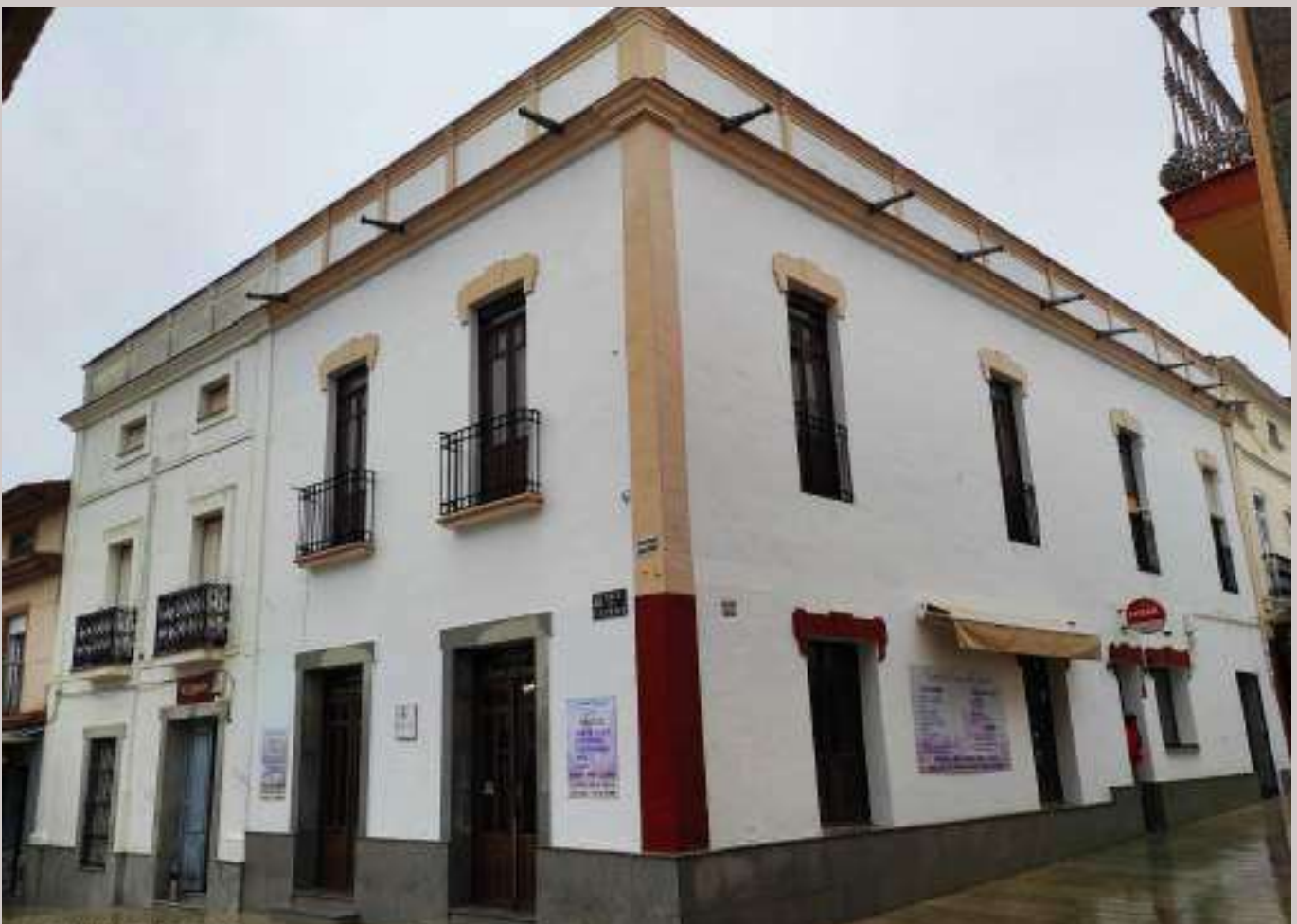
Figura nº 17. Fachada en la actualidad del Casino de Guareña.