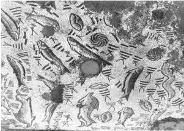
Mosaico da Cigarrosa

portante explotación vinculada á minería dende a Prehistoria, como mostran os numerosos xacementos coñecidos desta época (Meijide Pardo, 1985). Porén, a súa centralidade histórica e política chegou tras a conquista do territorio polo Imperio Romano, que implantou un complexo sistema de explotación e comercio de mineral, sobre todo o ouro, ligado a minas como as Médulas (Carucedo, O Bierzo) ou Montefurado (Quiroga, O Courel). Unha explotación masiva -sobre todo nos niveis coñecidos para a época- que implicou unha forte reorganización do sistema do poboamento de toda a bisbarra así como a construción da vía XVIII o Via Nova , que atravesaría toda esta zona (Ferrer Sierra, 2014; Sánchez-Palencia Ramos, 2000). Froito desta centralidade na economía imperial foi a emerxencia dunha potente elite territorial sobre a antiga poboación asociada coa etnia dos “gigurros”, como mostra a coñecida lápida sepulcral de Lucio Pompeio Reburro 2 (Rodríguez Colmenero