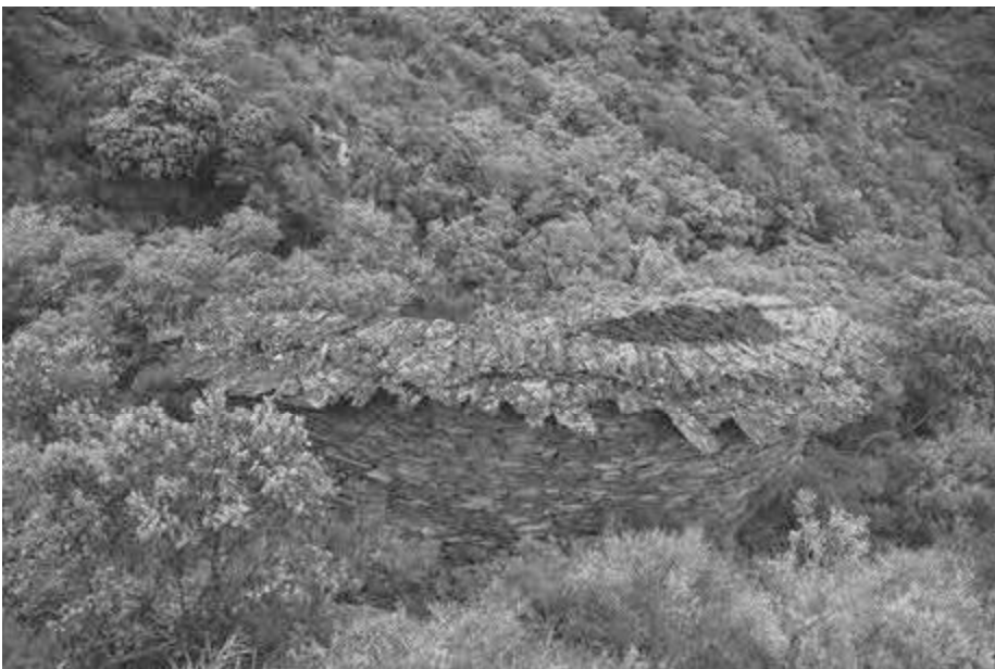
Alvariza do sitio de Ana de Vacas (Casaio)

“sector produtivo” porque o material máis destacado atopado nesta estrutura é unha cantidade moi significativa de mineral e de escouras, restos de actividades de produción de metal. As análises que polo de momento puidemos facer indican que, sexa nesta estrutura, sexa na contorna inmediata, tiveron lugar actividades de forxa, posiblemente de ferro. A datación radiocarbónica feita indica que esta estancia foi ocupada contemporaneamente ao outro edificio coñecido.