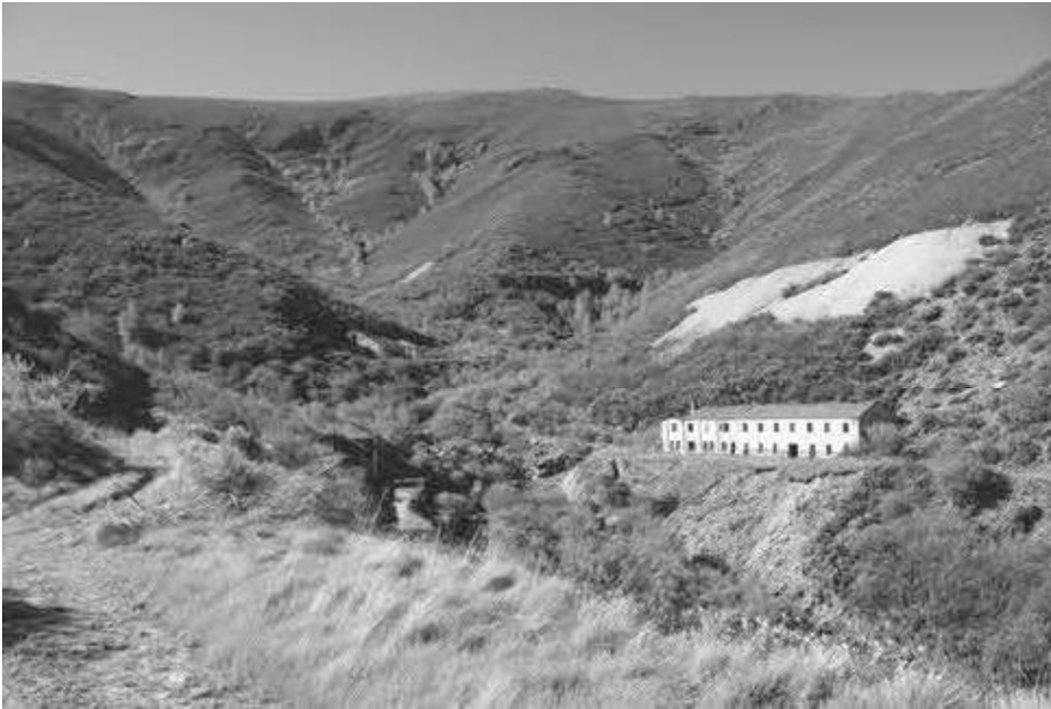
Mina de Volframio de Valborraz

ga duración histórica. A extensión de montes veciñais de man común de Casaio e Lardeira estímase para finais do século XIX de, polo menos, 8.104 hectáreas. Tras un longo proceso administrativo cunha forte resistencia por parte da comunidade local (Freire Cedeira et al. , 2014), actualmente son xestionados pola Comunidade de Montes de Casaio e Lardeira e protexidos a través da súa incorporación en 2008 á Red Natura 2000 como Zona de Especial Protección dos Valores Naturais. O noso proxecto ten o obxectivo de analizar arqueoloxicamente a emerxencia e as mudanzas na xestión deste tipo de espazos. Para iso, fixéronse varias campañas de prospección para documentar estes espazos e as distintas estruturas, tanto físicas como ecolóxicas, que permitan rastrear os distintos usos que tiveron ao longo do tempo.