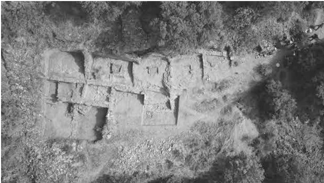
Espazo doméstico de Valencia do Sil

do Imperio Romano aínda eran pouco coñecidos na comarca. De entre todos, un dos xacementos que nos pareceu máis interesante foi o de Valencia do Sil, coñecido dende finais do século XIX e escavado durante os anos 60 e 70 polo grupo dos Escarbadores (Fernández Pereiro et al., 2017).