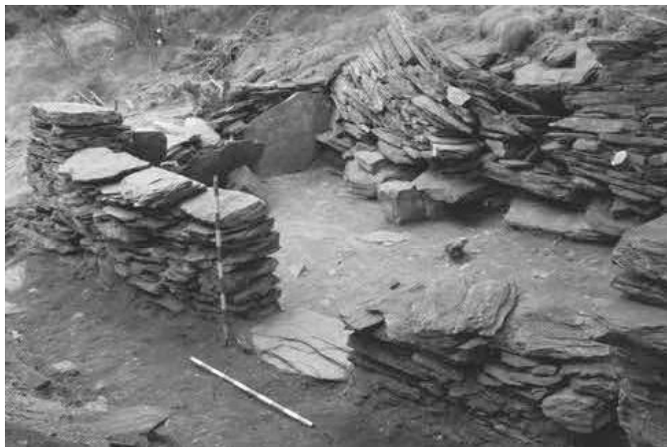
Chozo da guerrilla da Ciudad de la Selva