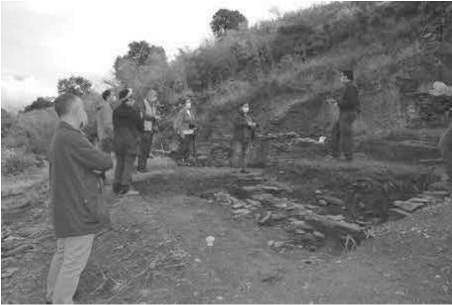
Visita guiada ao xacemento de Valencia do Sil durante a campaña de 2020