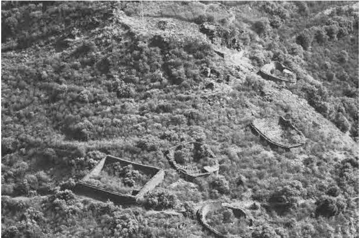
Alvarizas do sitio de Sobredo

As escavacións no Castelo de Valencia do Sil proporcionaron moita información que actualmente estamos a procesar e que permitirán iluminar este período escuro que é o momento final do Imperio Romano e os primeiros momentos da Idade Media. Ademais, as escavacións revalorizan un xacemento moi especial que, esperamos, sexan unha punta de lanza para a promoción do patrimonio cultural de Valdeorras.