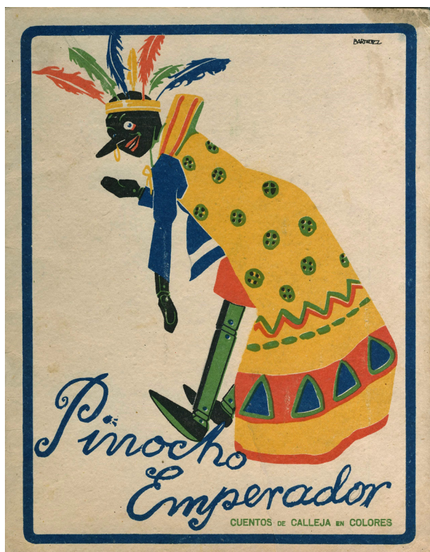
Fig. 2. Salvador Bartolozzi. Pinocho Emperador, vol. 1, Cuentos de Calleja en colores.

Madrid fue la ciudad de mi formación más especializada y donde adquirí buenos amigos con afi-