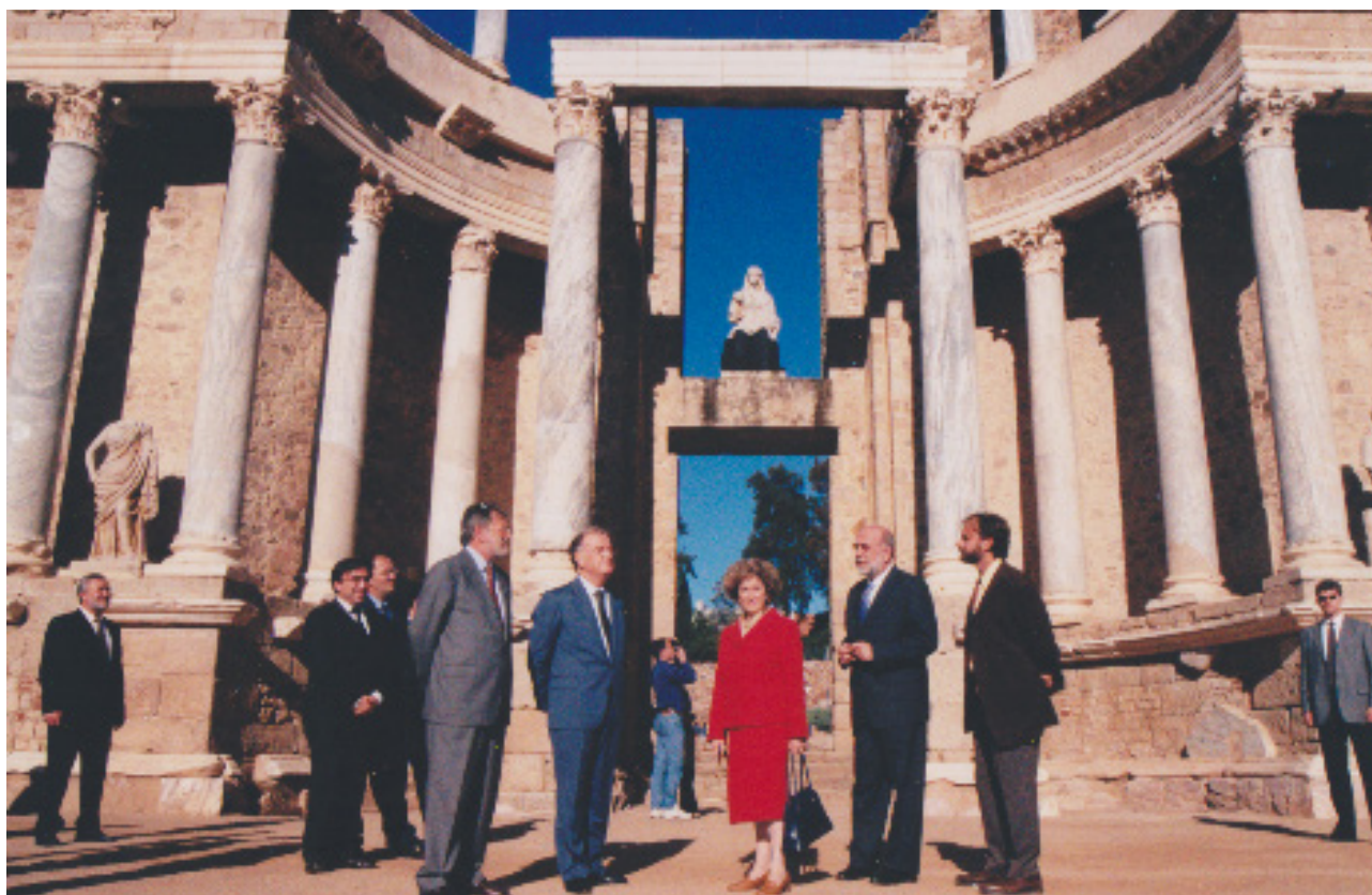
Fig. 5. Visita del Presidente de la República Portuguesa Jorge Sampaio a Mérida, 2002.

MMLB: En efecto, la dirección del Consorcio de la Ciudad Monumental de Mérida fue para mí un reto importantísimo y un aprendizaje práctico sobre la gestión del Patrimonio inigualable. Una experiencia directa sobre la conservación, restauración, revalorización y difusión del patrimonio en un conjunto arqueológico y monumental Patrimonio de la Humanidad. Enfoqué el trabajo, con todo el equipo que configuraba esta institución, partiendo siempre de la investigación, con el desarrollo de proyectos I+D+i, celebración de congresos, seminarios y cursos, para dar lugar a un propósito de mantenimiento, aumento del patrimonio y acción social, basados en el conocimiento e integrador en relación a la ciudad actual. Un proyecto diacrónico consensuado con todos los agentes implicados en el desarrollo de la ciudad, desde la Consejería de Cultura, al Ministerio, el Ayuntamiento y otras instituciones como el Colegio