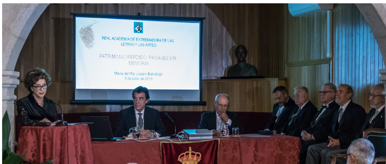
Fig. 9. Discurso de toma de posesión como Académica de la RAEX. 2019.