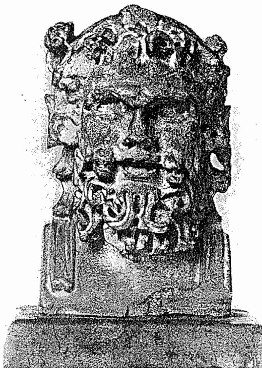
Lámina 3. Busto báquico de Porcuna (Jaén).

presentan las mismas características: técnica semejante, mismo tamaño, calidad igual en la factura y mismo material -mármol de Cabra- 25 observamos cierto parecido en los n.ºs. de inventario 3.978 (banda central, izquierda, lám. 2), 22 (misma