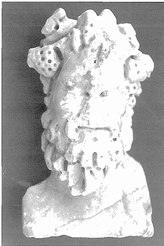
Lámina 1. Busto báquico de Fuente-Tójar (Museo Histórico Municipal de Fuente-Tójar, Córdoba).

Teniendo como materia prima un bloque de mármol rosáceo vetado, presumiblemente italiano, se esculpió el fauno que hoy presentamos. Se trata de un relieve realizado con trépano, lo que le da a la escultura un singular barroquismo, debido a los juegos de sombras y luces (Lám. 1). Medidas: altura, 17 cm.; ancho del torso, 9'9 cm.; grueso