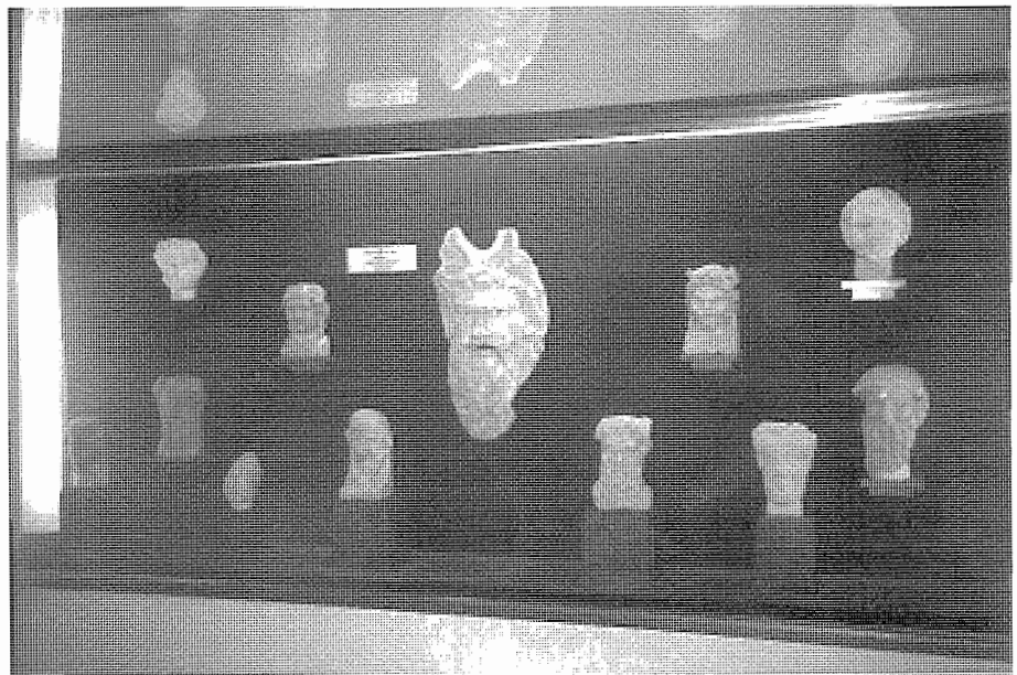
Lámina 2. Bustos báquicos (Sala V, vitrina nº I, M.A.P. de Córdoba).

del s. II de C. a partir del Hadriano, datación que proponemos. De entre todos los faunos y sátiros que conocemos 22 , y muy directamente los conservados en el M.A.P. de Córdoba, lám. 2 23 el mayor símil sólo lo hemos encontrado en el tristemente desaparecido Diónisio barbudo de Pozuelo (Porcuna Jaén), lám. 3 24 ; no obstante, en los cordobeses (probablemente obras de un mismo taller ubicado en Córdoba, ya que