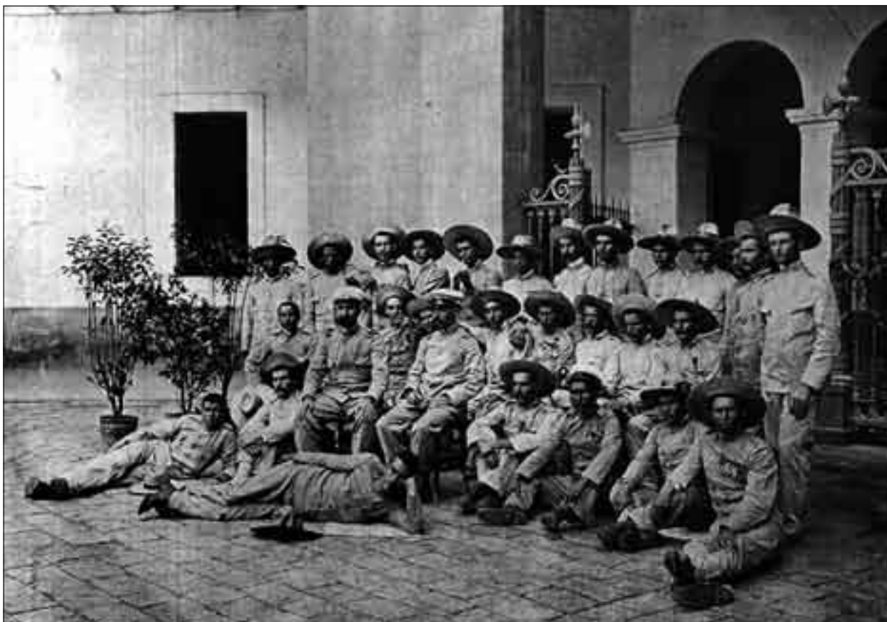
Figura 7. Fotografía tomada en la Capitanía General de Barcelona.

comprobar, puesto que a ninguno se le concedió la máxima condecoración posible como es la Laureada de San Fernando, a pesar de que se consideró en un primer momento tal probabilidad que fue inclusive anunciada en la prensa por esos días 56 .