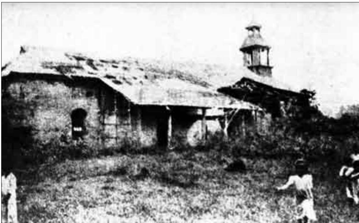
Figura 3. Lado oeste de la iglesia de Baler tras el asedio.