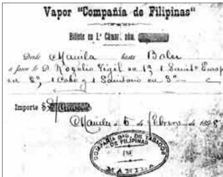
Figura 2. Pasaje del vapor Compañía de Filipinas (Fuente: X. Brisset).

blos granadinos 6 , en tanto otros defienden que lo hizo para continuar la tradición familiar 7 . Sea como fuere, por Real Orden del 1 de octubre