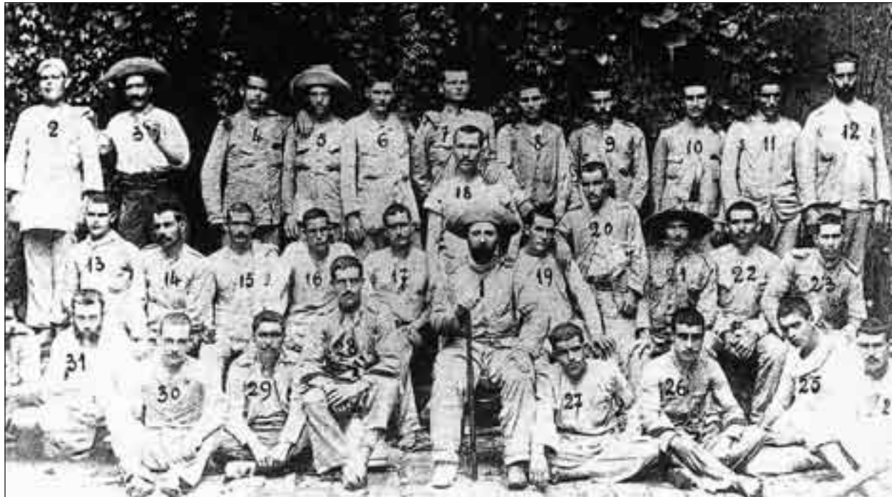
Figura 4. Supervivientes, salvo Vigil, en Manila.