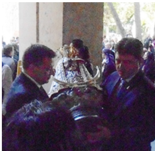
Alcalde y concejal recogen la imagen del trono

Llegado el desfile mariano al Ayuntamiento, el alcalde y el concejal de festejos se hacen cargo de la imagen y la suben al balcón principal para mostrarla por última vez al público acompañada por el alcalde y el obispo, como símbolo icónico de la ciudad que queda albergado todo el año en el edificio municipal.