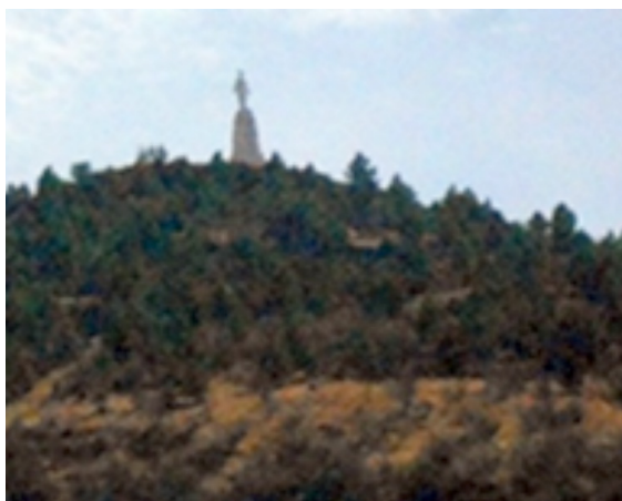
Imagen del Sagrado Corazón de Alcaraz

En el caso de la Virgen de los Llanos interviene también el componente geopolítico, apreciable en la delimitación que describe una crónica de 1730, informando que en la jurisdicción de la ciudad de Chinchilla "se celebra y venera a una Santísima Imagen de Nuestra Señora de las Nieves,... que está colocada en la ermita de San Pedro Apóstol en los Llanos de Albacete, dividiendo dicha ermita una y otra jurisdicción, y cerca también del convento de Nuestra Señora de los Llanos", que toma el nombre del paraje donde fue hallada, en la divisoria de Chinchilla y Albacete, originando controversias y querellas entre ambas".