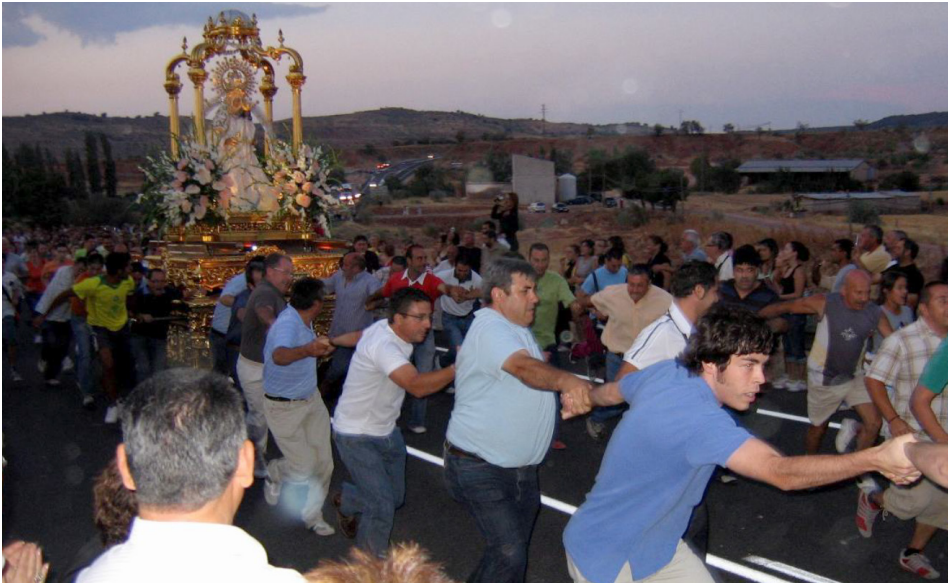
Primera carrera de la Virgen en su regreso a Alcaraz

se apareció, y de las tres carreras que efectúa la Virgen en el trayecto. La primera a mitad del camino cuando a lo lejos avista la ciudad y emprende la carrera para subir hasta la Pasarela; la segunda a la entrada en la calle Mayor donde la espera su hijo Crucificado, y la última tiene lugar desde el claustro de entrada hasta el altar mayor del templo parroquial, con las cuales la Virgen expresa de una manera muy gráfica su anhelo por encontrarse con sus fieles alcaraceños, y de llegar hasta su propia casa, donde va a convivir con sus hijos predilectos.