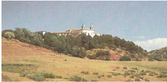
Santuario de la Virgen de Cortes

En estas circunstancias se encuadran los raptos sacros que los peñeros repiten anualmente como un acto alegórico de declaración local frente a la gente del Pozuelo y de Alcaraz, cuya competición protagonizan las imágenes sacras de la Virgen de Cortes y del Cristo del Sahúco, en un papel puramente político que asumen las imágenes como representantes de Alcaraz y de Las Peñas de San Pedro.