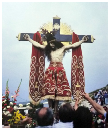
Imagen del Cristo del Sahúco

Efemérides que los peñeros recuerdan con amor propio todos los años para que no haya duda sobre la verdadera titularidad de la imagen del Cristo, a cuyo fin el lunes de pentecostés los jóvenes vestidos de blanco toman la imagen que el cura párroco les entrega a la salida del pueblo, y emprenden con ella una carrera durante la cual recorren el trayecto de 16 km. hasta llegar a su ermita de la aldea del Sahúco, donde permanece hasta el 28 de agosto en que retorna de nuevo al municipio y a la parroquia en la misma forma.