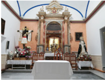
Santuario Cristo del Sahúco

y su núcleo de Peñas de San Pedro, que en el siglo XVI pide al emperador Carlos Quinto le eximiese de la jurisdicción de la ciudad de Alcaraz, llevándoles a levantar la ermita del Cristo del Sahúco frente al santuario de la Virgen de Cortes, que “se convierte en un indicador de límites entre dos entidades administrativas rivales” (Jordán y Lozano, 2012, p. 88).