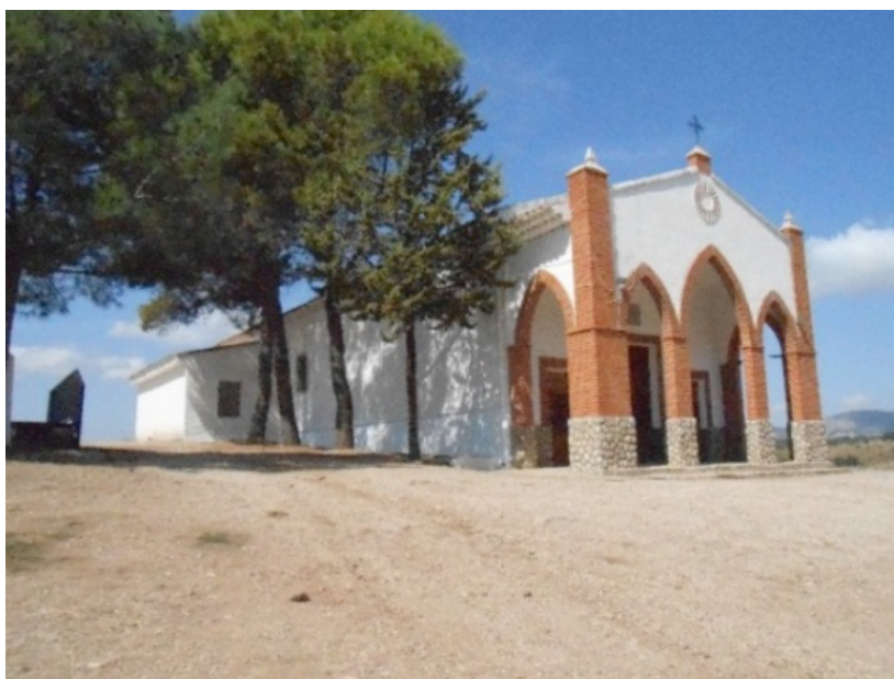
Ermita de Turruchel en Bienservida

En la casa de Paredes, significaba que el conde disponía de la facultad de designar y elegir a los empleados eclesiásticos a cambio de haber edificado el convento o iglesia y de dotarlos económicamente. Dotación que la otorgaba bien en metálico, mediante los denominados situados, es decir, determinadas cantidades de grano anual asignado, o mediante la concesión de diferentes tierras gratuitamente para que las pusieran en cultivo, o bien, en menor medida, mediante la entrega de censos consignativos. Entre estas instituciones se encontraban en la sierra de Alcaraz el patronato del convento de San Francisco en la villa de Villaverde, el nombramiento de capellanes para una capellanía en la iglesia de Villapalacios y también cierta intervención en el colegio de la compañía de Jesús en la ciudad de Alcaraz mediante el pago de un censo. (Losa Serrano, P, López Campillo, R. y Cózar Gutiérrez, R., 2014, p. 381).