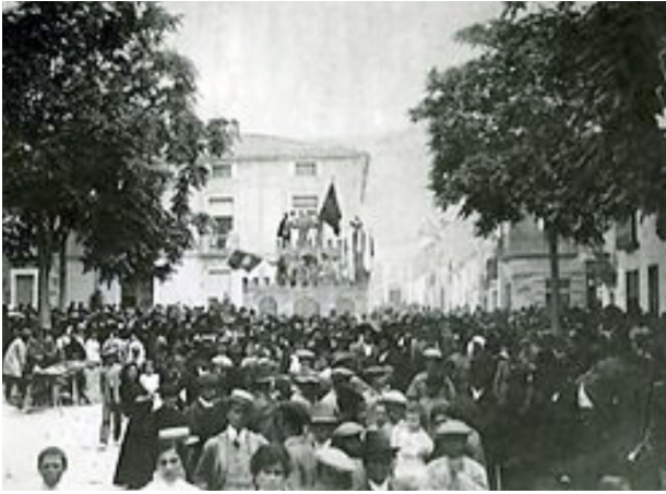
1920. Al fondo el castillo moro