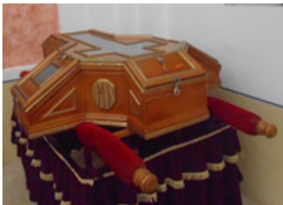
Arcón en que transportan el Cristo a la carrera

Un rapto simbólico que ejecutan los andarines dirigidos por el santero mayor, como un acto obligado de proclamación pública que recuerda el primer robo de la imagen, rehecho de manera espontánea por la fuerza y sin estar sujeto a la autoridad eclesial ni a la normativa de la Iglesia, y