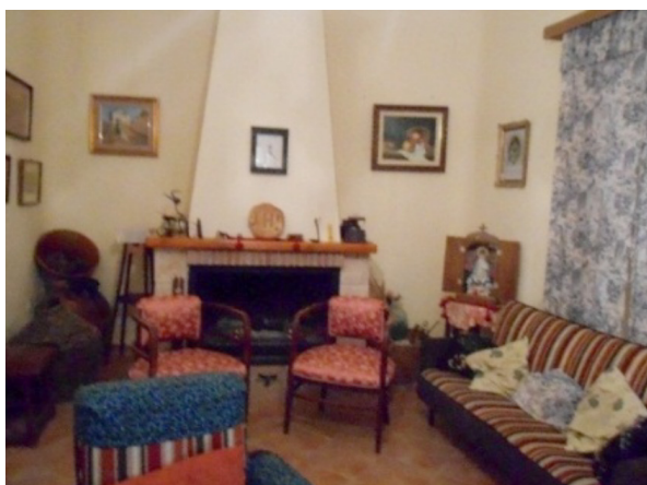
Virgen portátil en una casa