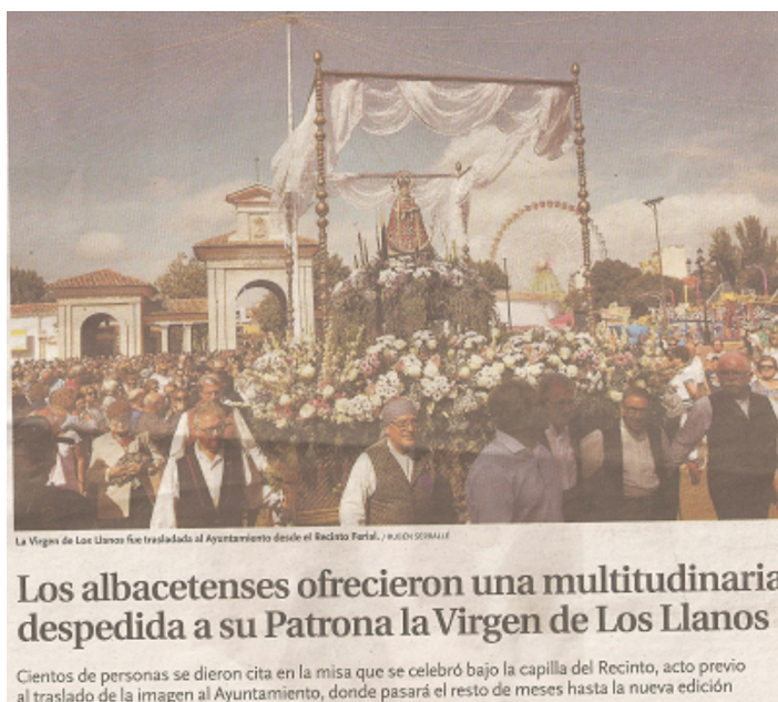
La imagen de la Virgen sale de la Feria

Evento ferial que goza de un gran poder de atracción para vecinos y visitantes, que conlleva la asistencia masiva de familias enteras procedentes de todos los pueblos que pasan el día disfrutando de los muchos alicientes que les esperan en la gran Feria, y de los aficionados que acuden a presenciar las escogidas corridas de toros que se celebran todas las tardes, comer en las innumerables casetas, adquirir útiles y provisiones y a participar en los numerosos bailes nocturnos del ferial.