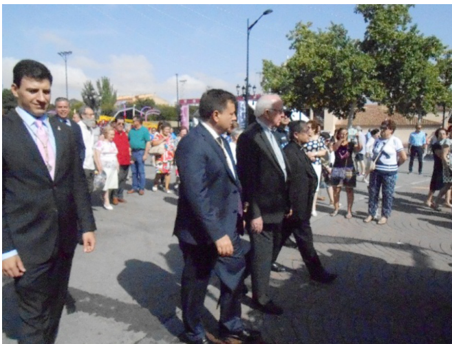
Alcalde y Obispo presiden el desfile de la Virgen de Los Llanos en el ferial

Desfiles procesionales cívico-religiosos que son presididos por el alcalde de la capital, acompañado discretamente por el obispo de la diócesis, quienes asisten al desfile vistiendo el traje civil o talar, en un cortejo ambiguo que conducen al unísono ambas autoridades sin adornarse con bandas, emblemas, insignias, bastones ni otros símbolos que distinga a ninguno de ellos, ni revestirse de atributos ni ornamentos litúrgicos algunos.