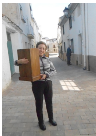
Mujer que turna la Virgen portátil

Uso o inmovilización de los símbolos sacros por los fieles cuya duración varía desde los más cortos que tienen por objeto entrar o sacar la imagen del templo o llevarla a hombros durante todo el itinerario de la procesión, hasta otros más prolongados, o incluso permanentes en el caso de la posesión de estampas, medallas, cuadros, capillas domiciliarias portátiles, figuras, estatuillas y otros recuerdos que luce el interesado, o coloca en su casa.