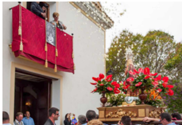
Casa engalanada para recibir a la Virgen