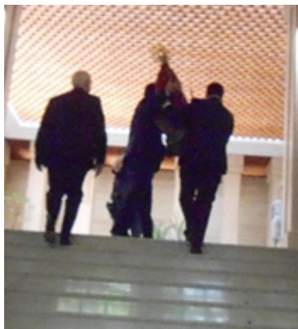
Ambos suben la imagen al Ayuntamiento

Exhibición de la imagen de la patrona en el balcón central del Ayuntamiento que pone fin al ponderado espectáculo cívico-religioso de la Feria.