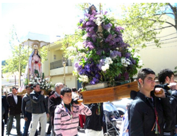
El Resucitado secuestrado por los quintos

permanece expuesto todo el año en el pórtico del templo. Teatralización del ritual alegórico de los quintos en que se participan los jóvenes de la localidad, y las figuras sacras del Resucitado, la Virgen y San Juan, que son portadas solamente por los jóvenes en desfile procesional, cuyo conjunto manifiesta ante todos los vecinos el cambio experimentado por los jóvenes quintos en su nueva condición que aprueban asimismo las imágenes sacras de localidad.