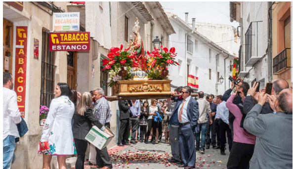
La Virgen mira la casa de los fieles

Visitas que la imagen efectúa durante las mañanas del sábado y del domingo, antes de regresar al templo parroquial, a cuyas puertas recibe de los fieles toda clase de ofrendas, que pueden consistir en flores, cuadros, objetos de artesanía o animales vivos, siendo frecuentes corderos, gallinas, conejos, u otros que luego se subastan. Oferentes que a la salida del templo completan su bienhechora acción obsequiando a los asistentes con rollos de pan bendito, que los favorecidos degustan en un ágape común en que confraternizan todos los vecinos, a semejanza de lo que hacían los primeros cristianos en las catacumbas romanas.