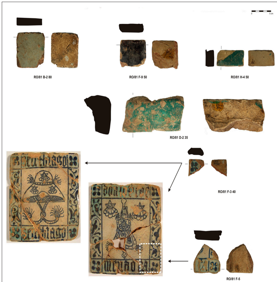
Figura 2. Fotografía de los fragmentos analizados. Los 2 azulejos completos utilizados como muestra completa están depositados en el Museo de Cáceres (tomado a partir de FRANCO, 2013).