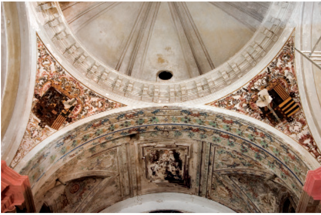
7. PECHINAS DE LA CÚPULA Y ARCO DEL PRESBITERIO. IGLESIA DEL CONVENTO DE NUESTRA SEÑORA DE LA ENCARNACIÓN.

totalidad de sus paramentos, siempre según las escasas imágenes que poseemos (fig. 4).