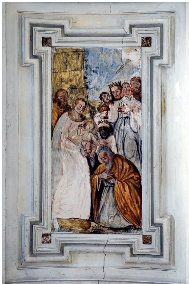
6. EPIFANÍA. IGLESIA DEL CONVENTO DE NUESTRA SEÑORA DE LA ENCARNACIÓN. (JRG).

la que descansaba un frontón triangular partido. Del centro de éste emergen sobre sendas ménsulas dos remates piramidales muy estilizados, que flanquean el ático a modo de remate rectangular, siendo curva la parte superior. El remate se estructura por dos pares de pilastras cajeadas terminadas en cabezas de querubines que sostienen una pequeña cornisa en cuyo centro se inscribe el anagrama de María. El interior del ático aloja una pintura donde se representaba, intuimos, la aparición de la Virgen de la Merced a san Pedro Nolasco.