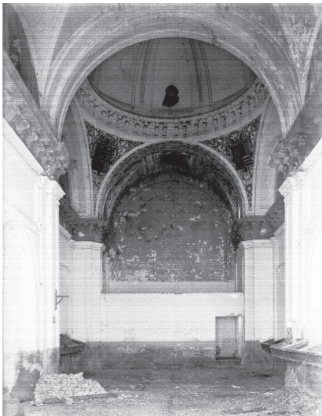
5. VISTA DEL INTERIOR HACIA EL PRESBITERIO. IGLESIA DEL CONVENTO DE NUESTRA SEÑORA DE LA ENCARNACIÓN. FOTOTECA DEL LABORATORIO DE ARTE, JOSÉ MARÍA GONZÁLEZ-NANDÍN Y PAÚL, 27 DE SEPTIEMBRE DE 1943. SIGNATURA: 3-10958.