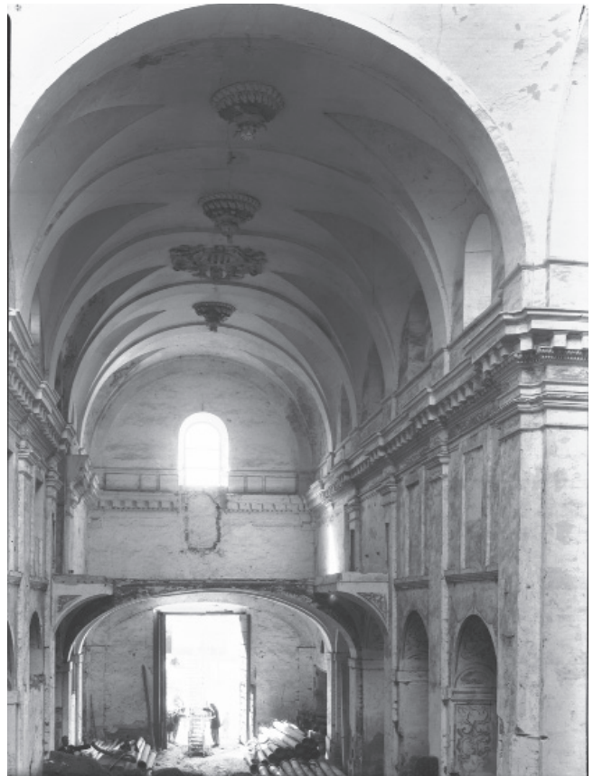
4. VISTA DEL INTERIOR HACIA EL CORO DE LA IGLESIA. IGLESIA DEL CONVENTO DE LA PURÍSIMA CONCEPCIÓN VULGO DE LAS GEMELAS. 6 DE MARZO DE 1943. SIGNATURA: 3-10962.

El Ayuntamiento adquirió por subasta la iglesia en 1942 al arzobispado hispalense, «con la única obligación de que, dado el valor artístico de su fachada y torres debía ser respetada, sea cual fuere el fin a que se destinara». Con posterioridad el Ayuntamiento cedió el inmueble al Ministerio de Educación y Ciencia para construir en él unas escuelas públicas 21 .