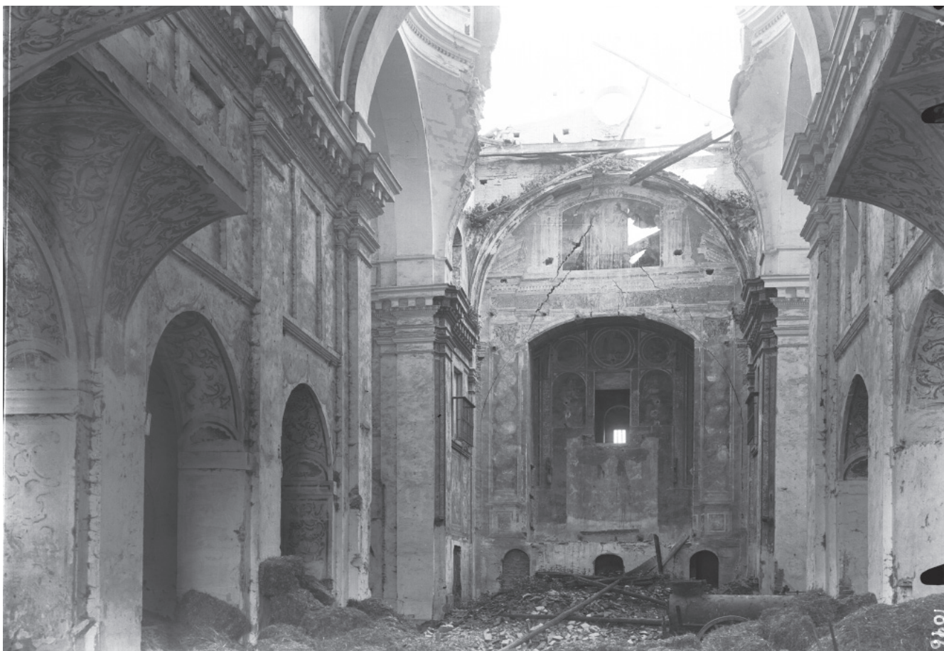
2. PRESBITERIO Y NAVE CON CAPILLAS. IGLESIA DEL CONVENTO DE LA PURÍSIMA CONCEPCIÓN VULGO DE LAS GEMELAS. 6 DE MARZO DE 1943. SIGNATURA: 3-10961.

Encarnación, titular del convento, flanqueado por dos santas de la orden 18 .