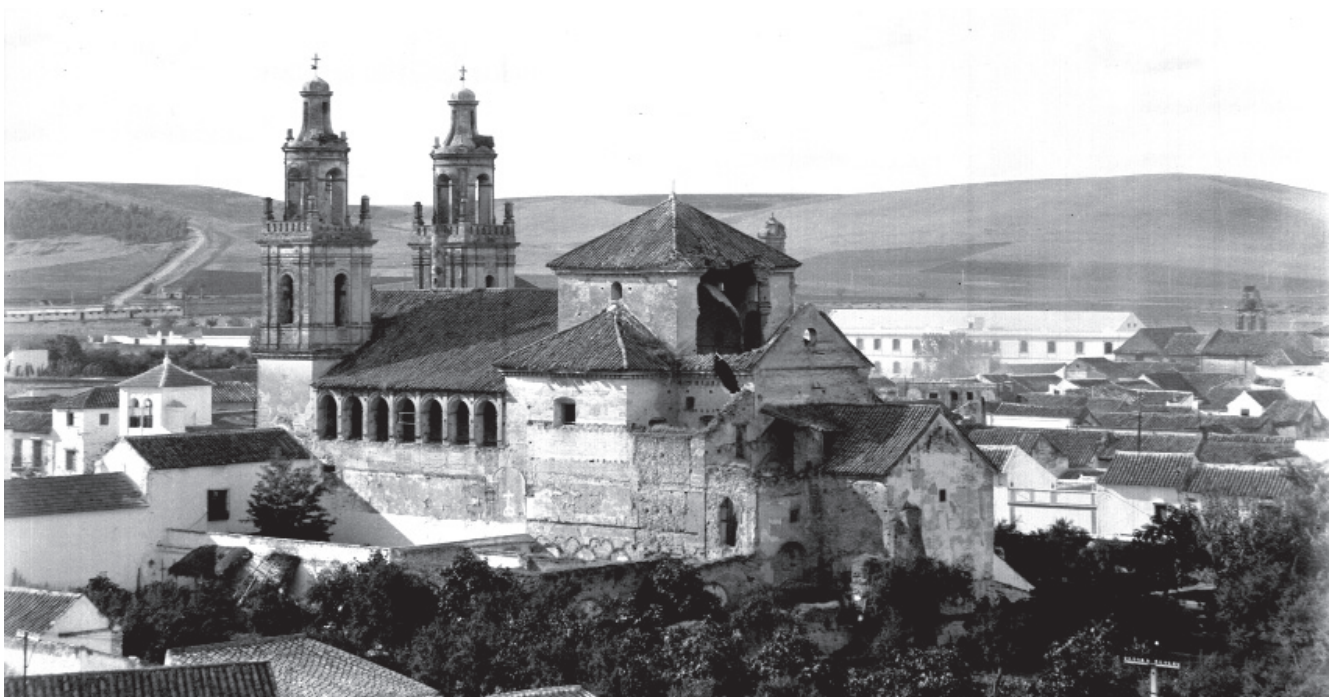
1. VISTA DE LA IGLESIA DEL CONVENTO LA PURÍSIMA CONCEPCIÓN, VULGO DE LAS GEMELAS, DESDE LA CABECERA, DONDE SE OBSERVA EL GRAN DETERIORO QUE SUFRÍAN ALGUNAS ESTRUCTURAS DEL EDIFICIO. FOTOTECA DEL LABORATORIO DE ARTE, JOSÉ MARÍA GONZÁLEZ-NANDÍN Y PAÚL, 27 DE SEPTIEMBRE DE 1943. SIGNATURA: 3-11034.

En cuanto a los retablos, contaba con un retablo mayor que hoy día se encuentra en el altar mayor en la parroquia Mayor de Santa Cruz en Jerusalén de esta localidad.