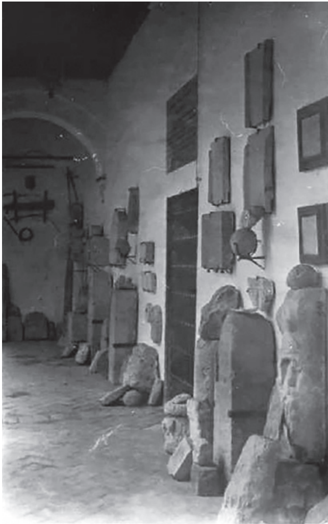
1. PATIO DE LA IGLESIA PARROQUIAL DE SANTA MARÍA DE LA ASUNCIÓN CON OBJETOS DE LA COLECCIÓN ARQUEOLÓGICA, FOTOGRAFÍA EN TORNO A 1950.