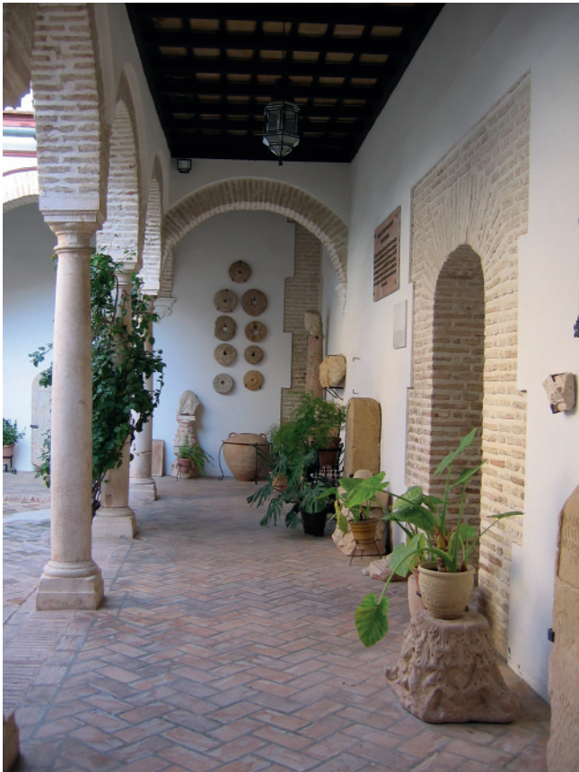
4. VISTA DE UNO DE LOS LATERALES DEL PATIO CON OBJETOS DE LA COLECCIÓN ARQUEOLÓGICA.