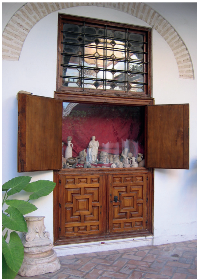
6. ALACENA DONDE SE EXPONEN OBJETOS DE MENOR TAMAÑO PERTENECIENTES A LA COLECCIÓN.

Ayuntamiento, que sería el germen para la creación del Museo Histórico Municipal de Écija 26 .