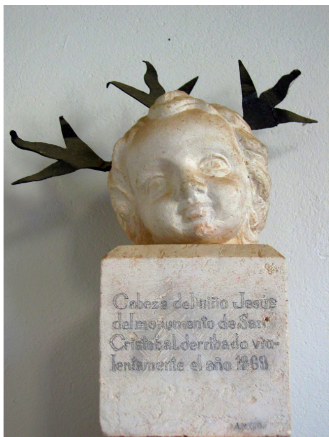
2. CABEZA DE NIÑO JESÚS DEL DESAPARECIDO TRIUNFO DE SAN CRISTÓBAL SITUADO EN LA PLAZUELA DE MESONES (ACTUAL PLAZA DE GILES Y RUBIO).

Se encuentra adosada en la pared con fuertes garras de hierro, en el ala derecha del patio, partiendo del archivo.