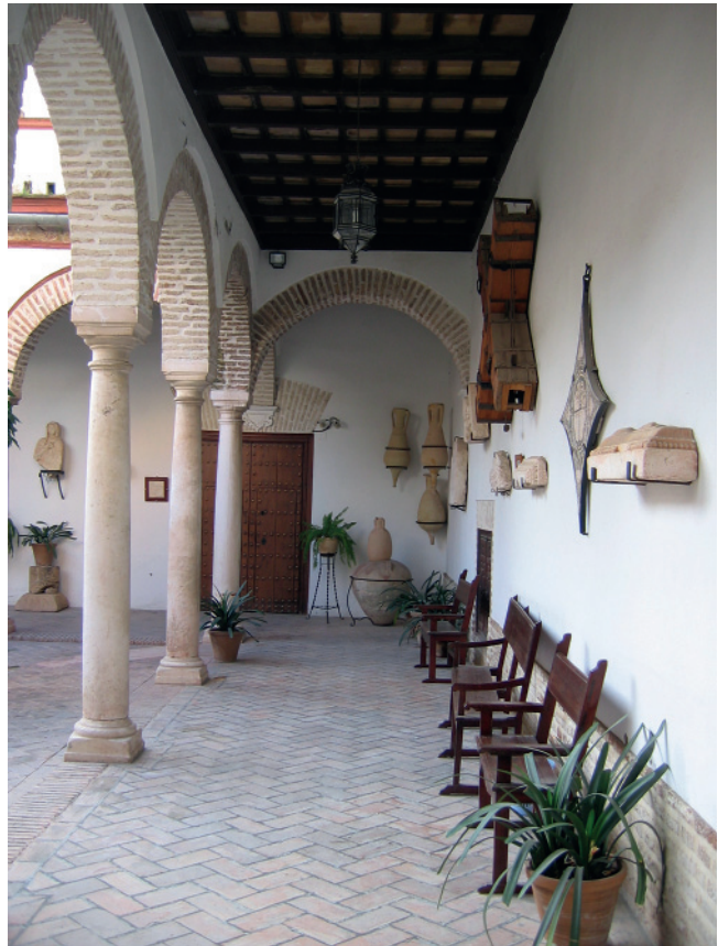
5. VISTA DE UNO DE LOS LATERALES DEL PATIO CON OBJETOS DE LA COLECCIÓN ARQUEOLÓGICA.

vidrio, candiles árabes y romanos, proyectiles de hon- das en plomo, cabezas de mármol; capiteles de distintas épocas, frisos y mosaicos romanos; mujer togada (medio cuerpo), columnas, piedras de moler grano, balas de cap- tultas, etc., etc. 21 (fig. 6)