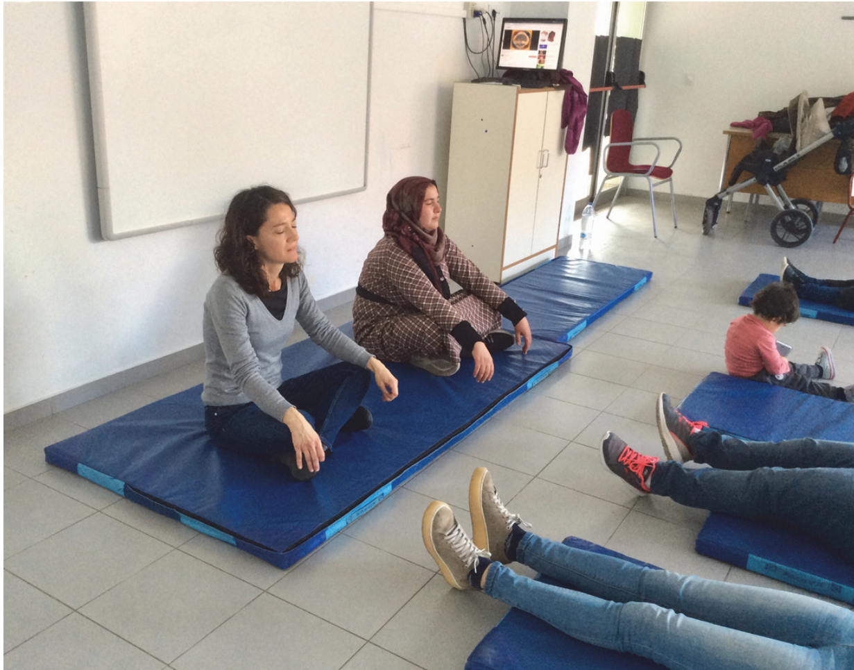
Imagen 7. Sesión de 8 de abril de 2019 - Relajación

Finalmente, respondiendo a la propuesta de algunas madres en encuentros anteriores, la última reunión ha estado dedicada a la actividad física. Esta sesión se organizó en colaboración con la “Oficina d’Atenció a les Persones Migrades” del Ayuntamiento de Vila-real (OAPMI). Una de las madres participante en sus talleres impartió una sesión de ejercicios y estiramientos, que finalizó con una relajación, en la que una de las madres magrebí actuó de traductora. Compartimos un momento “diferente” y gratificante para todas.