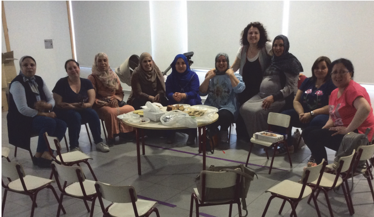
Imagen 2. Sesión de 26 de abril de 2018

Hablamos de la diversidad, incidiendo en la riqueza que supone la multiculturalidad de la clase y del colegio (con muchas familias de procedencia magrebí). Descubrimos que no todas utilizan la misma variante dialectal del árabe y que por ello, en ocasiones, han de hacer esfuerzos por entenderse entre ellas mismas. También se suscitó el interés por temas como los trámites para la obtención de la nacionalidad o la dificultad que para ellas supone el aprendizaje del castellano. El momento de la merienda fue una buena excusa para introducir el gran tema de la cocina.