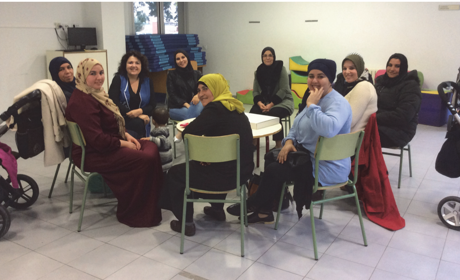
Imagen 4. Sesión de 5 de noviembre de 2018

Con la llegada del curso 2018/19, hemos continuado con el proyecto a través del tratamiento de nuevos temas como el de la lectura, coincidiendo con el inicio de la actividad de préstamo de cuentos durante el fin de semana. Pregunté a las madres sobre la costumbre o no de contar cuentos a sus hijos e hijas, incidiendo en la importancia de la lectura en el aprendizaje y el contacto con los libros desde la infancia. Este momento nos sirvió para dialogar sobre cómo se aprende a leer y a escribir, aprovechando para explicar el tipo de actividades que realizamos en el aula y de qué forma pueden las madres ayudar a favorecer este proceso.