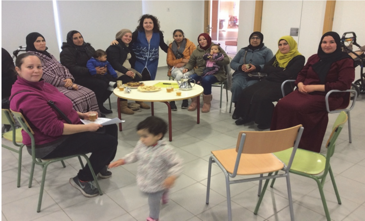
Imagen 5. Sesión de 28 de enero de 2019

También hemos abordado sus propias experiencias escolares. Y, así, hemos conocido a madres que apenas pudieron cursar sus estudios y también a licenciadas en sus países de origen. Algunas acuden a clases de castellano y quieren estudiar para no depender de otras personas en su vida cotidiana y, cómo no, para ayudar a sus hijos. Este es uno de los principales motivos que hace que decidan aprender.