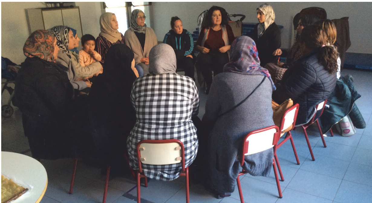
Figura 1: Comienzo y agrupamientos

Muchas de las madres, aunque apenas podían expresarse ni en castellano ni en valenciano, acudieron a la cita. Y, como en tantas ocasiones, las más aventajadas en el uso del idioma ayudaron a que nos pudiéramos entender.