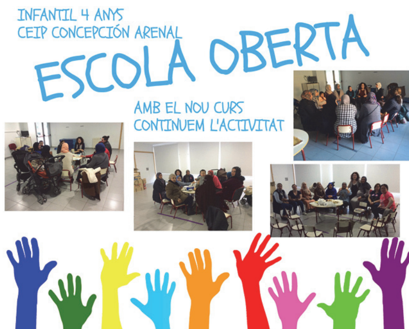
Imagen 3. Cartel Escola Oberta para el inicio del curso 2018/19