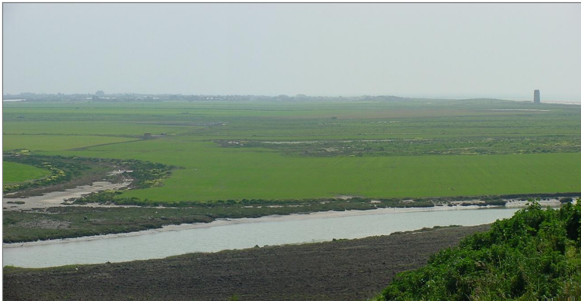
Figura 1. Vista desde Conil.

La percepción se efectúa en dos ejes fundamentales, NNW-SSE y SSW-NNE. En el primer eje destacan las vistas obtenidas desde el casco urbano de Conil, sobre los llanos de El Palmar con el área de actuación al fondo, su vista inversa sobre el casco de Conil, y las obtenidas desde la carretera de El Palmar circulando en ambos sentidos.