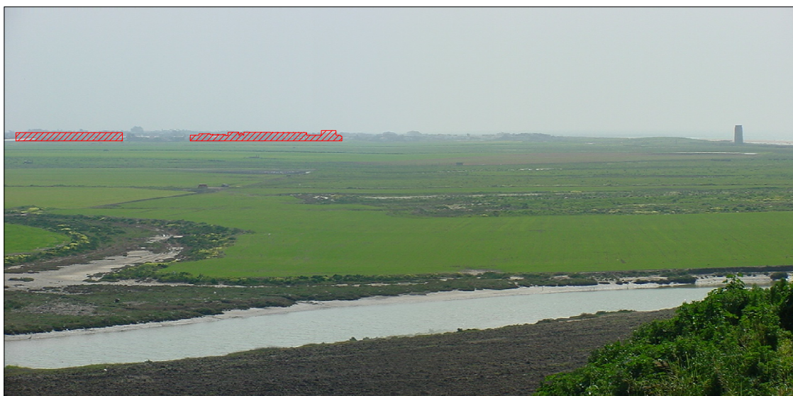
Figura 5. Simulación de la vista postoperacional desde Conil.

Fernández Enríquez, A., Arcila Garrido, M., García Sanabria, J. (2019): "Metodología de valoración de impacto visual. Aplicación en la playa de el Palmar de Vejer (Cádiz).", GeoFocus (Artículos) , nº 23, p. 141-162. ISSN: 1578-5157 http://dx.doi.org/10.21138/GF.624