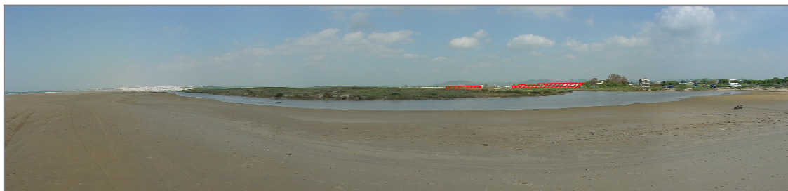
Figura 6. Simulación de la vista postoperacional desde la playa de Castilobo.

La calidad visual ha descendido de 78,9 % a 76,87 %. El asentamiento de El Palmar incrementa su impacto, pues su volumen se hace más macizo y complejo, su línea y color son más intensos, variables, complejos y contrastados, su gruesa textura es más densa y regular, tiene elevado contraste interno y el contraste de escala es mayor