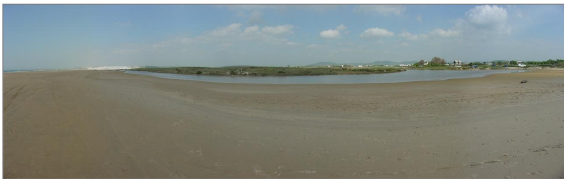
Figura 2. Vista desde la playa de Castilobo.