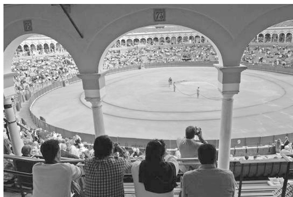
Fig. n.º 19 .- Plaza de toros de la Real Maestranza de Sevilla.

El Boletín se cierra con un corto pero intenso capítulo obra del filósofo y ensayista Santiago Navajas –autor del Hombre tecnológico y el síndrome Blade Runner en la era del biorobot (Berenice, 2016)– titulado “Crítica de la Razón Taurómaca”. Parte de la constatación de que las corridas de toros “son sangrientas, duras y violentas” pero que el proceso mismo de la lidia es capaz, la mayor parte de las veces, de ocultar estas dimensiones negativas y resolverlas en un final asumible e, incluso, bello,