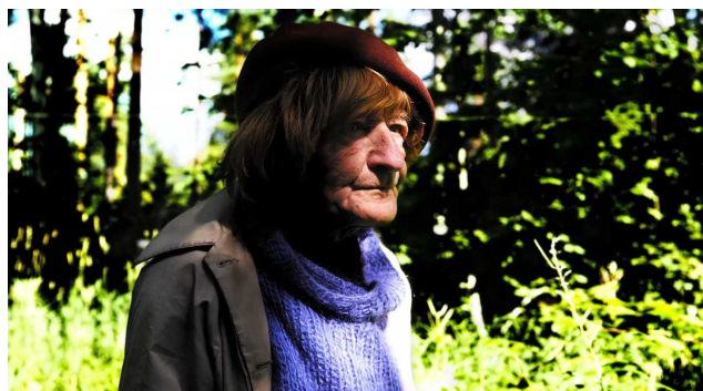
Fotograma de Oleg y las raras artes (2016), de Andrés Duque.

Para mí es como mirarme en un espejo. Noto que hay una afinidad con ese desconocido y, por supuesto, todo aquello que no sea normativo para mí es importante. Siento una especie de interés y, a la vez, responsabilidad de visibilizar estas cosas y mostrar toda la belleza que tienen oculta. Porque, si no, estaríamos viviendo en un mundo muy aburrido.