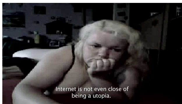
Fotograma de Color perro que huye (2010), de Andrés Duque.

Tras haber coincidido en distintos lugares, nos sentamos a conversar sobre su cine, sus idas y venidas identitarias y sobre su próxima película, nuevamente vinculada a Rusia.