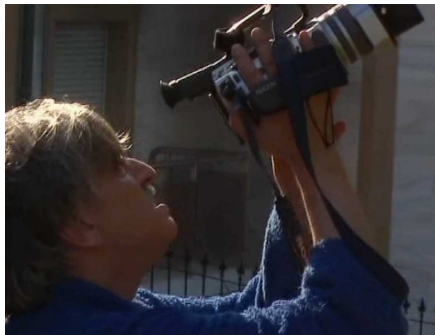
Fotograma de Iván Z (2004), de Andrés Duque.

Sí, trans total [risas]. El término trans me gusta, aunque suene un poco raro. Cada vez que lo anuncio suena un poco pretencioso y todos estos conceptos los son. Pero a mí me gusta justamente por lo que sugiere el término trans .