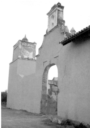
Fig. n.º 66.- Portada principal de la Villa de Saltillo (Carmona, Sevilla).

El libro del que damos cuenta, La ganadería Saltillo. Heurs et malheurs d'une grande race de "toros bravos" , ha sido escrito por Pierre Dupuy, doctor en Derecho y fundador de la Unión de Bibliófilos Taurinos de Francia, que tiene en su haber, entre otros libros de materia taurina, una monografía sobre otra de las grandes ganaderías, la conocida como los miuras portuguesas 2 : me refiero a Palha, alquimia de la bravura , obra que tuve ocasión de presentar hace un par de años en la Real Maestranza de Caballería de Sevilla.