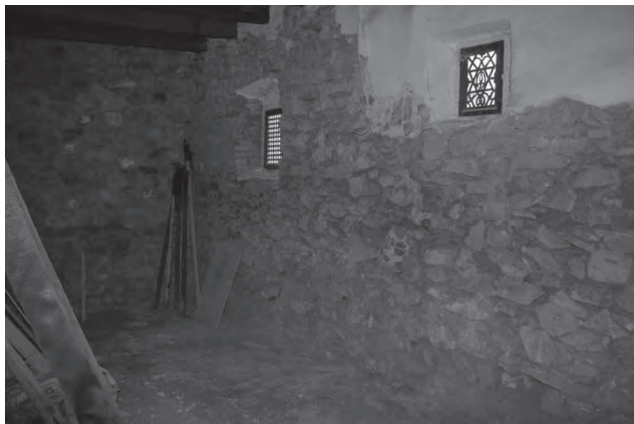
El estudio del estado de los muros resulta básico para planificar la rehabilitación de la Posada del Moro, sede del museo

La idea central de esta rehabilitación es la de conservar íntegramente