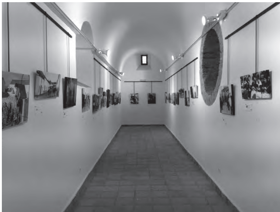
Exposición temporal "Los Pedroches en la retina", instalada en la sala de exposiciones del Pósito de Torrecampo

a. Ciclo de conferencias sobre Córdoba y El Gran Capitán.