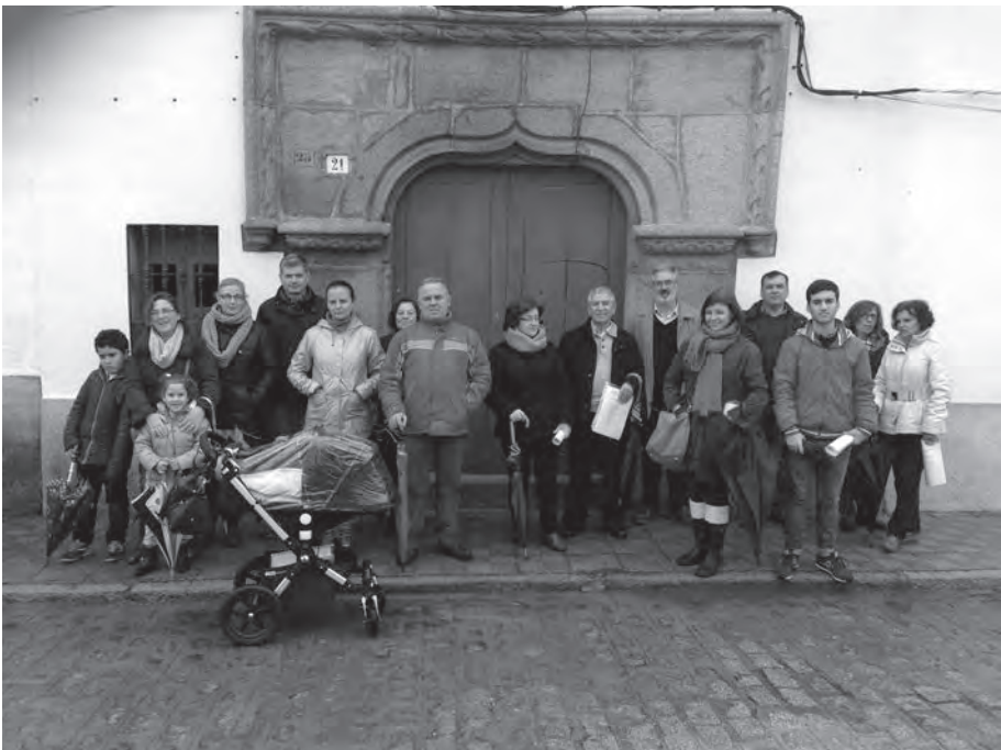
Grupo de voluntarios, durante la visita realizada el 21 de febrero dentro del proyecto de difusión del Patrimonio Histórico de Torrecampo

Durante el año 2014 había comenzado la preparación del proyecto de difusión del Patrimonio Histórico de Torrecampo puesto en marcha en co-