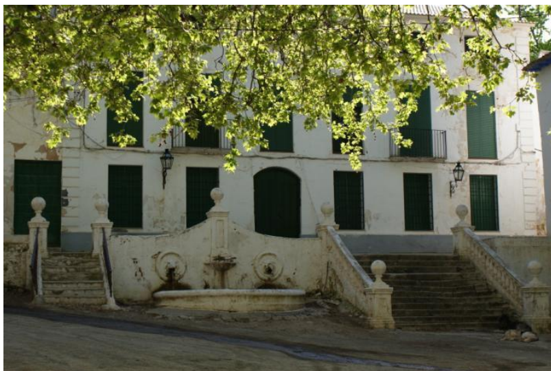
Casa de Mata Bejid

Más tarde pasaría a ser propiedad del famoso torero Ricardo Torres “Bombita”, siendo después parcelada y vendida entre los colonos que compraron la tierra de labor, mientras que el monte lo adquirió la Administración Pública.