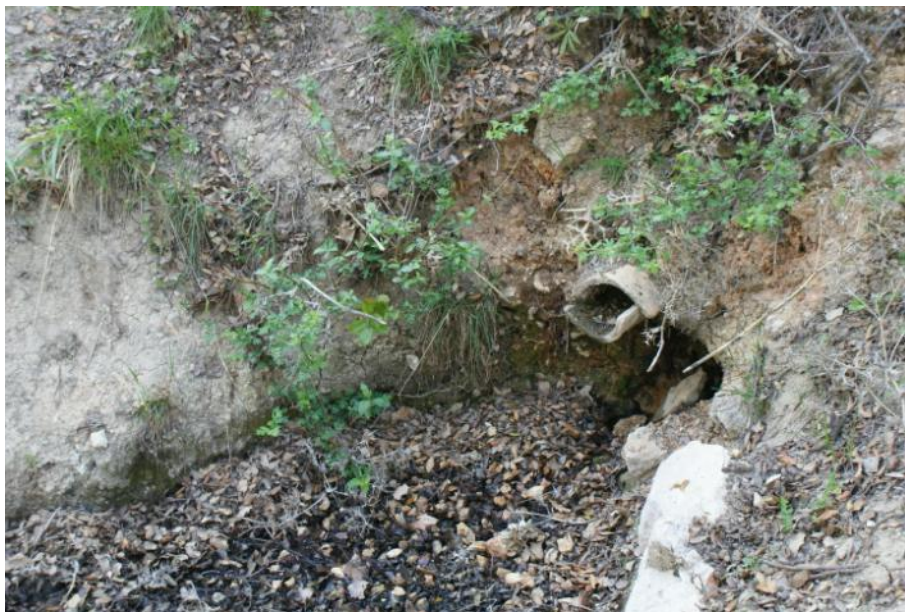
Fuente de la Teja

Siguiendo el GR-7, y justo en la curva anterior al antiguo Cortijo de los Prados, encontramos la Fuente de la Teja . El manantial está en un barranquillo frondoso orientado al norte, ofreciendo al caminante un lugar de descanso privilegiado a la sombra de las inmensas encinas.