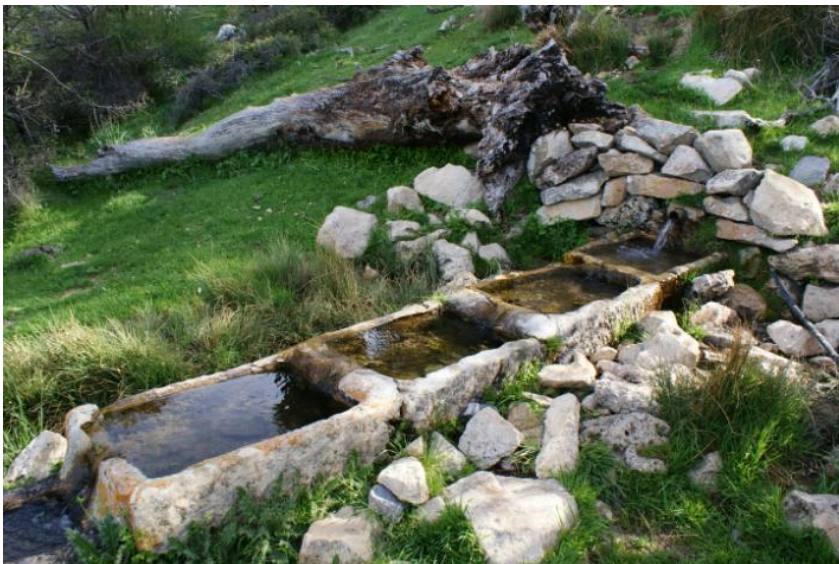
Fuente de las Pilas

Un poco antes de coronar el Collao de Fuente Fría y a la izquierda por una pequeña vereda en dirección a la solana del Cerro Ponce, accedemos a la que para mi gusto es la más bonita del recorrido, la Fuente de las Pilas con un abrevadero de pilas de piedra tallada en cantería.