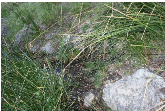
Fuente del Moral

A escasos cien metros de las ruinas del castillo y en dirección norte, nos encontramos con la Fuente del Moral . Debe su nombre al estar este nacimiento bajo uno de los únicos árboles de esta especie en esta sierra. Se trata de un nacimiento que no está acondicionado con pilas.