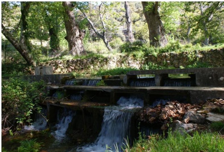
Nacimiento de la Mata

Frente a las casas señoriales el jardín de tipo versallesco, formando estructuras geométricas y laberínticas por medio de parterres de arrayanes y fuentes más sencillas.