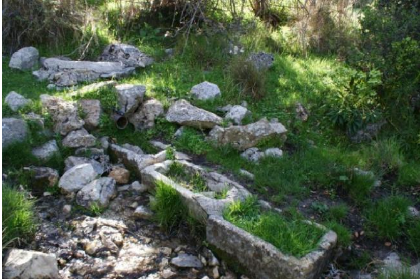
Fuente del Piojo

Un poco antes de coronar el Collao de Fuente Fría y a la izquierda por una pequeña vereda en dirección a la solana del Cerro Ponce, accedemos a la que para mi gusto es la más bonita del recorrido, la Fuente de las Pilas con un abrevadero de pilas de piedra tallada en cantería.