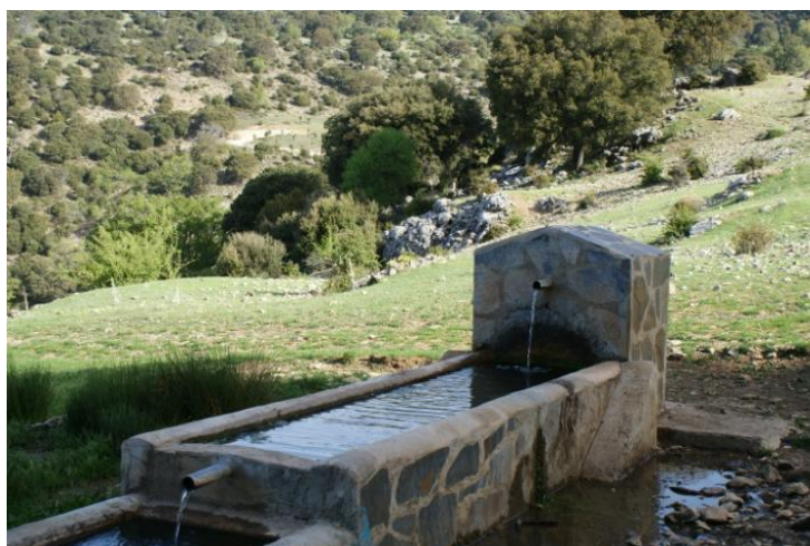
Fuente de las Palomas

Continuando por el GR-7 nos encontraremos con un camino que desciende en dirección del Llano de los Vaqueros y al Hoyo del Nevazo, el cual nos dejaremos a nuestra derecha, para seguir caminando y en una curva nos sale otro camino también a la derecha, por el cual nos desviamos y subimos una loma que va a los Cantos, llegando a la Fuente de las Palomas , un abrevadero de nueva construcción. Esta fuente es conocida popularmente como la “Fuente de las Putas”, y cuenta con unas vistas privilegiadas hacia el sur-oeste.