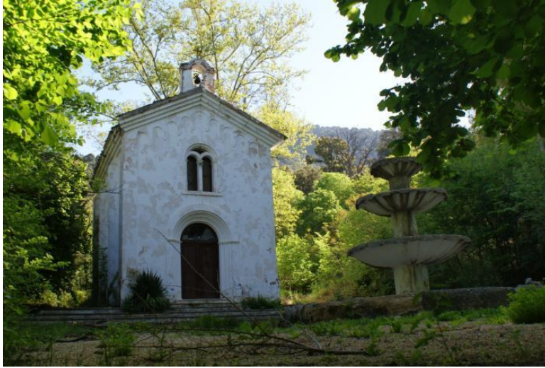
Capilla, jardines y fuente de Mata Bejid

Corre el agua por dos canales que rodean una gran fuente de tres tazas con surtidores a modo de ranas junto a la Capilla, forma después un torrente cascada que desemboca en un estanque artificial, que conserva en el centro la base de la que sería una escultura decorativa. Junto a él podemos contemplar el haya más meridional de Europa.