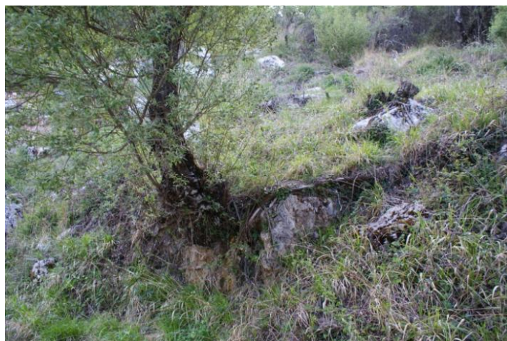
Fuente de la Albarrá del Castillejo

Nos encontraremos con nuestra segunda fuente, la de la Albarrá del Castillejo , en el paraje conocido como Las Conchas. Hasta aquí se puede llegar también por una vereda que parte del Nacimiento de la Mata, atravesando el monte bajo. En este paraje empezamos a ver muchos ejemplares de Cornicabras o Pistacia Terebinthus. Estamos a una altitud de mil cien metros en el llamado Piso Meso Mediterráneo.