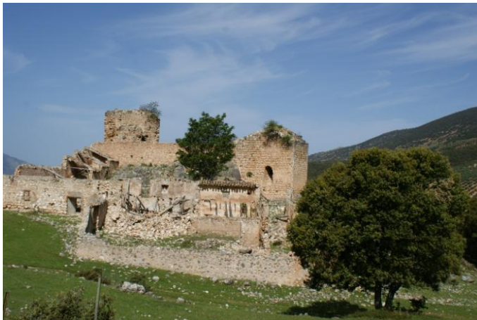
Castillo de Mata Bejid (el Castillejo)

Siguiendo el camino llegamos junto al Castillo de Mata-Bejid de origen musulmán, fue conquistado por D. Iñigo de Mendoza “Marqués de Santillana”. Esta fortaleza vigilaba el paso del Puerto de la Mata que atraviesa Sierra Mágina y conecta con el Valle del Guadalquivir.