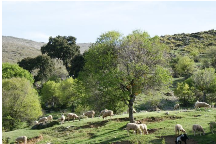
Arce de Montpellier

A mil quinientos metros de altitud estamos ya en el llamado Piso Supra-Mediterráneo, donde podremos observar las peonias, arces de montpellier, mostajos, cerezos de S. lucía y madre selvas. Un buen lugar para observar el águila perdicera y la cabra montés. Con las coordenadas: X 456.809 Y 4.175.230.