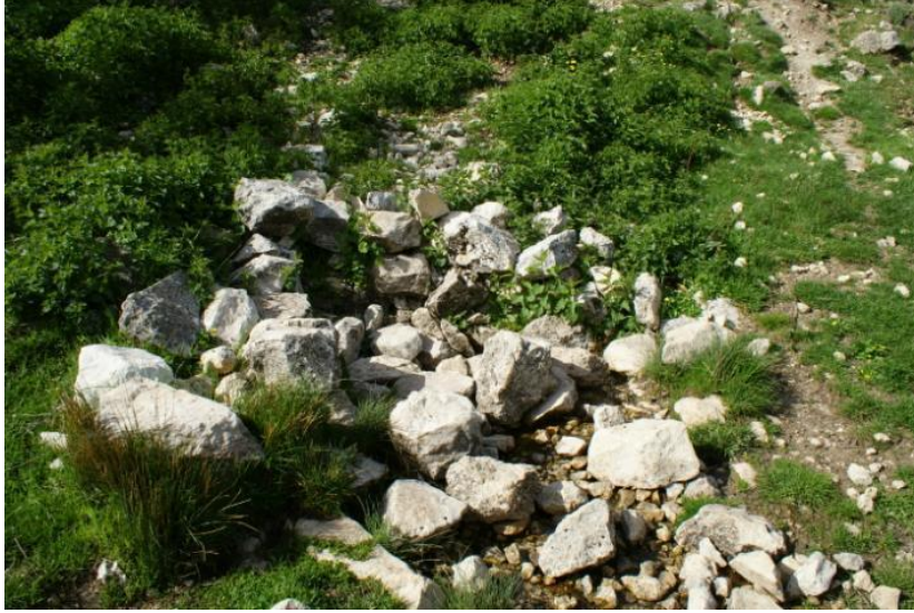
La Fuente Fría

Es este el final de nuestra ruta en la que hemos caminado alrededor de once km y salvado un desnivel de seiscientos cincuenta metros.