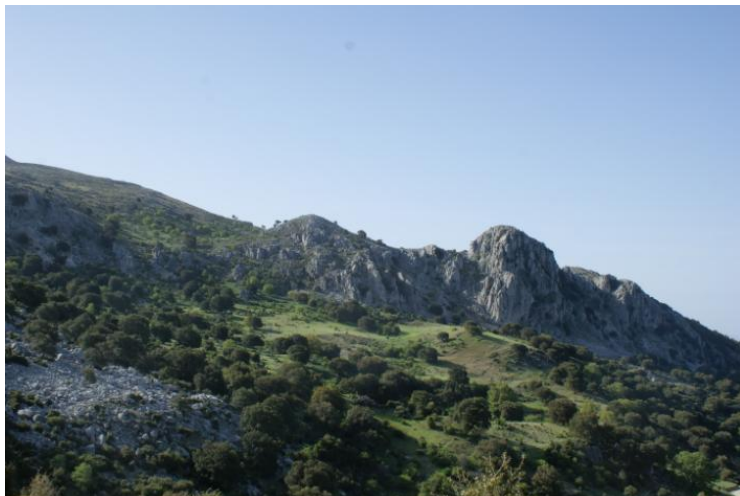
Cantos de la Escaleruela y del Contadero

Sobre esta fuente podemos ver los grandes cantos de la Escaleruela y a la derecha de esta, el Contadero que recibe el nombre por tratarse de un paso estrecho que se utilizaba para contar el ganado, al pasar de uno en uno. Hacia el oeste vemos el Barranco de la Pasaila y su nacimiento y detrás el arroyo de la Junta de los Puertos, que más abajo se unirá con el Arroyo de los Castillejos, ambos afluentes del Río Oviedo.