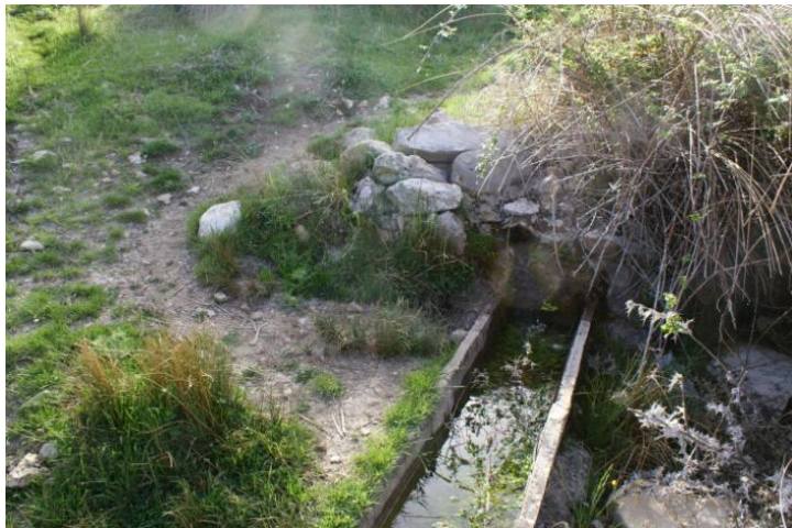
Fuente de los Prados

balsa de almacenamiento de agua a la izquierda. Este manantial cuenta con un pequeño abrevadero. Esta agua procede del rezume del Cerro Ponce y la Piedra de Jaén. Estamos a mil trescientos sesenta y cinco metros de altitud y sus coordenadas son: X456.256 Y4.175.230.