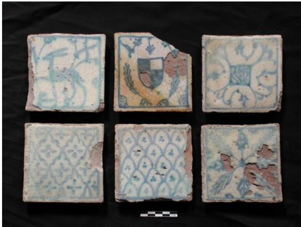
Fig. 4. Conjunto de azulejos procedentes de la iglesia de San Agustín en Génova (P. Ramagli, C. Capelli). Producción nazarí.