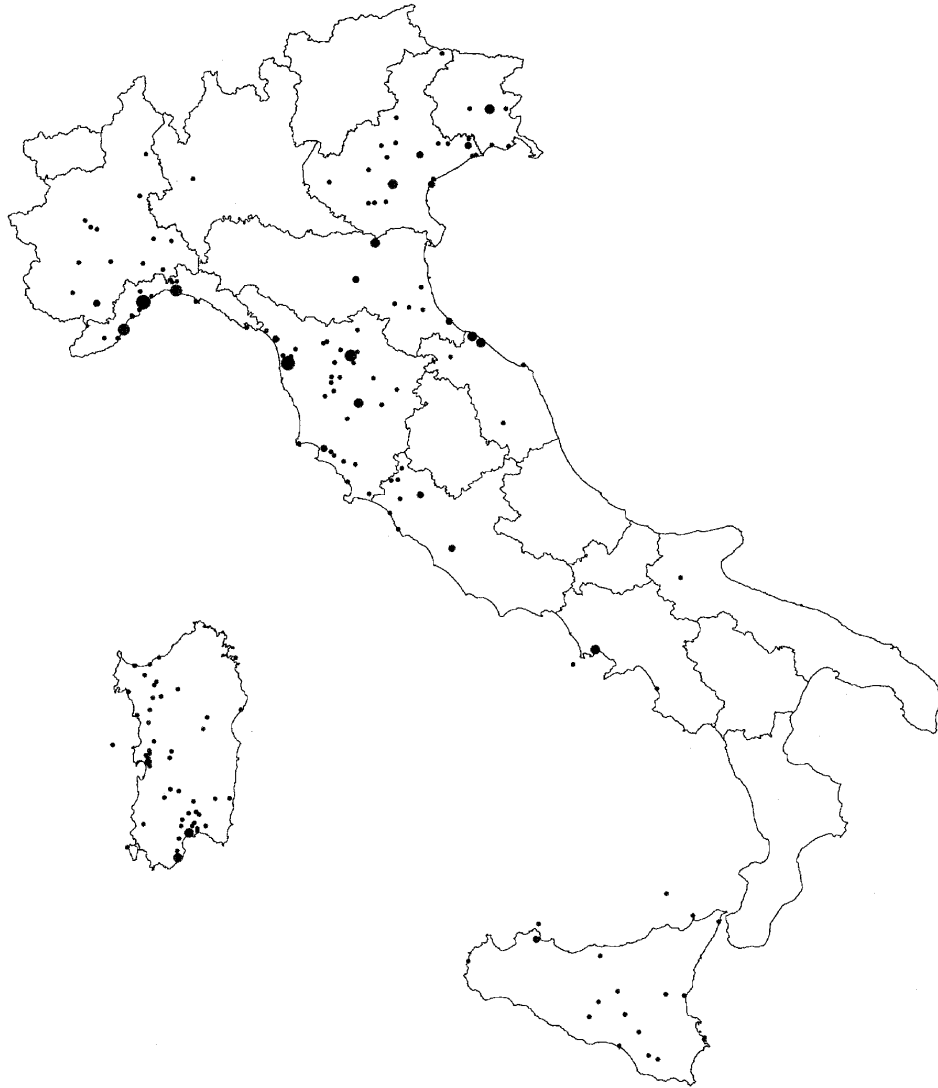
Fig. 7. Constataciones de cerámicas de procedencia ibérica en Italia durante la Edad Media (A. García Porras)