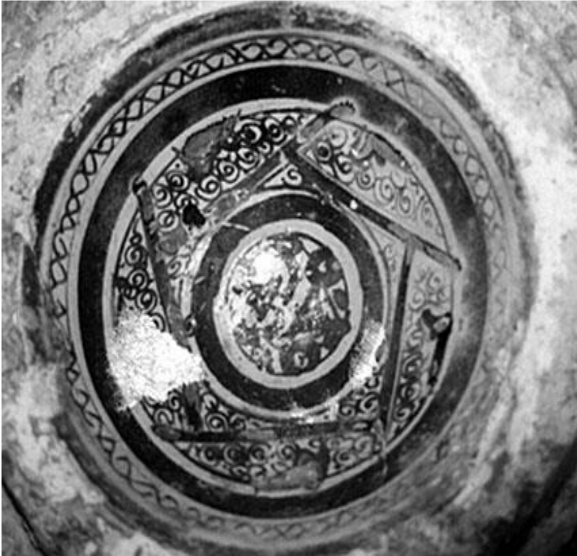
Fig. 5. Bacino de Santa Susana en Busachi (Oristano-Cerdeña). Producción valenciana, grupo “Malagueño primitivo”.