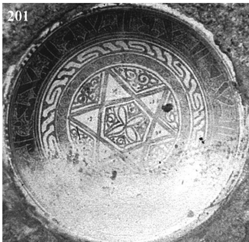
Fig. 3. Bacino de San Andrés (Pisa). Producción andalusí, grupo “Loza dorada”.