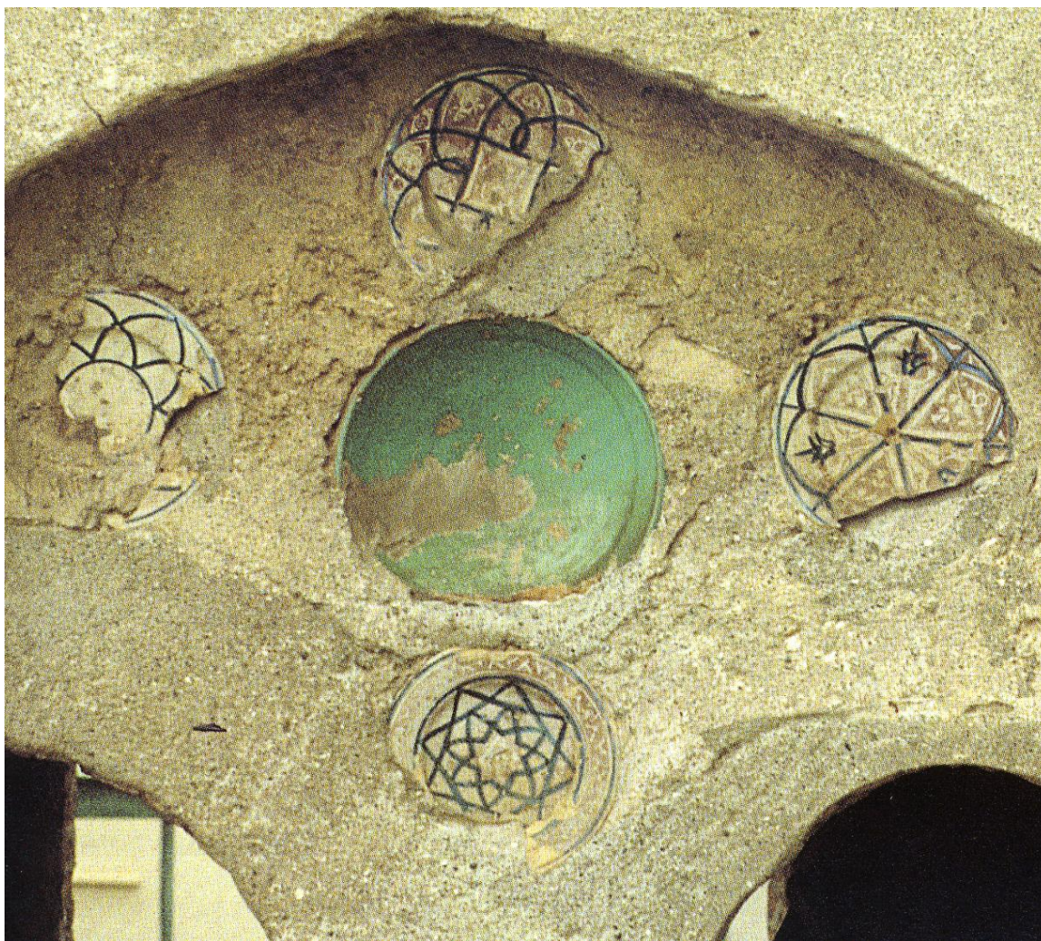
Fig. 6. Conjunto de bacini de la iglesia de San Ambrosio en Alassio (Savona) (F. Benente, A. Gardini)