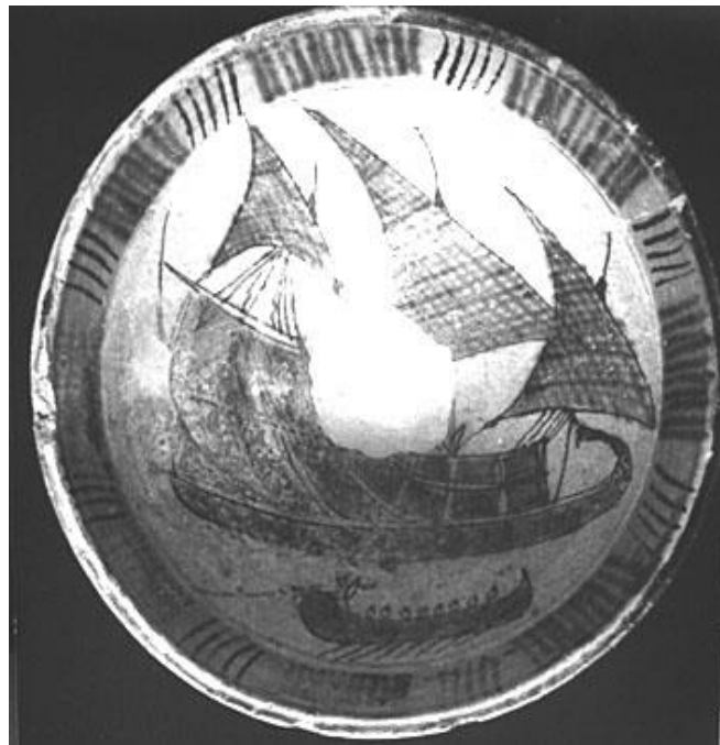
Fig. 1. Bacinio de San Piero a Grado (Pisa). Producción andalusí, grupo “verde y manganeso” (G. Berti).