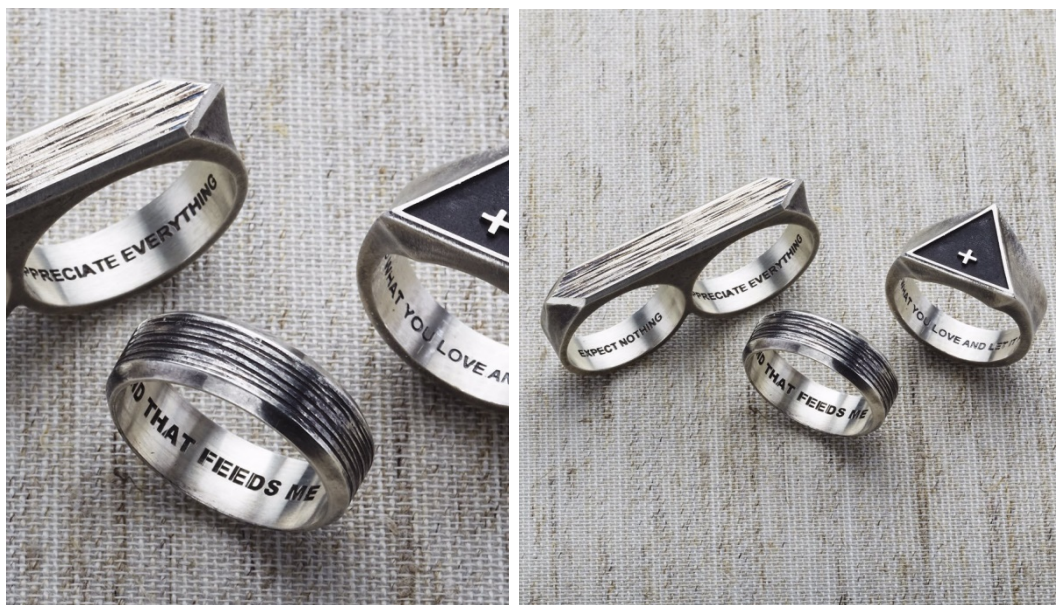
Figuras 14 y 15. Imágenes de la Campaña de I love Ugly sin modelos