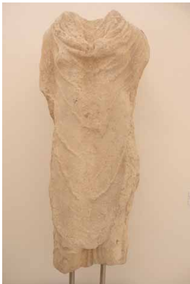
ESCUPTURA FEMENINA DEL ARCO DE LOS GIGANTES, CONSERVADA EN EL MUSEO MUNICIPAL DE ANTEQUERA