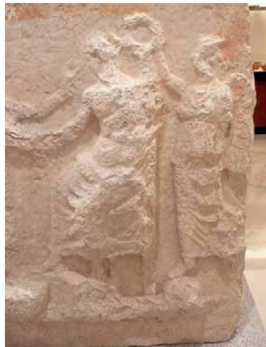
DETALLE DE UNO DE LOS LATERALES DEL ARA, REPRESENTANDO AL EMPERADOR SENTADO, CORONADO POR UNA VICTORIA ALADA