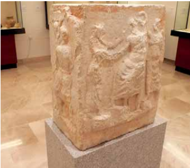
ARA CON DECORACIÓN EN RELIEVE DEL ARCO DE LOS GIGANTES, CONSERVADA EN EL MUSEO MUNICIPAL DE ANTEQUERA

Hispania puede corresponder a las estatuas recuperadas en la escena del teatro romano de Segobriga (Saelices, Cuenca) o del foro de la ciudad romana de Asido (Medina Sidonia, Cádiz) (LOZA 2010: 281-301) 5 .