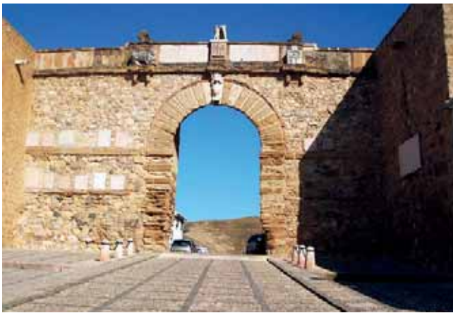
VISTA ACTUAL DEL ARCO DE LOS GIGANTES DE ANTEQUERA

247-258; 2010: 365-382). Este modelo se había ya utilizado en Martos, en la construcción del edificio del Cabildo en 1577, en el que se habían colocado las inscripciones halladas en la ciudad, como prueba y símbolo de su antigüedad clásica y emblema con el que se proclamaba su alejamiento de su pasado medieval (LLEÓ CAÑAL 1995: 64-65; PANZRAM 2009: 255 y 2010: 373). El Arco de los Gigantes va a seguir este modelo y va a incorporar en su decoración tanto inscripciones originales romanas, como copias modernas en los casos en que determinadas circunstancias imposibilitaban el traslado de aquellas, así como esculturas romanas, algunas de gran tamaño, que se habían encontrado en la propia Antequera o también en los pueblos del entorno (COBOS 2005: 92-93; ROMERO BENÍTEZ 1989: 174).