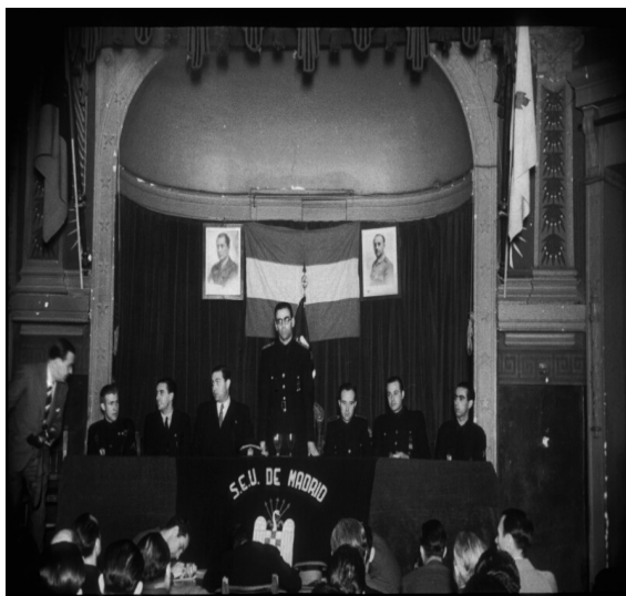
Antonio Tovar, en el centro de la imagen, durante una conferencia en el SEU de Madrid en 1943.