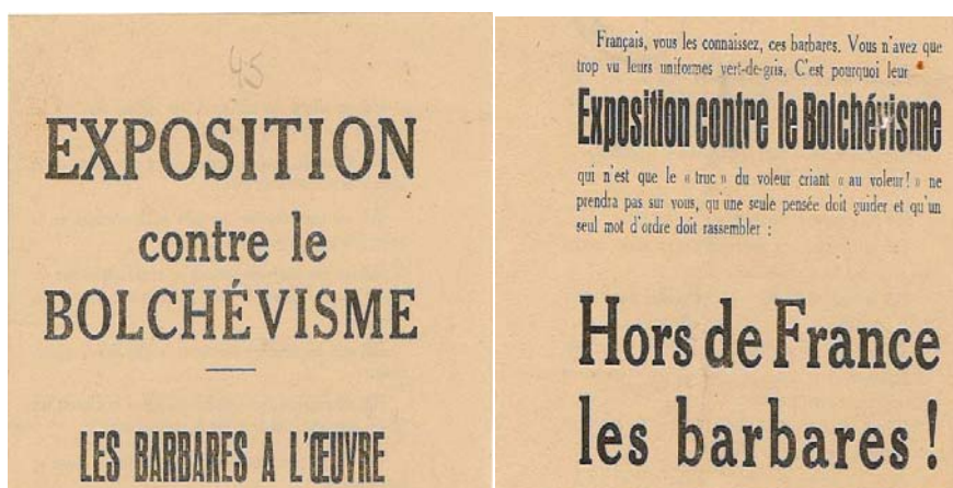
Folleto clandestino comunista editado a raíz de la exposición.

Llegados a este punto debemos plantearnos las siguientes cuestiones. ¿Cómo se gestionó la participación española en dicha exposición? ¿Qué actores la protagonizaron? ¿Con qué medios se trabajó? ¿Hubo tensiones, como era práctica común en materia propagandística, en su puesta en marcha? A todos estos interrogantes daremos respuesta a través de documentación inédita transferida desde el Archivo del Ministerio de Exteriores al AGA.