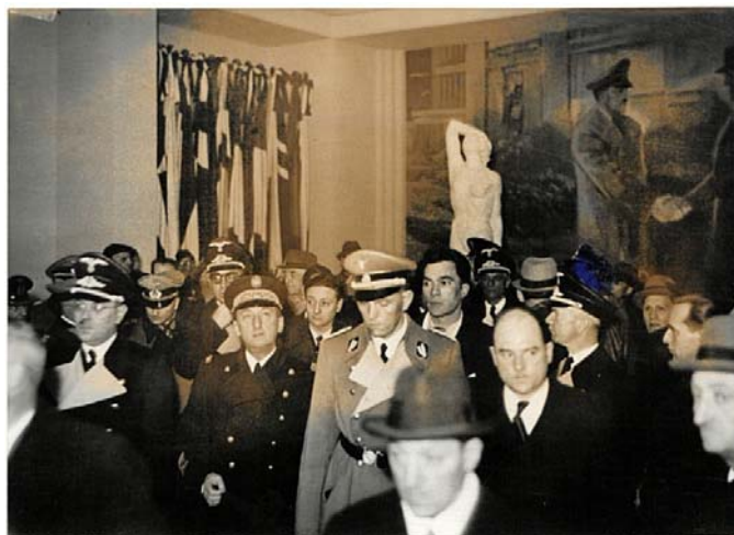
Autoridades francesas y alemanas visitan una de las salas de la exposición. A la izquierda banderas de las naciones participantes y al fondo cuadro alusivo a la entrevista de Montoire entre Hitler y Pétain.

propaganda anticomunista, que incluso contaron con el apoyo en un momento puntual de la propia Iglesia católica, pese a sus conflictos contradicciones con el nazismo. 8 En varios textos previos hemos realizado –junto al profesor López Zapico– una primera aproximación sobre el tema, poniendo el énfasis en las celebradas en el Tercer Reich, la Francia de Vichy y la España franquista. 9 En todas ellas hemos conjugado la Nueva Historia Cultural con la Política, dando un papel predominante al estudio de las imágenes y de las líneas ideológicas que promovieron la construcción de las mismas. En esta ocasión queremos profundizar en el peso específico que tuvo la España franquista en uno de estos eventos internacionales -en este caso el celebrado en suelo de su vecino francés-, cómo se proyectó a nivel extranjero y cuáles fueron sus motivaciones y medios. Además, mediante este ejercicio podremos ahondar en el funcionamiento de la propaganda exterior española durante la contienda mundial, poniendo en evidencia la lucha constante que se producía entre el "querer" y el "no poder". Todo ello lo realizaremos a partir de documentación archivística española y francesa inédita.