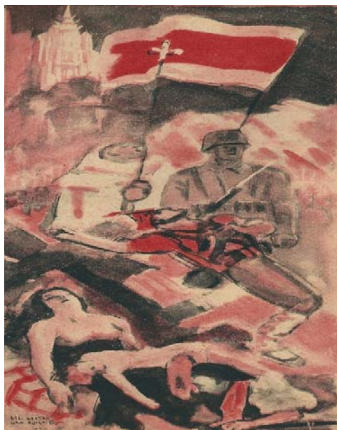
Uno de los paneles decorativos del Stand español, obra de Michel Jacquot.