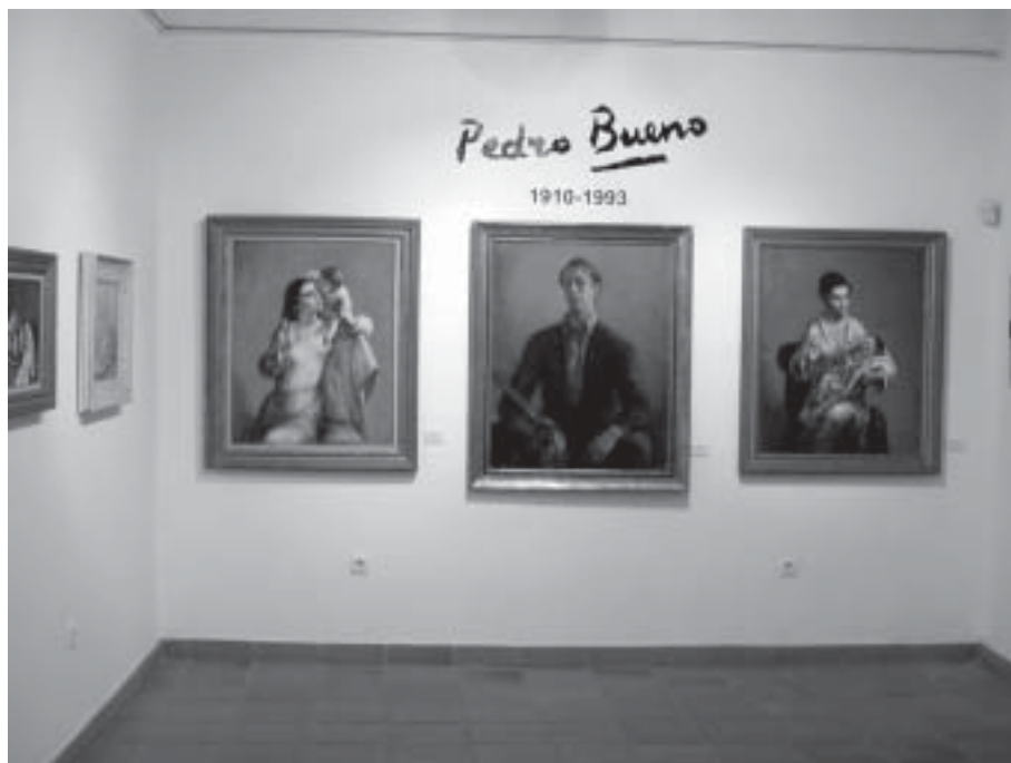
Sala Pedro Bueno, fruto de un convenio con la Fundación Cajasur, 2013-2014.