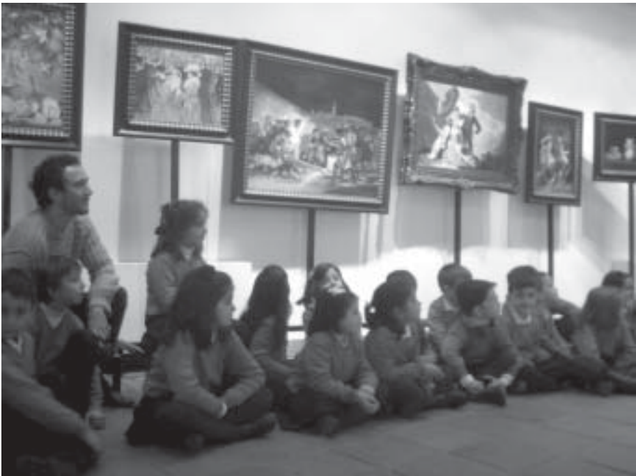
Exposición explicativa de los cuadros del Museo del Prado: "El Museo llega a tu ciudad".