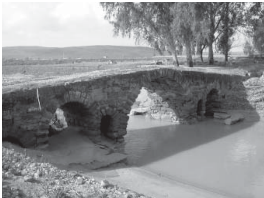
Foto vista del puente romano, S.O.S.

Como cada año, publicamos nuestra memoria anual en el Boletín de la Asociación Provincial de Museos Locales de Córdoba.