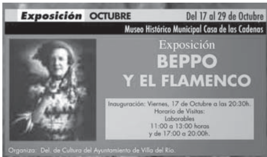
Cartel exposición Beppo y el flamenco.

Organiza: Agrupación de Hermandades y Cofradías.