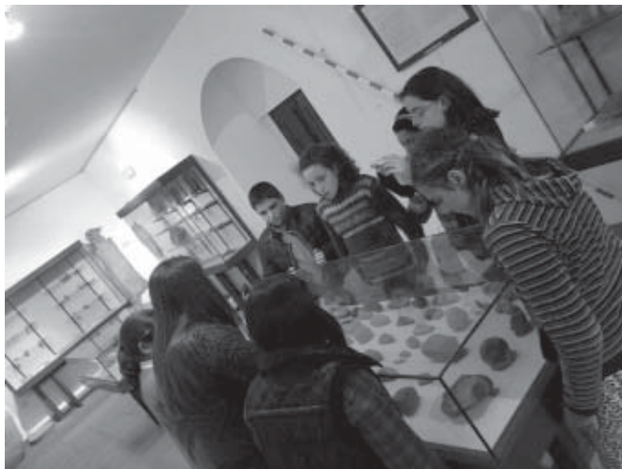
Visita de escolares a la sala de Arqueología.