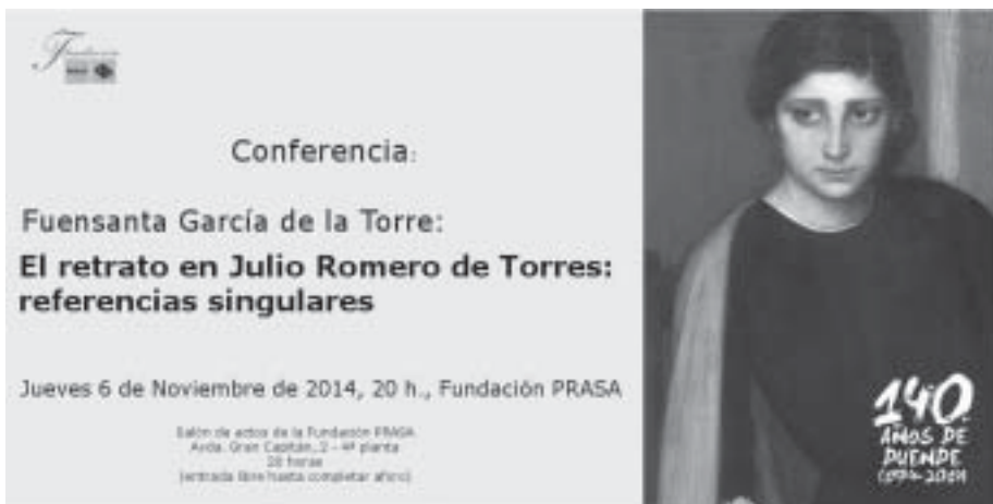
Invitación a conferencia. Homenaje a Julio Romero de Torres