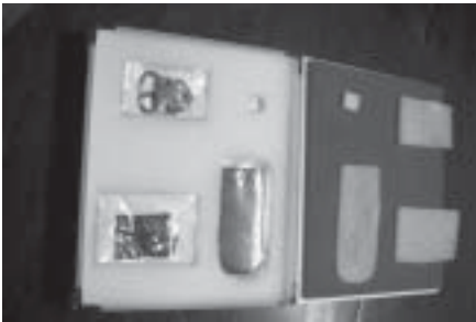
Caja preparada para el transporte de las obras

chado el 8 de abril, y con el correspondiente permiso de exportación temporal del Ministerio de Cultura, previo dictamen favorable de la Junta de Calificación, Valoración y Exportación de Bienes del Patrimonio Histórico en su sesión de 26 de marzo de 2014. De la misma forma, antes de la salida de los bienes de nuestro almacén recibimos en el museo el certificado de la compañía de seguros Axa Art France , certificando que los traslados y el período de exposición estaban cubiertos por una póliza que cubría el importe de la tasación realizada por nuestro museo, estando las piezas aseguradas tanto durante los traslados como durante el período de exposición.