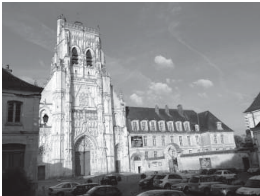
Vista general de la fachada de la Abadía de Saint Riquier, sede de la exposición