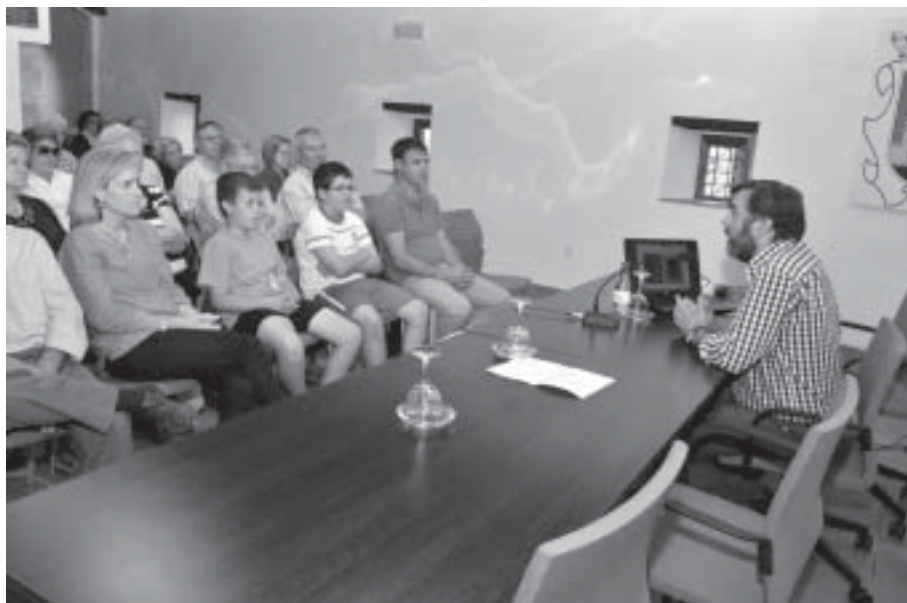
Día Internacional de los Museos. Conferencia en Dos Torres

Belén Viviente de Torrecampo (Córdoba), centradas en el conjunto de tumbas excavadas en la roca y en el propio yacimiento arqueológico del castillo.