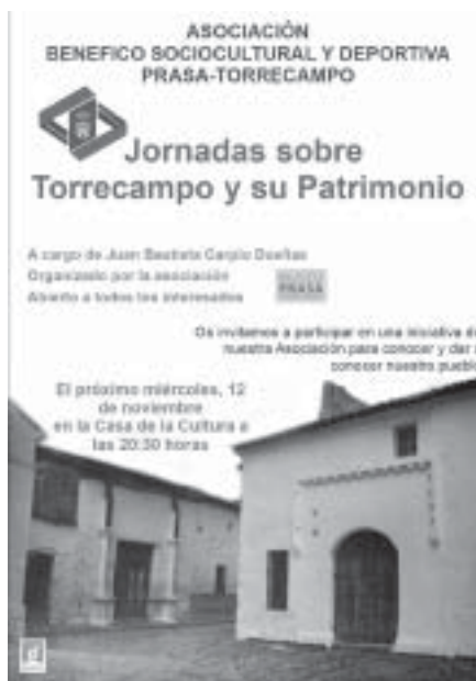
Programa de difusión del Patrimonio Histórico de Torrecampo. Cartel anunciador de una de las charlas

Como se ha comentado anteriormente, durante el año 2014 se ha intensificado la colaboración del museo con la Asociación Benéfico Socio Cultural PRASA Torrecampo. Dentro de los nuevos proyectos desarrollados por la Asociación destaca el de formar un grupo de voluntarios culturales para difundir el valor de los principales elementos patrimoniales de la población. Como inicio del proyecto, durante los meses de noviembre y diciembre de 2014 se organizó un curso de formación consistente en cinco charlas introductorias conforme al siguiente programa: