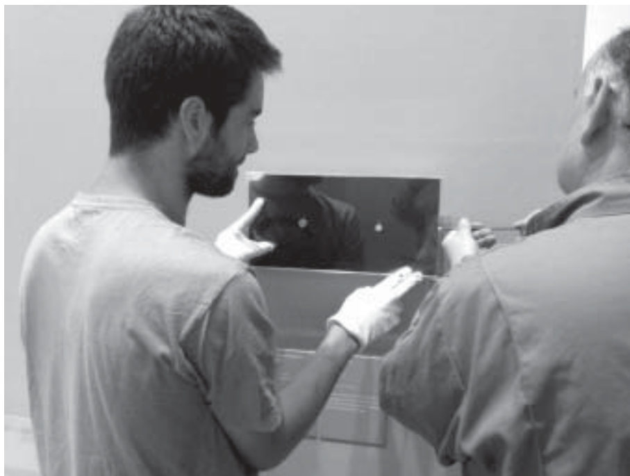
Montaje de soporte para la exposición de monedas

usado para piezas de pequeño formato (entre ellas, dos de las trasladadas en esta ocasión) en exposiciones temporales anteriores. Para adaptarla a las necesidades específicas de las 4 piezas objeto de este préstamo, se adaptó el material aislante y amortiguador (inerte) a las dimensiones y características específicas de los objetos. Al tratarse en tres de los casos de piezas metálicas (bronce), para evitar la incidencia en su conservación que pudiera ocasionar la oscilación de humedad relativa durante el traslado, se optó por mantenerlas dentro de bolsas de vacío. En definitiva, se ha utilizado un sistema de embalaje profesional que garantiza las mejores medidas de protección de las obras ante cualquier circunstancia accidental.