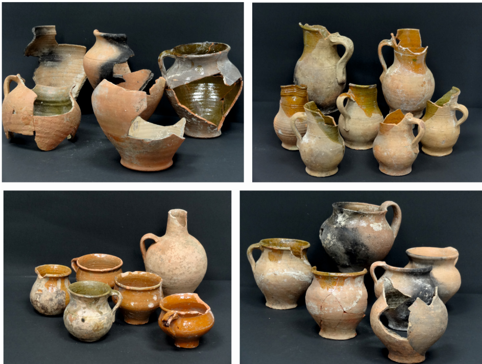
Fig. 2. Bodegón con algunas de las piezas más representativas de la cerámica común.

La cincuentena larga de piezas con cubierta estannífera que hemos recuperado dentro de la letrina del palacio, ofrece una serie de características que a priori marcan el interés frente a otros conjuntos coetáneos. En primer lugar, la innegable personalidad de la colección en la que conviven de forma armónica cacharros de basto con toda una extensa panoplia de piezas de mesa cuyo origen encontramos dentro de un ámbito meramente local, peninsular e incluso de fuera de nuestras fronteras. A través de las características formales y sus programas decorativos se pueden datar con exactitud y, por extensión, dan pie a situar cronológicamente al resto de los cacharros los cuales, a causa de su relativa inexpresividad, suelen ofrecer escasas pistas a la hora de otorgarlos una cronología precisa. En segundo lugar, permiten ciertas aproximaciones tanto a las redes comerciales y a los gustos estéticos del momento así como a las formas en que la aristocracia local vestía sus mesas a inicios de la Edad Moderna.