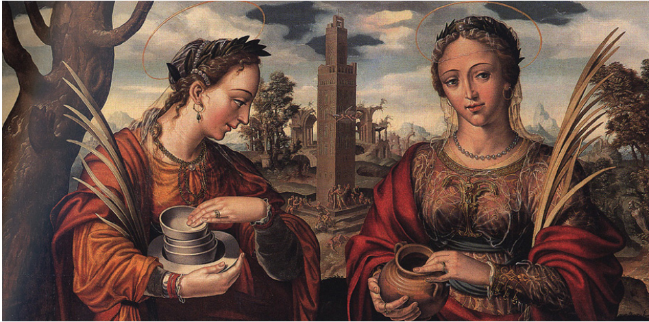
Fig. 1. Hernando de Surtorio. Santa Justa y Santa Rufina. Retablo de los Evangelista. Catedral de Sevilla.