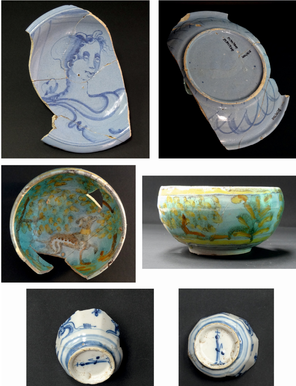
Fig. 4. Vista de tres de las cerámicas más selectas del palacio. Arriba, plato de Liguria; en medio, cuenco de Talavera y debajo, tacita de Lisboa.