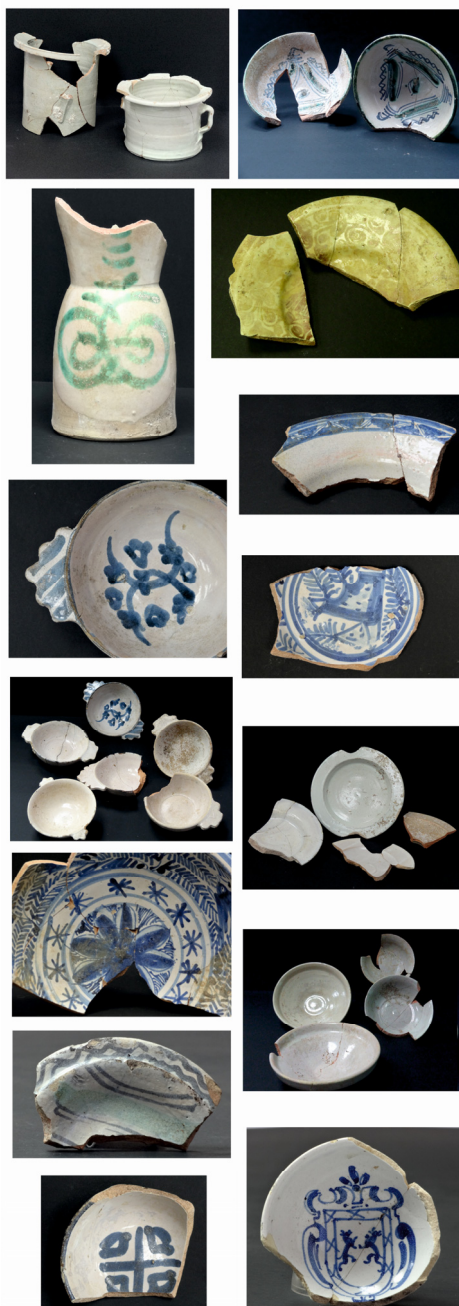
Fig. 3. Selección de piezas vidriadas de distintas procedencias recuperadas en la letrina.