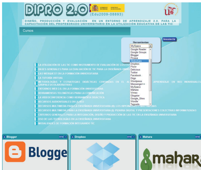
Figura 1. Imagen entorno Dipro 2.0.