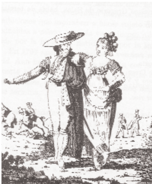
Fig. n.º 41.- El torero y la manola . Apud Claramunt, F. (1989): Historia Ilustrada de la Tauromaquia I , Madrid, Espasa-Calpe, pág. 544.

La finalidad primordial de dichos textos era enaltecer las virtudes heroicas de sus nobles participantes, de ahí el detallismo en la descripción del exorno del ropaje, el ensalzamiento del arrojo de los caballeros, de su garboso andar, de su inteligencia para zafarse del incesante peligro... Es decir, que