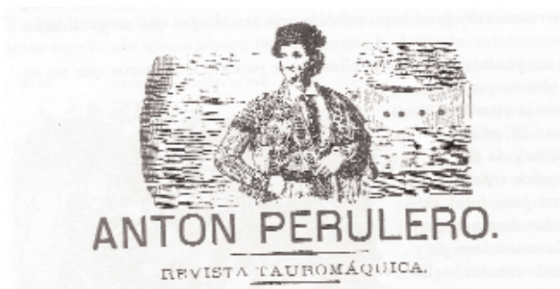
Fig. n.º 44.- Dos portadas de periódicos de la época. Apud Cossío (1989: 548, 549).

can a componer estos textos tan sugerentes, en el que uno de los principales protagonistas es Francisco Montes.