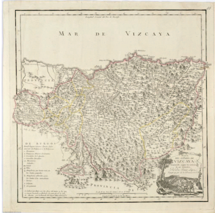
Mapa del Señorío de Vizcaya de Tomás López (1769)