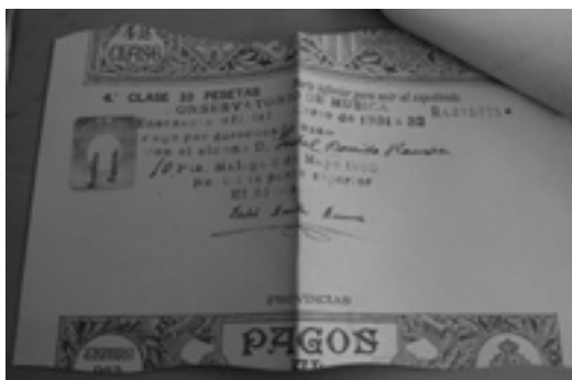
Imágenes 3 y 4. Expediente personal en A.H.P.M., Fondo Conservatorio María Cristina, Expedientes personales, Sig. 74587, s.f.