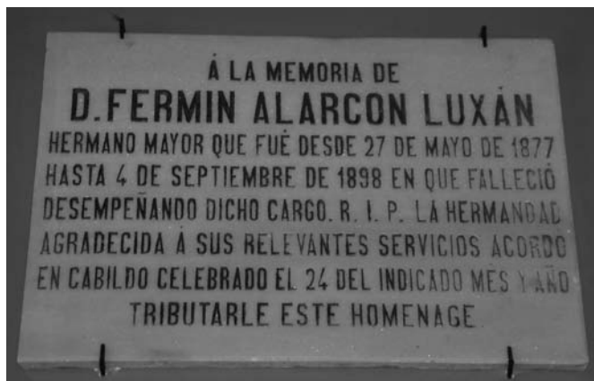
Fig. nº 16: Placa dedicada a la memoria de D. Fermín Alarcón Luján

Destacado empresario de su época que mandaba sus productos a las principales capitales de Europa y América. Tenía sus propios lagares y bodegas en las que embotellaba el vino de sus viñas para exportarlo junto con otros productos. Solares, casas y almacenes en Málaga. Tierras en Cártama, la principal, la Finca Los Remedios que él mismo formó con la adquisición de terrenos colindantes; diez pequeñas casas para alquiler en el pueblo; y su casa particular en la calle Concepción de Cártama. 104