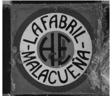
Figs. nº 9 y 10. Banco y losa en la Ermita de Nuestra Señora de los Remedios, Cártama.