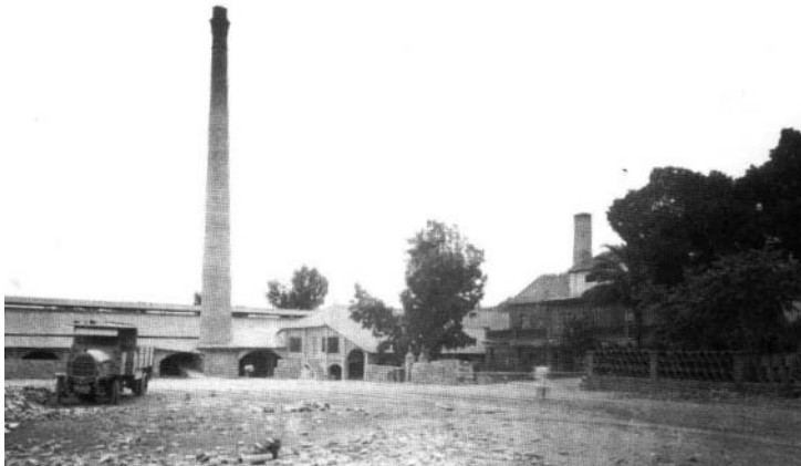
Fig. n° 6: La fábrica de Santa Inés en 1920.