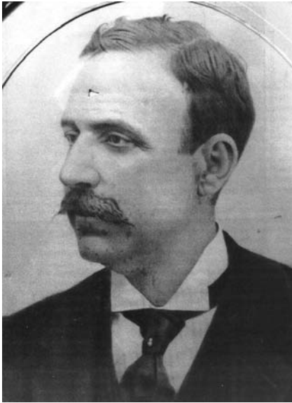
Fig. nº 12: D. Eduardo Strachan Viana Cárdenas

Nació en Cártama en el año 1853. Dedicó toda su vida a la arquitectura. Comenzó su actividad como maestro de obras en 1870 y entre sus obras más conocidas se encuentran la mayoría de los edificios de la recién creada Calle Larios. Enumerar las obras realizadas por don Eduardo Strachan sería una labor interminable, ya que a la larga lista de las conocidas habría que sumar otras en las que tuvo participación y siempre había hallazgos de última hora. Por esto me remito a la bibliografía existente, en la que se describen la mayoría de ellas y se dan cuantiosos detalles (Fig. nº 12).