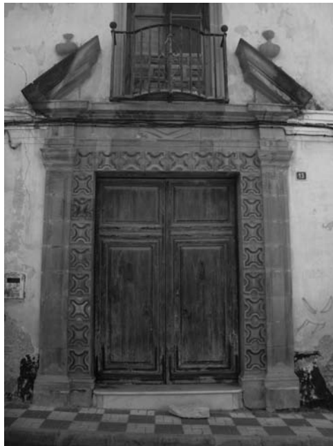
Fig. nº 13. Casa de don José Alarcón Luján en Cártama.

Su casa en calle del Viento, es una de las principales y mas hermosas del pueblo. De estilo neobarroco, destaca la entrada con frontón partido para alojar el balcón (Fig. nº 13).