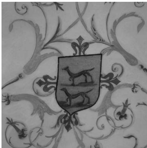
Fig. nº 1: Blasón de los Cárdenas, en la cúpula de la casa palaciega de los Salcedo en Cártama.