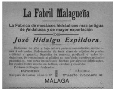
Fig. nº 7: Anuncio en prensa sobre la Fabril Malagueña