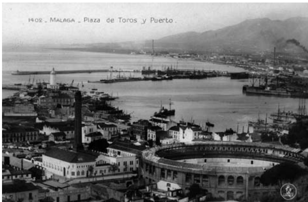
Fig. nº 8: Abajo a la izquierda, la fachada de la Fabril Malagueña