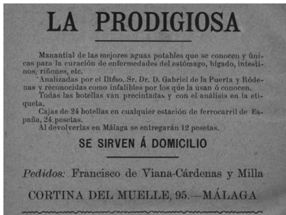
Fig. n° 5: Anuncio aparecido en la Guía de Málaga y su Provincia para el año 1907