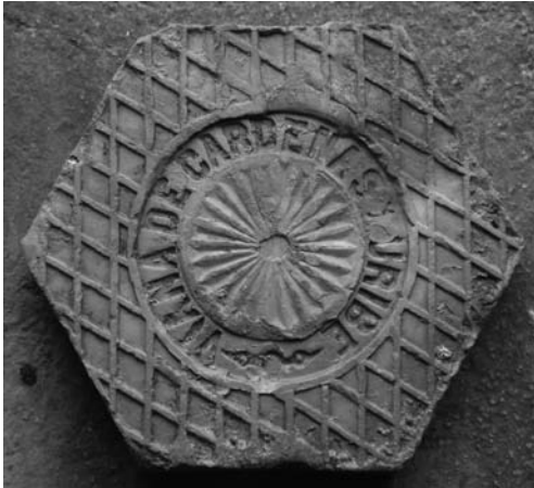
Fig. nº 4: Ladrillo