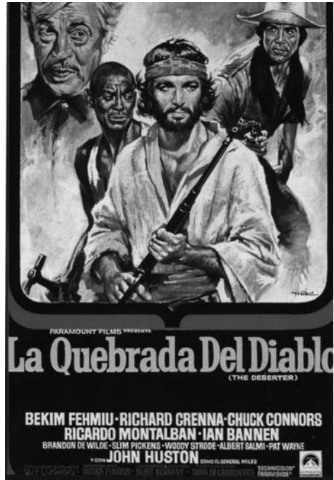
Cartel publicitario de la película La Quebrada del Diablo

Las tareas filmicas tuvieron una duración de tres meses, desde comienzos de septiembre hasta finales de noviembre de 1969. Los exteriores se grabaron en localizaciones de las provincias de Almería y Málaga (Sierra del Torcal) –algunas fuentes señalan también Yugoslavia–, y los interiores en los estudios De Laurentiis de Roma 13 . El rodaje se inició en Almería el lunes 8 de septiembre. El fin de semana previo al comienzo del mismo el productor Dino de Laurentiis, el director Burt Kennedy y algunos miembros del equipo técnico visitaron algunos escenarios naturales de la provincia de Málaga y se convencieron de que el Torcal de Antequera era uno de los lugares idóneos para el desarrollo de la acción. Durante esta fugaz visita se alojaron en el hotel Al-Andalus de Torremolinos. Los equipos trabajaron en tierras almerienses por espacio de un mes. Las dunas de Cabo de Gata y varias localizaciones del municipio de Tabernas fueron los principales escenarios elegidos 14 . La primera semana de