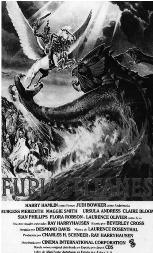
Cartel publicitario de la película Furia de Titanes