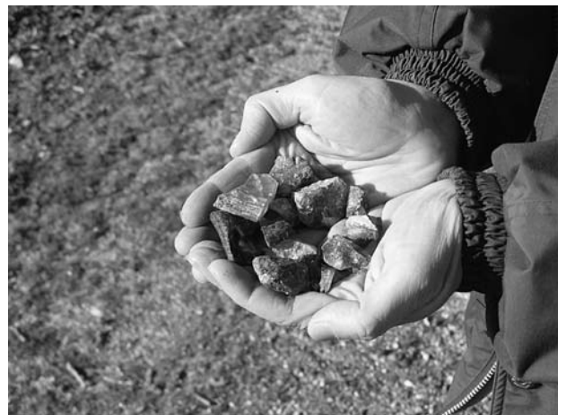
Figura 6. Restos de fundición.

Analizamos muestras de vidrios de distintos colores recolectados en escombrera (Fig. 6). Hay que señalar la gran abundancia de vidrio verde de botella, lo que nos indica que el depósito no es muy antiguo, correspondiendo a la época de la familia Sáez cuando las botellas fueron un importante producto.