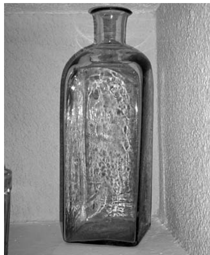
Figura 7. Piezas y útiles fotografiados actualmente en Cadalso.