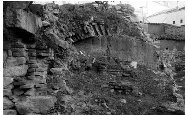
Figura 5. Vistas frontales de los restos de los hornos.

Quedan restos de dos hornos, colindantes. La pared Norte, de 3,2 m de ancho, es la mejor conservada. Está construida con mampuestos graníticos, puede que procedentes del Cerro de Guisando, cercano a Cadalso (Fig. 4).