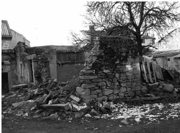
Figura 4. Vista trasera de los restos de los hornos.

linda con la anterior calle y con la de La Iglesia. Flanqueando el portalón había dos columnas de piedra, que ahora están en el parque.