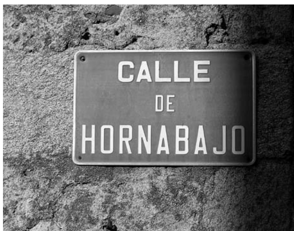
Figura 1. Rótulo de la calle casaldeña de Hornabajo, donde tiempo atrás había hornos de vidrio

Larruga (24) dedica varias páginas al gremio de los mercaderes de vidrio y vidriado. Después de relatar diversas vicisitudes y de describir los lugares donde se vendía en Madrid, expresa lo siguiente: "Las fábricas de vidrio, especialmente las de la villa de Cadalso, provincia de Toledo, en las varias ocasiones en que se ha tolerado en Madrid la venta por menor de sus manufacturas á los mismos fabricantes ó tragineros, han experimentado, que la saca ha sido mayor y mas activa, y por consiguiente las labores seguían sin intermisión; y de aquí resultaba una grande utilidad á los interesados en las fábricas. Léjos de resultar perjuicio de esto al público de Madrid, lograba el beneficio de 25 ó 30 por 100; pues un vaso regular que en las tiendas de vidrio cuesta seis cuartos, lo daba los tragineros por quatro, y á este tenor las demas vasijas; facilitándose así el consumo, el qual se ha minorado y sentido en las fábricas inmedia-