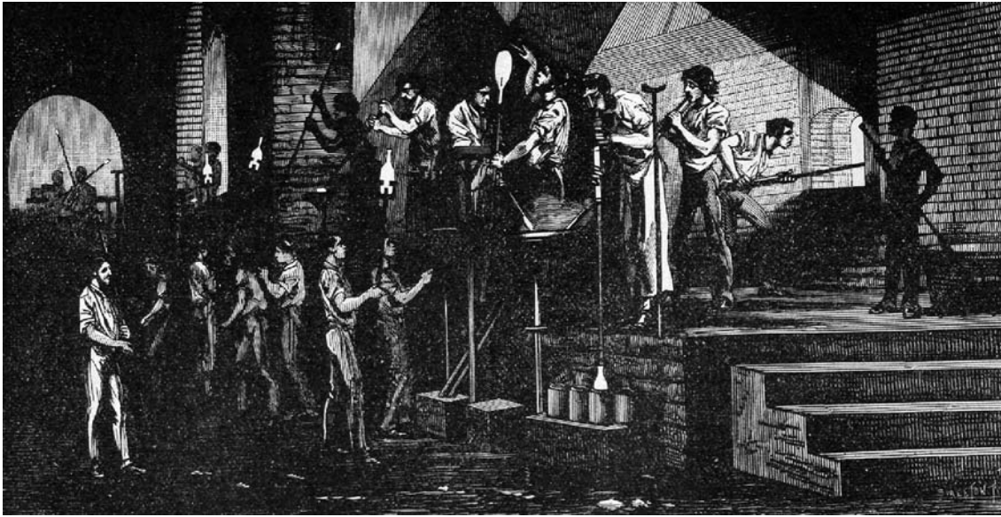
Figura 2. Fabricación de botellas (Wagner, Fisher y Gouthier, 1905).

granito, y empezaba a contornear su parte anterior, girando de derecha a izquierda. Cada cierto tiempo soplaba por el tubo, procurando que el vidrio adquiriera, alrededor de la cavidad que se iba formando.