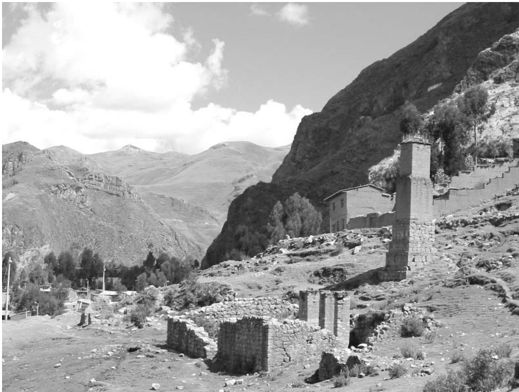
Figura 1. Horno colonial de Qoripaccha (1650), en los arrabales de Huancavelica. Se usó inicialmente para el tratamiento del mercurio; posteriormente fue adaptado para obtener oro y plata.