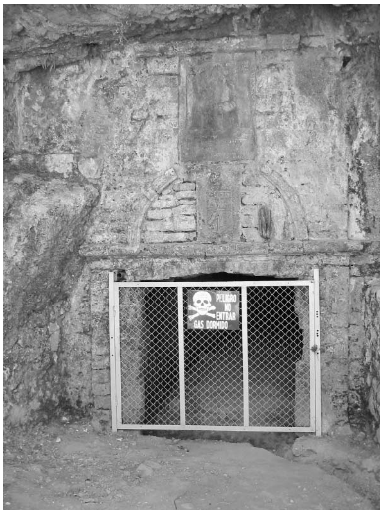
Figura 4. Socavón colonial de Nuestra Señora de Belén de entrada a la mina de Santa Bárbara. Construido entre 1606 y 1642, tiene 560 m de longitud.

e, incluso, se dieron de baja en el cómputo de la mita. Por el contrario, se incorporaron irregularmente 100 mitayos de Chumbivilcas puesto que, de acuerdo con las condiciones del asiento, sólo podían destinarse al transporte como arrieros y a las fundiciones.