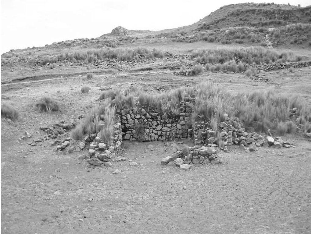
Figura 2. Resto de horno de azogue en las inmediaciones de la bocamina colonial de San Javier (mina Santa Bárbara).

ro del metal que corre, aunque sea pobre o rico en conformidad del nuevo asiento que al presente corre, y que es constante 9 les cuesta a los mineros mucho trabajo en buscar otros indios alquileras que suplan la falta de los indios que dejan de venir de las provincias a cuyo cargo está la remisión de las mitas, y de los que se alquileran se huyen muchos indios en perjuicio de los mineros sin los muchos gastos que tienen en la paga de mayordomos, herreros, velas, acero y picos, carbón y otros muchos gastos en que son agraviados los mineros de este asiento, y esto que llevo dicho dijo ser la verdad so cargo de su juramento hecho; en que leído, se afirmo y ratificó, y es de edad de cuarenta y cinco años, no le tocan las generales de la ley, y lo firmó de su nombre, y yo que de ello doy fe.