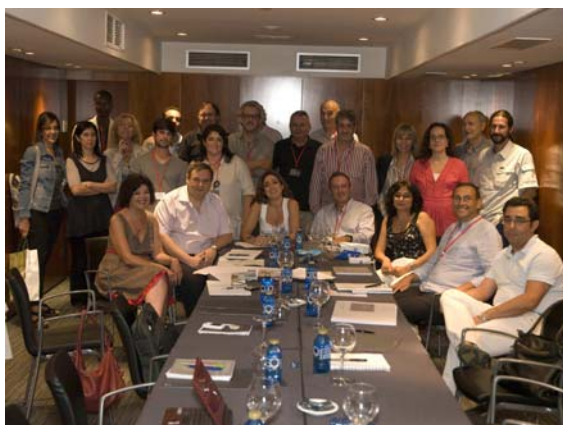
Lám. 2. Grupo de trabajo sobre la candidatura de los Dólmenes de Antequera a Patrimonio Mundial durante el seminario Megalithic Sites and the World Heritage Convention.

El documento final incluyó las opiniones y recomendaciones vertidas en las distintas mesas de debate y fue presentado y aprobado el 25 de octubre de 2011 por el Consejo de Patrimonio Histórico Español reunido en el Monasterio de El Paular (Madrid). Este consejo es el órgano de coordinación entre la Administración del Estado y de las