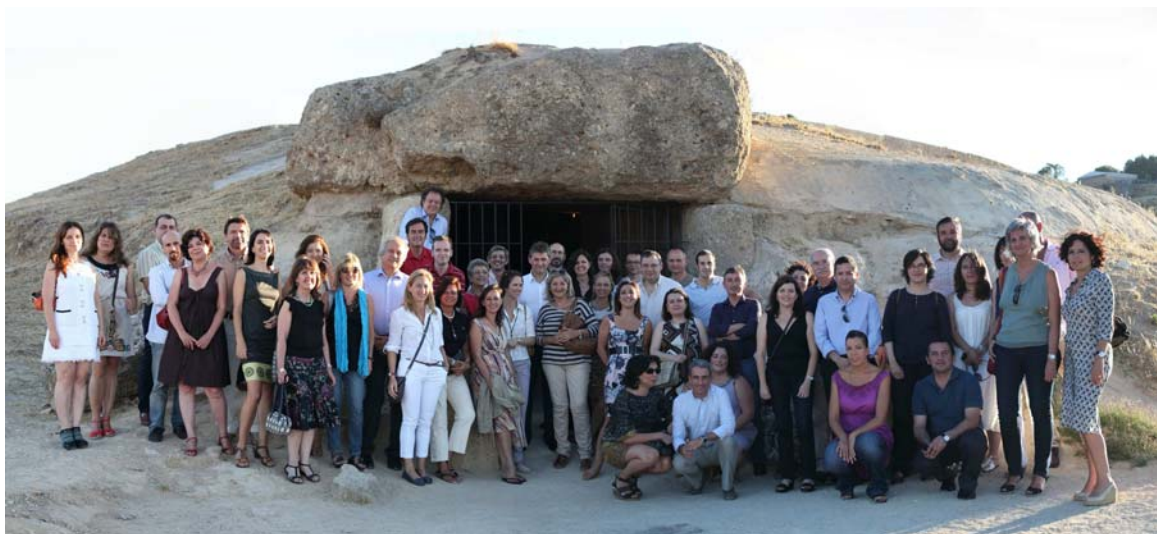
Lám. 3. Visita de los miembros del Consejo de Patrimonio Histórico Español a los Dólmenes de Antequera.