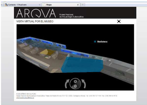
Figura 1. Visita cenital del espacio expositivo

Cuando lo desee, de manera intuitiva, el internauta pasea con total libertad por el perímetro de los exteriores del museo a pie de calle, para así entrar en el interior del mismo y descubrirlo.