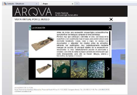
Figura 3. Contenidos multimedia

El 2 de marzo se presentaba el proyecto V-Must en Roma una Red de Excelencia de la UE financiada por el 7º Programa Marco cuyo principal objetivo es apoyar al sector museístico a innovar en la utilización de las nuevas tecnologías y la realidad virtual para generar experiencias de valor añadido para el visitante.