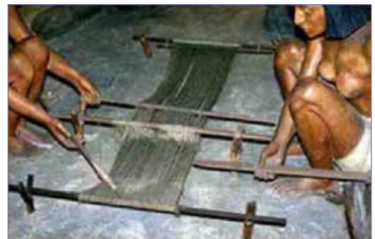
Fig. 1. Telar de suelo egipcio.

Podemos afirmar que este tipo de telar de suelo (Fig. 1) se utilizó a partir de Egipto hasta Irán, desde el Neolítico a la Edad del Bronce. Gracias a las representaciones de este telar en Egipto podemos conocer cómo funcionaba y que partes lo componían, vemos claramente como este telar era utilizado por dos tejedoras, que realizan las distintas tareas como el cambio de vertiente, manejo del lizo, pasado de la trama y el apretado del tejido con la espátula, como podemos ver en el mural de la tumba de Khumhotep en Beni Hasan de la dinastía XII o en la maqueta de madera de la tumba de Meketre.