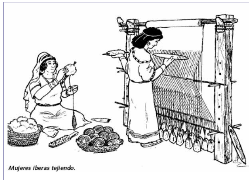
Fig. 2. Imagen de un telar de pesas, junto con la elaboración del hilo con huso de fusa-yola inferior.

Los primeros ejemplos del uso de un telar de pesas (Fig. 2) los tenemos en Hungría, donde se han encontrado evidencias en lugares pertenecientes a la Cultura de Kőrös, con cronologías calibradas entre el VII y VI Milenio a. C., en pleno Neolítico. En la parte norte de la zona mediterránea encontramos la misma situación para el telar de pesas durante el periodo Neolítico, lotes de pesas aparecen en Anatolia, Italia y Grecia, que pueden pertenecer a telares, pero esas evidencias no están asociadas a tejidos o a otros elementos de manufactura textil. Las primeras evidencias textiles de esta zona provienen del Período Cerámico de Catal Hüyük, en Turquía, alrededor del VI Milenio a. C. (BARBER 1991:91-104).