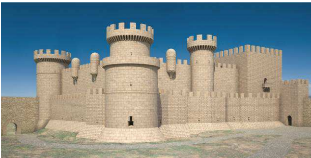
Figura 1. Comparativa del dibujo de la Corte y Ruano (arriba) y reconstrucción virtual (abajo)

Por esta información, muy dispersa, conocemos el nombre de algunas torres y dependencias, como es el caso del soportal de la puerta de entrada, la denominada torre Alta, la torre de la Campana y la torre del Homenaje, lo que viene a completar, junto con la torre de la Cadena, el conjunto de torres que rodeaban las murallas principales.