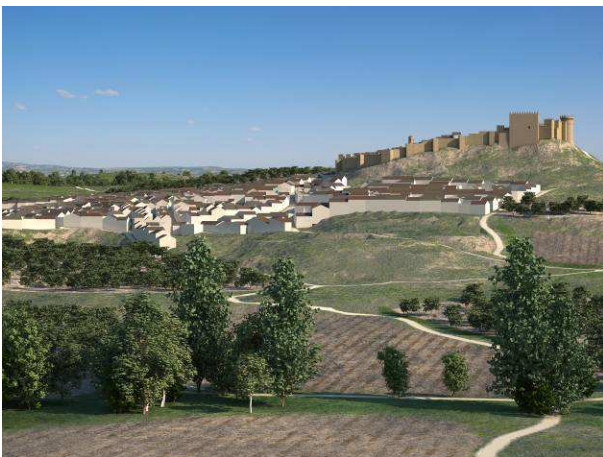
Figura 2. Vista virtual de la villa de Aguilar desde el norte

Por esta información, muy dispersa, conocemos el nombre de algunas torres y dependencias, como es el caso del soportal de la puerta de entrada, la denominada torre Alta, la torre de la Campana y la torre del Homenaje, lo que viene a completar, junto con la torre de la Cadena, el conjunto de torres que rodeaban las murallas principales.