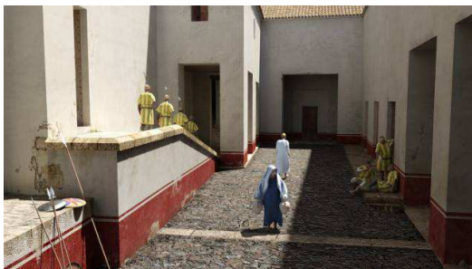
Fig. 6. El Espacio Trapezoidal

Por otra parte, era esencial dar un aspecto de ciudad vivida . La documentación arqueológica nos muestra cómo los enlucidos se reparan una y otra vez a consecuencia del deterioro producido por elementos como la humedad o, simplemente, por la impronta que deja el paso del tiempo. En este sentido, cabría resaltar como algunos de los ejemplos más logrados, el alminar de la mezquita aljama y el llamado Espacio Trapezoidal (fig. 6).