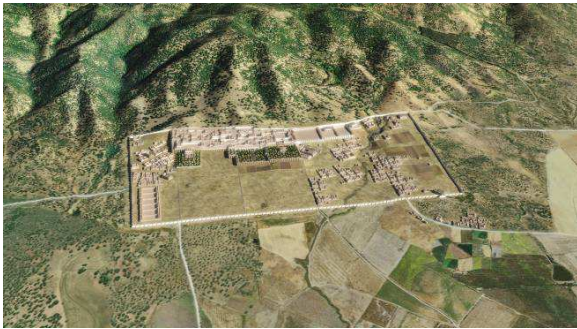
Fig. 1. Reconstrucción virtual de Madinat al-Zahra

De esta manera, la ciudad de Madinat al-Zahra se convierte en la protagonista de un audiovisual que recrea no sólo la arquitectura y sus valores, sino también su emplazamiento, su disposición organizativa y sus funciones en el momento de máximo esplendor como capital del Estado omeya de al-Andalus en el siglo X (fig. 1).