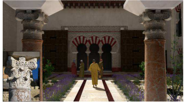
Fig. 4. Vivienda de la Alberca. Reconstrucción e imagen actual de uno de sus capiteles

acondicionamiento de los espacios y para permitir al espectador una mejor introducción en los diferentes ambientes. Este aspecto resultaba especialmente interesante, sobre todo, si tenemos en cuenta que el audiovisual recrea la vida en el sector palaciego de la ciudad, circunstancia que proporcionaba una ocasión única para trabajar con una compleja multiplicidad de elementos. En este sentido, merece especial atención el tratamiento de las estructuras arquitectónicas, en las que se plasma toda una variedad de texturas que incluyen: