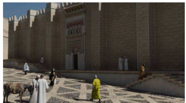
Fig. 2. Levantamiento de la mezquita aljama

Su reconstrucción exigió una profunda investigación de los restos conservados que permitió la clarificación de los distintos elementos que componían su estructura, junto a la ubicación y disposición de su decoración. A este respecto, el levantamiento del alminar conllevó la labor más exhaustiva puesto que fue necesario precisar su configuración, sus dimensiones, su decoración arquitectónica y la definición del tipo de almenas utilizadas. Lógicamente, esta investigación estaba ya avanzada, sin embargo, la elaboración del audiovisual obligó a centrar la atención en todos los elementos que componían el edificio, desde los más aparentes a los menos visibles.