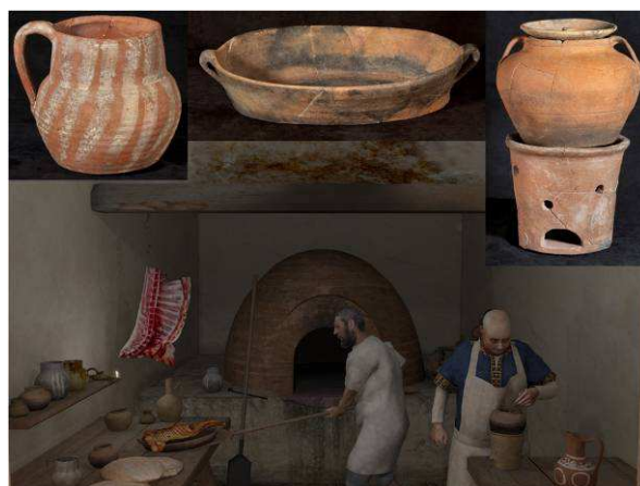
Fig. 8. Cocina de la Vivienda Oriental de Servicio y vajilla cerámica original

Un complemento imprescindible de la vida en la medina es, sin lugar a dudas, la cerámica. El ajuar cerámico representado es transportado por gran parte de los personajes relacionados, especialmente, con el ámbito más doméstico del alcázar, aunque también aparecen en estancias reservadas al servicio de importantes personajes. Así, en la recreación tanto de los espacios de tránsito, como pueden ser las calles, como de las habitaciones que contienen una marcada funcionalidad de servicio, la inclusión de estos elementos complementa a los personajes y permite una mejor percepción de los mismos (fig. 8).