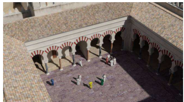
Fig. 5. Mezquita aljama. Patio

- el diferente acabado de los pavimentos que oscilan de la rugosidad del ladrillo cocido que encontramos en el Salón Basilical Superior hasta el brillo que acompaña a los pavimentos de mármol y que permite el reflejo de los elementos arquitectónicos que lo rodean, como en el gran Salón de recepciones. A este respecto, también deben resaltarse los pavimentos del patio de la mezquita aljama (fig. 5) y los que forman parte de los Edificios Superiores. En ellos cobra especial relevancia no sólo el tratamiento que se hace de sus superficies, representadas por la caliza violácea, en un caso, y la calcarenita, en el otro, sino muy especialmente por la disposición que presentan, con idéntico despiece al que muestran estas estancias y que aún hoy puede apreciarse con claridad.