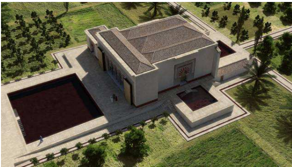
Fig. 3. Pabellón Central y Jardín Alto

Sin embargo, el estudio del Pabellón (fig. 3) caminaba en un nivel inferior puesto que compartía con la mezquita aljama un intenso grado de expolio que tan solo había respetado restos muy puntuales del edificio. Este factor, aunque dificultaba la investigación, en modo alguno la había imposibilitado puesto que, al igual que el Salón, estaba recubierto por un placado decorativo en piedra cuyo estudio sistemático hizo posible recomponer gran parte de su exorno. Esta labor permite identificar los distintos elementos arquitectónicos que componían la estructura y, por tanto, sentar unas bases sólidas y fundamentadas para su levantamiento tridimensional.