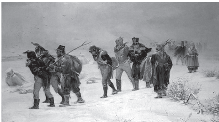
La désastreuse campagne de Russie (1812). Illarion Prianishnikov. Galerie Tretyakov, Moscou.

Pour les Russes et leur empereur, c'est l'heure de la libération. Mais le bilan de cette guerre s'avère effroyablement lourd: aux destructions matérielles de villes, de bourgs et de villages entièrement incendiés ou ravagés, s'ajoutent des pertes humaines colossales. C'est dire l'ampleur d'un cataclysme dont les conséquences sont immenses tant pour Alexandre et la Russie que pour l'ensemble du continent européen.