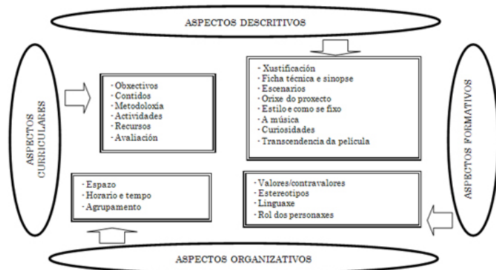
Figura 1: Elementos básicos que permiten explotar didacticamente o cinema nas aulas (Raposo e Sarceda, 2008)

Estas observacións simplifican a proposta realizada por Raposo e Sarceda (2008) que falan de considerar catro tipos de elementos que permiten explotar o cinema nas aulas (véxase figura 1).