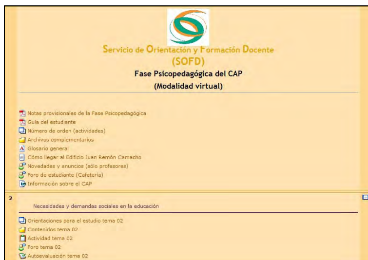
Imagen 1. Plataforma Moodle como recurso estratégico de enseñanza

Analicemos más detenidamente el proceso de reflexión instigado desde los foros, porque ha sido la herramienta más productiva, a nuestro modo de ver, en relación con la “educación para la ciudadanía”.