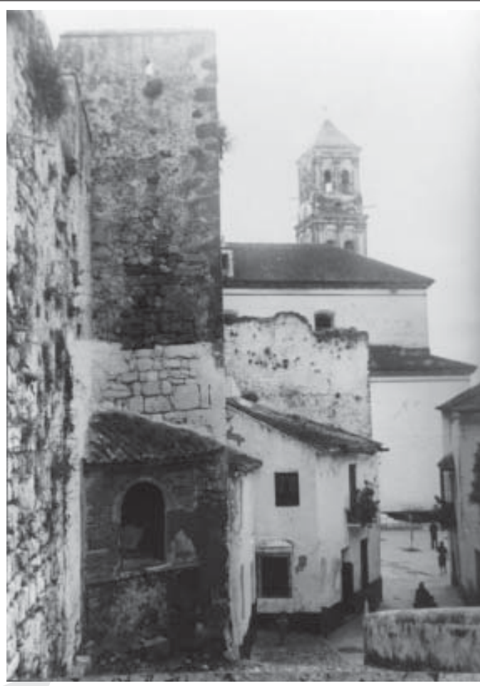
● Bajada del castillo. Capilla. Años 40 (Fuente: Fondo Temboury).

Los reclusos mayores de 60 años a los que la ley permitió la excarcelación 49 necesitaban, además del patrocinio y de la solvencia moral y material de algún vecino, los informes municipales que les permitieran residir en sus pueblos. Comenzaba