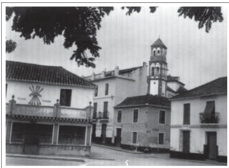
⊗ Sede del Auxilio Social de la Sección Femenina en Marbella (Fuente: Colección particular).

“Yo he ido a comer al comedor que le decía ‘El Falange’, iba porque mi madre no tenía, lo que recogía era para mi padre que estaba en una cama, mi madre habló para que nos dejaran ir a comer iyo no sé con quién hablaría! A mí y a mis hermanos nos dijo: tenéis que ir a comer a Falange. El comedor estaba en el centro, como llegaras dos minutos tarde ya no comías, te tenías que lavar las manos en la pila de los peces icon el frío que hacía entonces! Allí se comía unas veces sopa, otras arroz y un bollito de racionamiento para tres. Yo tenía tanta hambre que me ponía en los cristales antes de que abriera por ver en qué mesa estaba el bollo más grande y cuando abría entraba la primera. Por la noche ya abrían, se comía sólo una vez y ya hasta el otro día (...)” 43 .