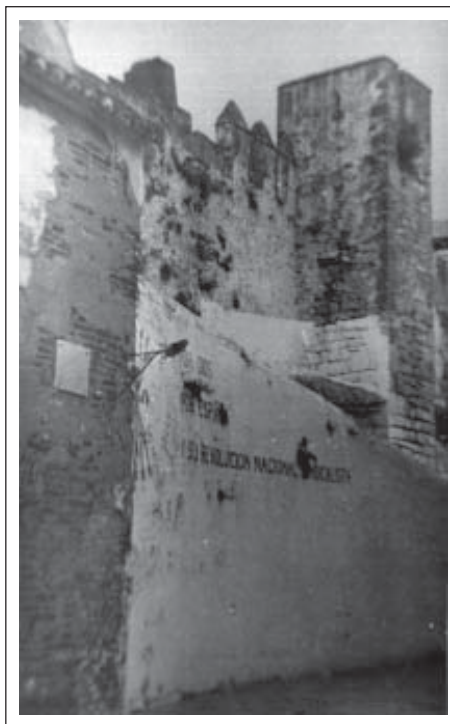
Subida al castillo. Propaganda del régimen. Posguerra.

Las detenciones de mujeres por el delito de “hurto en el campo” aumentan desde 1940. Entre 1940 y 1945 el 30% de las mujeres encarceladas procedentes del partido de Marbella lo son por delitos comunes. En el año 1941 se produce el mayor número de ingresos. Como en el caso de la “delincuencia juvenil”, la vinculación entre algunas de las detenidas y los efectos de la represión parecen clara. Sólo en el mes de febrero de 1941 nueve mujeres fueron arrestadas por robar frutos del campo, algunas también hi-