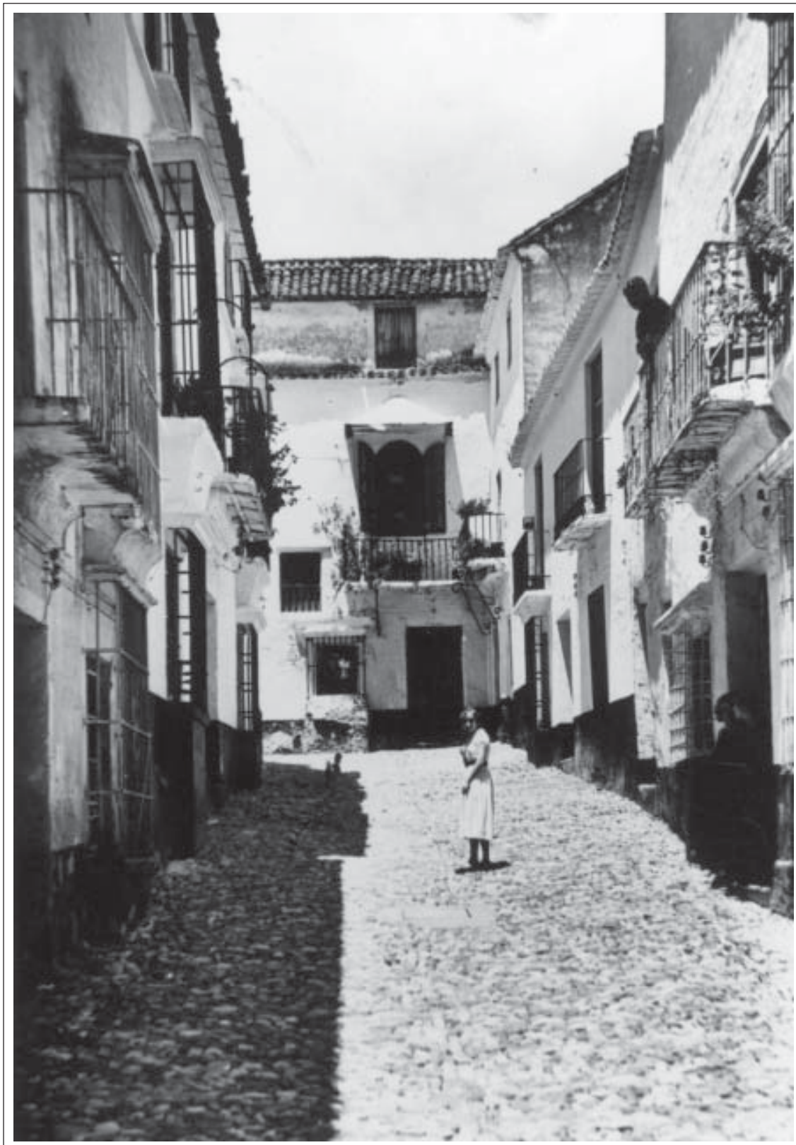
☉ Calle Virgen de los Dolores. Años 50.

maíz, negro, y te daban un bollito de unos 100 gramos por persona. El pan blanco no llegaba (...). Mi madre amasaba harina de cebada y maíz y en una hoja de palma lo metía en el horno, estaba malo, pero peor era ninguno (...)” 17 .