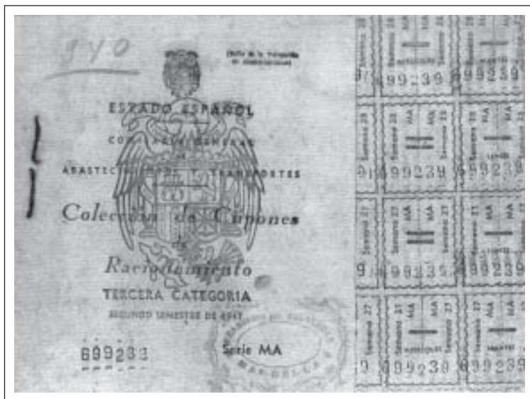
☉ Cartilla de racionamiento.

ros, aparezcan propietarios agrícolas con posibilidades más que suficientes de producir y consumir: un miembro de la familia de los Chinchilla declaraba no contar ingreso alguno, y otros ilustres apellidos como algunos Domínguez y Gutiérrez de Quijada también poseían las cartillas de la gente humilde.