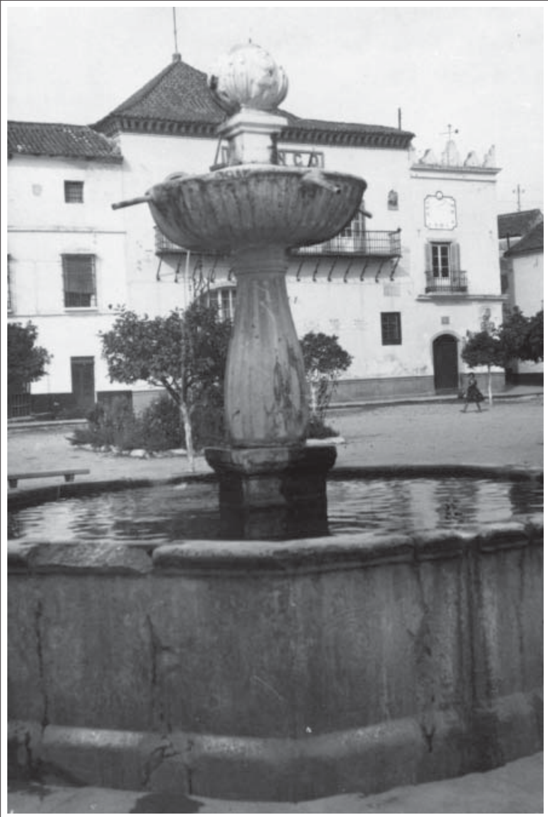
📍 Plaza del Generalísimo, hoy de los Naranjos. Postal años 50 (Edic. J. Belón Lima.).

no aportaba los nutrientes necesarios. Las legumbres se cocinaban sin grasa, la carne desapareció de la dieta, los huevos eran artículos de lujo, que se vendían a escondidas y como mucho se daban a los enfermos; el café se sustituyó por todo tipo