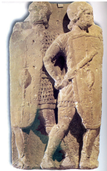
9. RELIEVE CON DOS GUERREROS ROMANOS (ESTEPA, SEVILLA).

La maniobra más utilizada por Viriato fue la emboscada, donde se mezclan rapidez y sorpresa. Se efectúa generalmente en un desfiladero, o en pasos angostos, donde los soldados se ven obligados a marchar en columna alargada y estrecha, con lo que ofrecen un magnífico objetivo para el ataque. Viriato es un maestro en el arte de atraer al enemigo a la emboscada; en ella, destruye al enemigo, mientras que con la retirada fingida le induce a la persecución precipitada y desordenada y entonces se vuelve rápidamente y le contraataca, lo que provoca aún más desorden en las tropas enemigas. Un objetivo especialmente vulnerable eran los convoyes de abastecimiento y los forrajeadores.