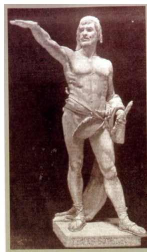
17. ESTATUA DE VIRIATO EN ZAMORA.

Y el honor es el elemento más sustancial en la vida de un guerrero. Una vida que termina en buena medida con la muerte y que sólo el sacrificio sangriento podía paliar de algún modo, pues la sangre caliente vivificaba al alma del difunto y le permitía participar en el recuerdo de los vivos. De ahí que los compañeros del guerrero, en este caso de Viriato, quieran participar en la revivificación del caudillo llorando derramando su propia sangre sobre la tumba en un torneo fúnebre. Todo esto nos recuerda también la épica homérica, que narra los juegos que Aquiles celebró en honor de su amigo Patroclo. 45 De hecho, existen fuertes indicios para creer que, en sus orígenes, los juegos olímpicos no eran otra cosa sino una asamblea o reunión para celebrar juegos fúnebres.