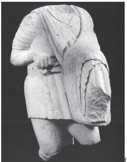
7. GUERRERO IBÉRICO DE EL PAJARILLO (HUELMA, JAÉN).

Y es, a partir de este momento, cuando, por primera vez, Urso (Osuna) entra en la órbita de Viriato. Con toda seguridad, Viriato llegó hasta la propia ciudad de Urso o a sus inmediaciones, puesto que sabemos que, en el 147 a.C., al frente de unos 10.000 lusitanos penetró en Turdetania por el valle del Guadalquivir y que sus tropas fueron cercadas junto a Urso por las del pretor Cayo Vetilio, que había llegado hacía poco a la Ulterior con un nuevo ejército. De nuevo se entablaron negociaciones. Vetilio les ofrecía tierras de cultivo si se rendían y entregaban las armas. Fue entonces, como hemos señalado, cuando se impuso la personalidad de Viriato recordando a sus compatriotas que los romanos no cumplían nunca sus pactos, ni sus promesas, ello motivó la suspensión de las negociaciones. Es probable que las negociaciones se realizaran en la propia Urso o en algún lugar cercano a la ciudad.