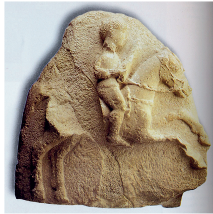
5. ESTELA IBÉRICA CON FIGURA DE JINETE (OSUNA, SEVILLA).

Viriato se presenta en ambos pasajes como un hombre, cuya fortaleza y virtud han surgido de su vivencia juvenil en un estado de naturaleza. Vivir en un medio hostil, probablemente en zona de montaña, entre piedras y animales, le va a dotar de una gran capacidad de sufrimiento y de gran agilidad física, expresadas en una fundamental autarquía con desprecio de las riquezas y los lujos de la vida "civilizada". Una vez que se convirtió en jefe y general de los lusitanos, Viriato se caracterizó por su extremada justicia para con sus compañeros, compartiendo siempre con ellos todos los bienes por igual. Viriato poseía también una sabiduría natural innata, de enorme valor en la toma de decisiones, a pesar de no haber tenido una educación reglada. Sus razonamientos solían ser muy acertados «como correspondía a su naturaleza no torcida ni educada por ningún maestro». Ahora bien, desconocemos cuánto había de realidad en todo esto. No lo sabemos, pero son datos sumamente reveladores.