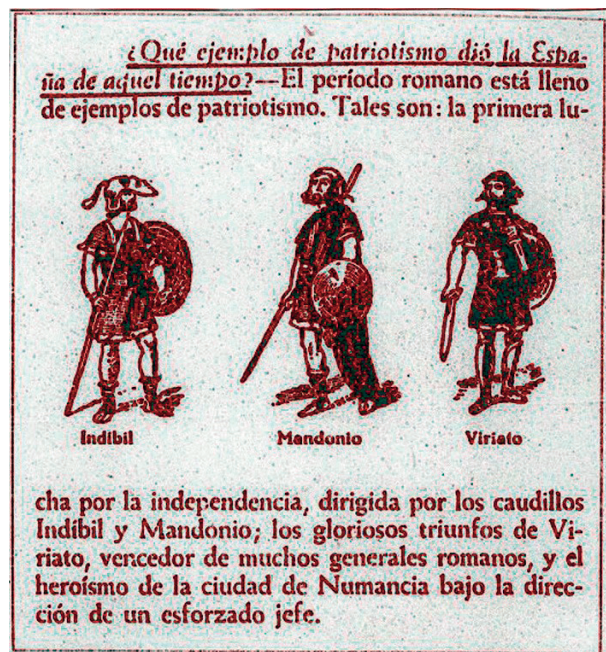
15. VIRIATO Y OTROS HÉROES DE LA ESPAÑA ANTIGUA.

Los hechos que narran ambos textos hay que situarlos en el 139 a. C., cuando Q. Servilio Cepión, que actuaba en este momento como procónsul, continúa la labor de su predecesor Q. Fabio Máximo Serviliano en su ofensiva romana para recuperar los valles del Guadalquivir y del Genil con la finalidad de perseguir y acabar con Viriato en la Beturia , donde éste, aprovechando una victoria en la localidad de Arsa 40 , había solicitado la paz desde una posición de fuerza. Cepión denuncia ahora el tratado de paz que había llegado a firmarse y persigue a Viriato hacia el norte, entre carpetanos y vettones. El cónsul Popilio Lenas se une a la ofensiva de Cepión