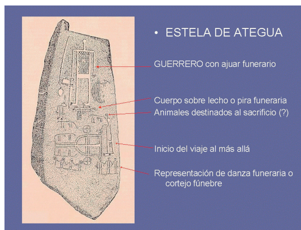
14. ESTELA DE ATEGUA (CÓRDOBA).

Pero la paz duró muy poco tiempo. Aunque el Senado y el pueblo romano habían ratificado, ciertamente, el tratado, no faltaron voces que se alzaron en su contra, declarando dicha paz como indigna al haber cedido a Viriato territorios romanos. La paz también fue considerada por algunos como “vergonzosa”. Por ello, cuando, en el 139 a. C., Quinto Servilio Cepión llegó a Hispania en calidad de procónsul, la situación va a cambiar de manera radical. Su actitud fue nuevamente guerrera. Primero solicitó autorización del Senado para promover algunas acciones contra Viriato, luego se manifestó en contra del tratado, presentándolo ante el Senado como contrario al honor de Roma y, finalmente, inició las hostilidades. Viriato se acogió al tratado, pero el Senado anuló el tratado de paz y dio a Cepión la posibilidad de retomar abiertamente la guerra. Viriato se vio obligado a evacuar algunas ciudades de la Beturia, como Arsa/Erisana , y se retiró hacia la Carpetania hasta donde lo siguió Cepión. Cuando Cepión lo tenía cercado, Viriato empleando nuevamente su exitosa táctica militar consiguió escaparse, pero Cepión lo persiguió por las montañas lusitanas hasta los territorios de los vetones y galaicos. Este camino sería después conocido como “Vía de la Plata”. 36