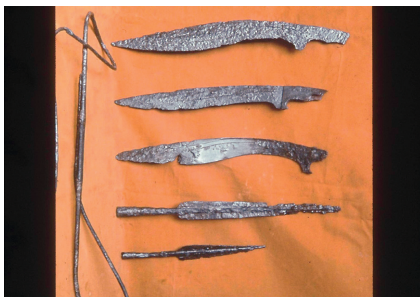
10. ARMAS IBÉRICAS (FALCATAS, PUNTAS DE LANZA Y SOLIFERREUM).