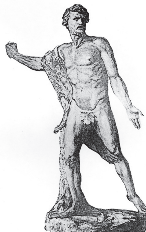
16. VIRIATO (DIBUJO DE J. BELVERT).

Esta práctica nos lleva directamente al mundo del honor buscado por el guerrero, que se sustentaba en despojar al enemigo de una parte importante de su cuerpo, como también hacían los romanos, egipcios y otros pueblos 44 . El honor obtenido en todos los casos se consideraba muy grande.