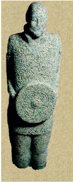
8. ESTATUA DE GUERRERO GALAICO-LUSITANO (GALICIA).

La maniobra más utilizada por Viriato fue la emboscada, donde se mezclan rapidez y sorpresa. Se efectúa generalmente en un desfiladero, o en pasos angostos, donde los soldados se ven obligados a marchar en columna alargada y estrecha, con lo que ofrecen un magnífico objetivo para el ataque. Viriato es un maestro en el arte de atraer al enemigo a la emboscada; en ella, destruye al enemigo, mientras que con la retirada fingida le induce a la persecución precipitada y desordenada y entonces se vuelve rápidamente y le contraataca, lo que provoca aún más desorden en las tropas enemigas. Un objetivo especialmente vulnerable eran los convoyes de abastecimiento y los forrajeadores.