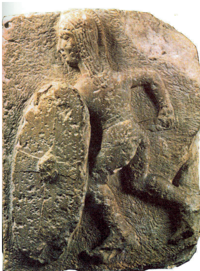
4. GUERRERO IBÉRICO CON ESCUDO (OSUNA, SEVILLA). DE PARECIDA FORMA SE EXPRESA DIÓN CASIO:

El lusitano Viriato, de oscuro linaje, según algunos, pero famosísimo por sus hazañas, ya que de pastor se hizo bandolero y después general, era por sus condiciones naturales y por los ejercicios que hacía extremadamente rápido en la persecución y en la huida y muy fuerte en la lucha a pie firme. Los manjares comunes y una bebida sin refinamientos eran los que con mayor placer tomaba: pasó la mayor parte de su vida al aire libre, y se contentó siempre con los lechos que la misma naturaleza le ofrecía. Por esta causa fue superior a toda clase de cansancios e inclemencias, nunca sufrió del hambre, ni se lamentó de ninguna contrariedad, sabiendo sacar provecho de todas las circunstancias desfavorables. Dotado tanto por la naturaleza como por su cuidado de estas cualidades físicas, sobresalía en mucho más por las cualidades de su espíritu. Era rápido en comprender y en ejecutar lo debido, viendo a un tiempo lo que debía hacerse y la oportunidad para ejecutarlo, capaz también de fingir conocimiento de lo más recóndito e ignorancia de lo más evidente. Tanto en el mando como en la obediencia aparecía siempre el mismo, ni modesto ni soberbio; sino que por humildad de su origen y por el prestigio de su poder consiguió no ser ni inferior ni superior a nadie. En suma, no emprendía la guerra ni por avaricia, ni por amor al mando, ni por cólera, sino que la hacía por ella misma, y es por esto sobre todo que fue temido por belicoso y conocedor del arte bélico. 12