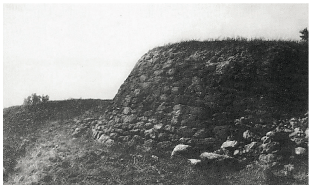
3. MURALLA DE URSO (OSUNA, SEVILLA).

No mucho después, cuantos escaparon a la perfidia de Lúculo y Galba, reunidos hasta 10.000 invadieron la Turdetania. Contra ellos se dirigió Cayo Vetilio, llegado de Roma con algunas tropas nuevas a las que juntó las que había en Hispania, unos 10.000 en total. Sorprendiendo a los lusitanos en sus correrías, mató a muchos y obligó a los restantes a refugiarse en un lugar, provocándoles una situación difícil, pues quedándose allí sucumbirían al hambre y, si salían, a los romanos. En vista de esto, los lusitanos enviaron una legación con ramos de olivo a Vetilio pidiéndoles tierras para establecerse y prometiéndole permanecer sometidos al pueblo romano en adelante. Vetilio prometió darles tierras y se dispuso a formalizar el pacto cuando Viriato, que había logrado escapar de la crueldad de Galba y se hallaba entre ellos, les puso en guardia contra la perfidia de los romanos, recordándoles cuántas veces les habían atacado faltando a sus juramentos y cómo aquel ejército no era otra cosa que los restos escapados a los perjuros de Galba y Lúculo, diciéndoles que no desearan salir de aquella situación si querían obedecerle. 9