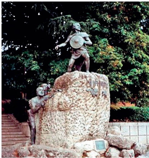
18. ESTATUA DE VIRIATO EN VISEU, PORTUGAL (MARIANO BENLLIURE).

Por otro lado, si entre los lugartenientes y hombres de confianza de Viriato se mencionan a tres ursonenses, es fácil deducir que compartirían el mismo tipo de vida, es decir, el militar. El guerrero es un individuo que voluntariamente busca en la lucha su forma de vida. Y esto es, precisamente lo que decía Dión Casio de Viriato: «no emprendía la guerra ni por avaricia, ni por amor al mando, ni por cólera, sino que la hacía por ella misma». 50 Lo único que pretende es conseguir prestigio y estima, que se mide por el honor que otros rinden al guerrero por su sabiduría y valor, y que se materializa en la parte especial del botín que le corresponde si ha logrado que otros le sigan en sus empresas. El valor en el combate era fundamental, pero debía ir acompañado por la capacidad oratoria de convencer a los demás y la generosidad para con sus compañeros, primero, y para con el conjunto de su pueblo después. Características, todas ellas, que los textos resaltan en la figura de Viriato y que hemos de suponer que compartían sus iguales- como esos tres ursonenses ( Audax , Ditalcos y Minuros/Nicorontes ) de mediados del siglo II a.C. que, finalmente acabaron con Viriato mediante la traición.