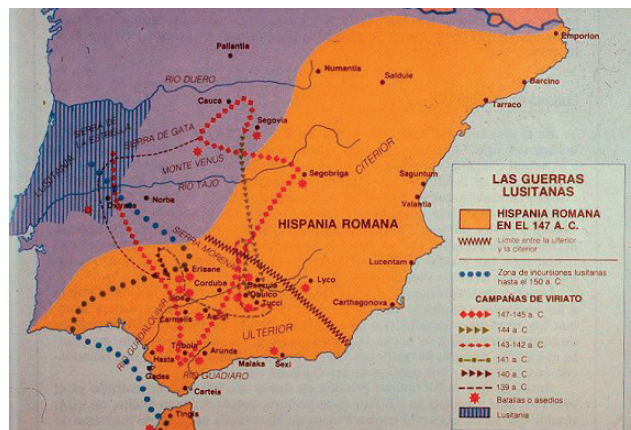
1. GUERRAS LUSITANAS Y CAMPAÑAS DE VIRIATO.

Viriato, es, sin duda, el mejor ejemplo y el máximo exponente de estos jefes guerreros del mundo indígena hispano y del que mayor documentación tenemos. 3 Su historia trasciende la realidad hasta convertirse en leyenda. Es uno de los grandes héroes hispanos en los que más difícil resulta separar el punto donde termina la historia y donde empieza la leyenda. 4