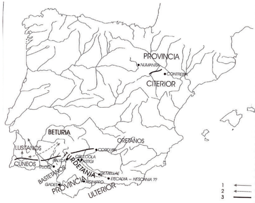
2. La guerra en Lusitania en el 141 a. C.: 1. Campañas de Serviliano. 2. Retirada de Viriato. 3. Frentes lusitanos.

Veamos algunos datos históricos sobre el personaje. Sabemos que Viriato 5 vivió a mediados del siglo II a.C. en la provincia hispana que los romanos denominaron Lusitania , cuya delimitación precisa es aún, hoy día, problemática, pero que abarcaba territorios portugueses y españoles 6 , de aquí que historiadores de ambos países se hayan disputado, desde siempre, su lugar de nacimiento, dando origen a una larga polémica nacionalista, tan absurda como estéril, toda vez que, por entonces, ni España, ni Portugal existían como estados independientes. 7