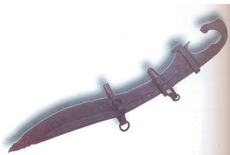
11. FALCATA IBÉRICA.

y así, por su equidad en repartir el botín, obtuvieron un gran poder no sólo Bardilis, bandolero ilirio, sino también y mucho mayor el lusitano Viriato. 26