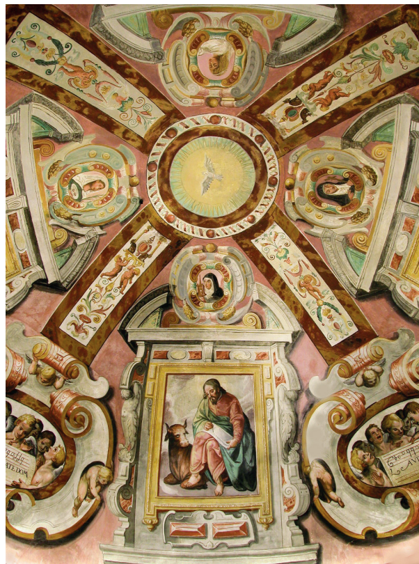
CAPILLA DE NUESTRA SEÑORA DE LA EXPECTACIÓN. DETALLE DE LA CÚPULA.

de ser Padres de la primera iglesia cristiana. En calidad de pilares de la institución tienen atribuidos los espacios triangulares de las pechinas, que soportan el cielo de la capilla.