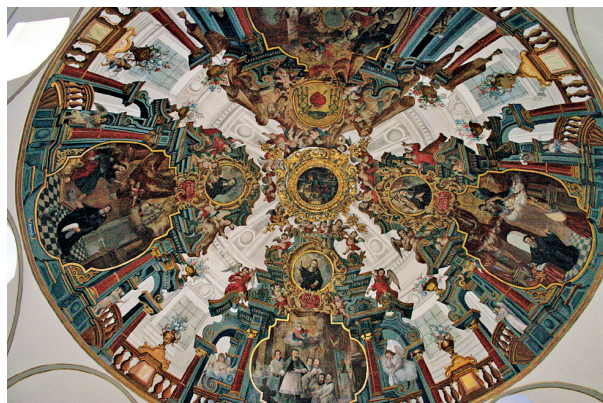
IGLESIA DE JESÚS, MARÍA Y JOSÉ. MEDINA SIDONIA. CÚPULA PINTADA.

En todo caso, parece que existió un patrón compositivo que circuló entre las iglesias agustinas, como se desprende del hecho de que más de un siglo después, se reproduzca un esquema parecido en el convento de Jesús, María y José (“de las monjas de arriba”) de Medina Sidonia (Cádiz).