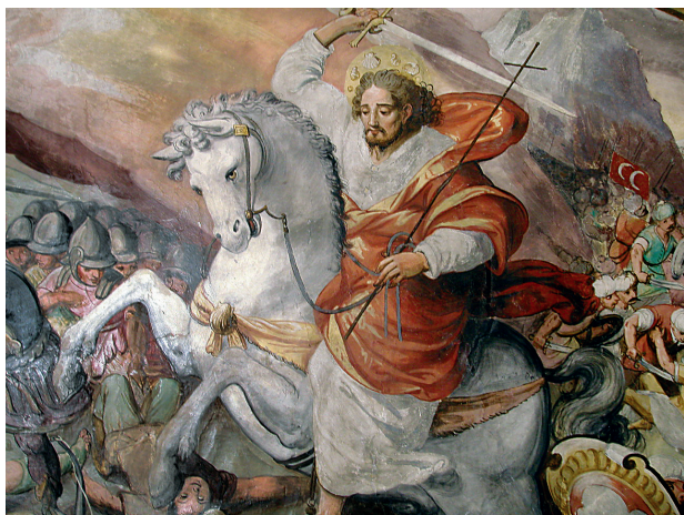
CAPILLA DE NUESTRA SEÑORA DE LA EXPECTACIÓN. SANTIAGO EN LA BATALLA DE CLAVIJO.