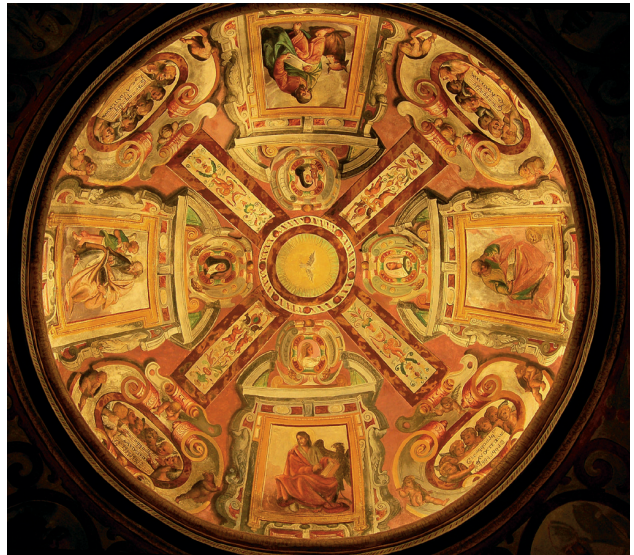
CAPILLA DE NUESTRA SEÑORA DE LA EXPECTACIÓN. CÚPULA PINTADA.

más que con certezas, la historiografía ha dado la razón al tratadista, pese a la falta de buenos argumentos por ausencia de murales de envergadura. De ahí el interés de piezas como la que a continuación se pone en valor.