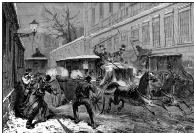
Atentado contra la vida del general Prim, en la calle del Turco, la noche del 27 de diciembre de 1870

Miguel Donoso Álvarez, Don Pedro Artola y Villalobos, Don Juan Duarte Navarro, Don Miguel Belón Torres, Don Salvador Cortés Moreno y Don Domingo Grego Pérez». Seguidamente los ediles proceden a la elección de alcalde conforme a la ley, «resultando del escrutinio practicado después de leídas en voz alta las papeletas, elegido para el referido cargo Don Pedro de Artola y Villalobos por seis votos, apareciendo cuatro cédulas en blanco». Posteriormente toca elegir a los tenientes de alcaldes, «resultando elegidos para primero por seis votos con cuatro papeleteas en blanco Don Salvador Rodríguez Morilla. Para segundo, por igual número de votos y las mismas papeletas en blanco Don Miguel Belón Torres, y para tercero por idéntico número de votos e igual número de papeletas en blanco Don Salvador Delgado Llanos». En la misma forma se elige también a los procuradores síndicos, «resultando elegidos para este cargo para primero Don Antonio Céspedes Tapia por seis votos y para segundo Juan Duarte Navarro por cinco, apareciendo cuatro cédulas en blanco» 71 . Pese a la continuidad de Pedro de Artola como alcalde, su limitada mayoría nos puede hacer intuir ciertas fisuras en el gobierno local.