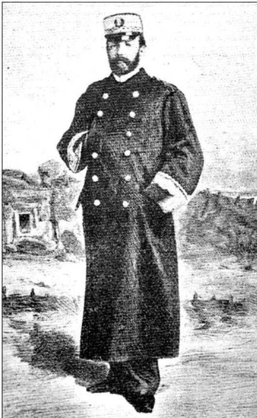
José López Domínguez