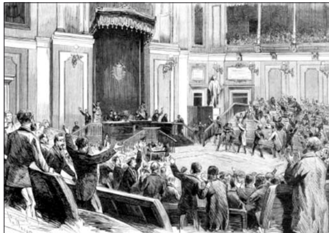
Proclamación de la República por la Asamblea nacional

La I República es proclamada el 11 de febrero de 1873, tras reunirse en Asamblea Nacional el Congreso y el Senado, por 258 votos a favor y 32 en contra. Fue posible gracias a los intereses de radicales y federales, los primeros abandonarían la monarquía pero los segundos se comprometerían a mantener una república unitaria 88 . El pacto era demasiado frágil para las pretensiones de ambos grupos.